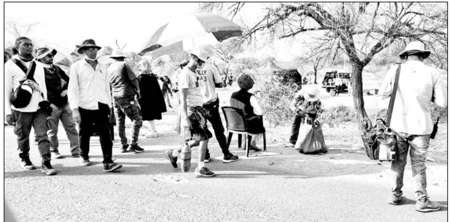
मसूदा उपखंड के गांव देवमाली में बॉलीवुड फिल्म जॉली एलएलबी पार्ट-3 की शूटिंग हुई।

फिल्म की शूटिंग को लेकर मौके पर कुछ ग्रामीण भी फिल्म की शूटिंग देखने पहुंचे। फिल्म के दृश्यों के फिल्मांकन को लेकर स्थानीय लोगों के शामिल होने के साथ साथ यूनिट के काफी संख्या में सदस्यों के मौजूद रहने से गांव में फिल्मी माहौल नजर आया। ग्राम में राजस्थानी फिल्मों एवं गीतों को लेकर शूटिंग होने के बाद अब