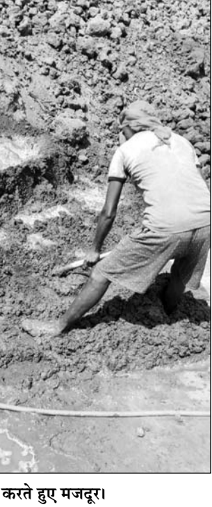
काम करते हुए मजदूर।

से मिचने को हटाने का काम करता है। खाखला वाला-इटो को पकाने के लिए खाखला या तुड़ी डालने का काम करता है। जालाई मिश्री-कच्ची ईटो को पकाने का काम करता है। निकासी वाले-ईट भट्टे से पक्की ईटों को बाहर निकालने का काम करते हैं। इन कामों में अलग अलग मजदूर काम करते हैं जिनका जिसमें कौशल होता है वो उसमें काम करता है। पूरे सीजन में कोई छुट्टी नहीं मिलती है हमेशा काम में लगे रहना पड़ता है। मजदूर बताते हैं कि कभी कभार बीच सीजन में अगर घर जाना हो तो मालिक और टेकेदार आयो रेट से हिसाब करते हैं। पूरे सीजन काम करने पर एक मजदूर को बाव भी ज्यादा कुछ बचता नहीं है सिर्फ घर का खर्चा चल जाता है। ईट भट्टे की परिस्थितियों बहुत ही गंभीर हैं। मजदूरों को बड़ी मुश्किलों के साथ इन परिस्थितियों का सामना करना पड़ता है। ईट भट्टे मजदूरों को न्यूनतम वेतन भी नहीं मिलता है। इन सब समस्याओं के निवारण के लिए राजस्थान प्रदेश ईट भट्टे मजदूर यूनिन 2012 से संघर्ष कर रही है। यूनिनयन के कार्यों से कुछ जिलों में कुछ समस्याओं का निवारण हुआ है लेकिन अभी भी बहुत कुछ करना बाकी है।