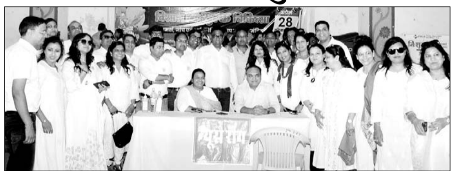
पेसिफिक में निशुल्क जांच, भर्ती और ऑपरेशन की सुविधाओं वाला चिकित्सा शिविर संपन्न हुआ।

उदयपुर, (निंस्)। पेसिफिक मेडिकल कॉलेज एण्ड हॉस्पिटल, भीलों का बेदला उदयपुर एवं वाइब्रेन्ट अग्रवाल ग्रुप उदयपुर के संयुक्त तत्वावधान में शहर में पहली बार सबसे बड़ा निशुल्क जांच, भर्ती और ऑपरेशन की सुविधाओं वाला चिकित्सा शिविर रविवार को आरएमवी स्कूल के सभागार में संपन्न हुआ।