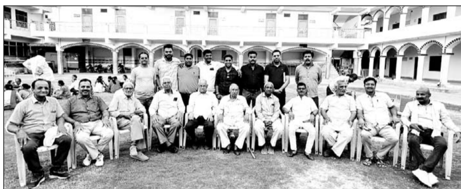
पुष्कर के गौतम आश्रम में गुर्जर गौड़ ब्राह्मण संस्था की बैठक आयोजित हुई।

पुष्कर, (निंस्)। गौतम आश्रम में गुर्जरगौड़ ब्राह्मण प्रगतिशील संस्था व नवयुवक मंडल की बैठक का आयोजन किया, महर्षि गौतम व माता अहिल्या की प्रतिमा पर महापूजा कर संस्था की बैठक का शुभारंभ किया गया।