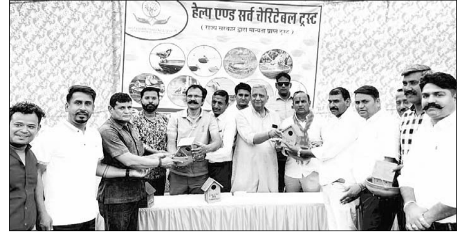
हेल्प एण्ड सर्व ट्रस्ट द्वारा शिव बालाजी धाम मन्दिर, दिल्ली बाईपास रोड पर पक्षियों के लिए परिण्डे व घरौदे वितरण कार्यक्रम का शुभारम्भ किया गया।