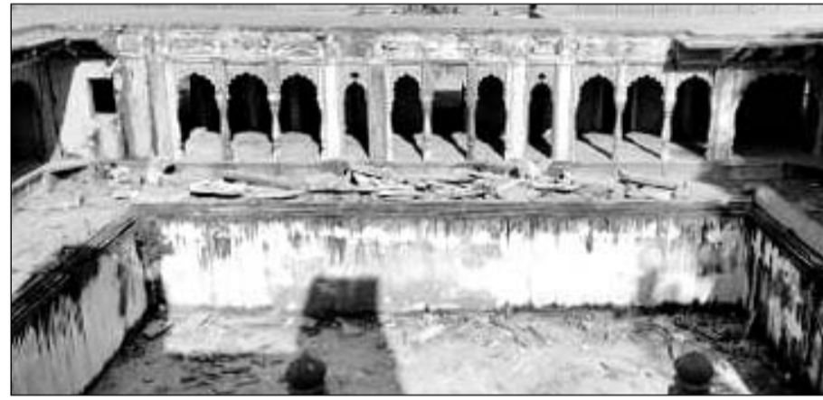
करौली का शिकारगंज महल देखरेख के अभाव में खंड-खंड होता नजर आ रहा है।