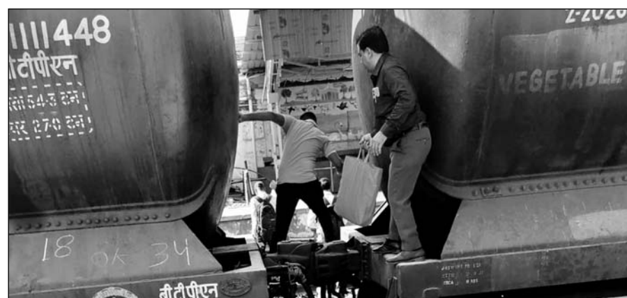
फुलेरा जंक्शन पर रेलयात्री जान जोखिम में डालकर रेलवे स्टेशन पहुंच रहे हैं।

परेशानियों का सामना करना पड़ेगा। प्रशासन द्वारा रेलवे स्टेशन के अंतिम छोर में बनाया गया ओवरब्रिज भी काफी ऊंचा होने के कारण बुजुर्गों को यहां से आने-जाने में काफी दिक्कतों का सामना करना पड़ता है। इसके चलते यहां एस्केलेटर या लिफ्ट लगे तो जरूर इनको राहत मिल सकती है लेकिन अभी वर्तमान में स्थिति काफी दयनीय है। जबकि फुलेरा से प्रतिदिन 15 हजार से अधिक दैनिक रेलयात्री अपनी रोजी रोटी कमाने के लिए जयपुर एवं अजमेर सहित अन्य स्थानों के लिए अप-डाउन करते हैं। कई बार तो ओवरब्रिज होकर जाते जाते इनकी ट्रेन भी छूट जाती है।