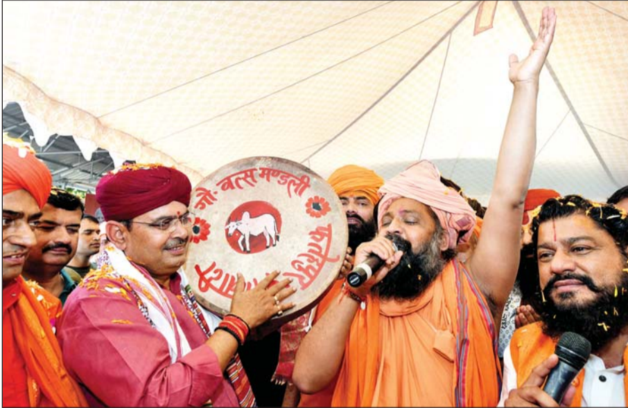
भजनलाल शर्मा ने सोमवार को मुख्यमंत्री निवास पर गौशालाओं की अनुदान राशि बढ़ाने पर आयोजित आभार सभा को संबोधित किया। उन्होंने सभा में आए संतों के साथ फूलों की होली खेली, चंग बजाकर होली के गीत गाए तथा सभी को होली की बधाइयां दीं।

शर्मा ने कहा कि प्रदेश के पशुपालकों को आर्थिक सुरक्षा प्रदान