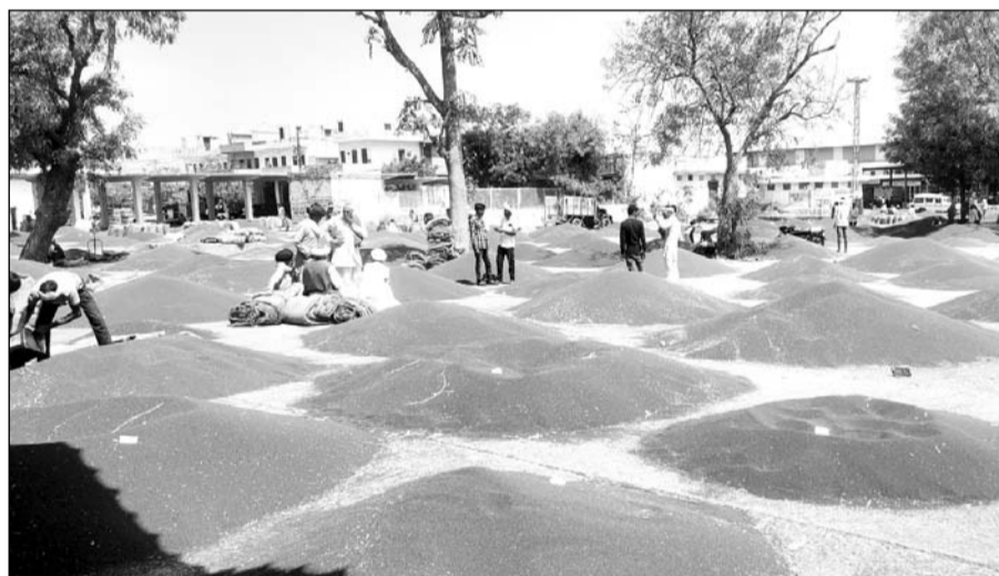
निवाई में कृषि मण्डी परिसर में दुकानों के बाहर लगे हुए सरसों के ढेर।