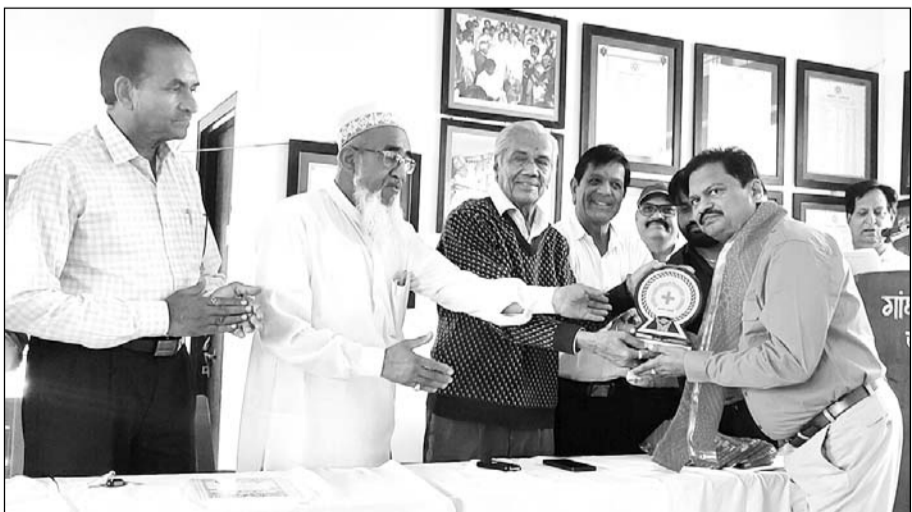
शिविर के समापन पर प्रशिक्षक चिकित्सक को सम्मानित करते अतिथि।