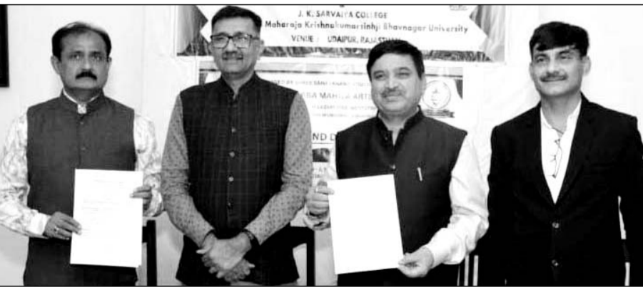
राजस्थान विद्यापीठ और नंदकुंवरबा कॉलेज के बीच एमओयू हुआ।