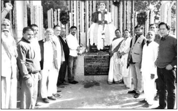
ज्योतिबा फुले स्मारिक पर श्रद्धांजलि अर्पित करते हुए राजनीतिक, सामाजिक संगठनों के प्रतिनिधि।