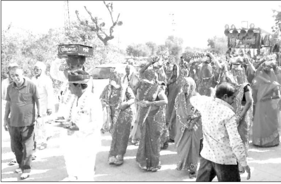
यज्ञ व भागतव शोभायात्रा भी आयोजित की गई।