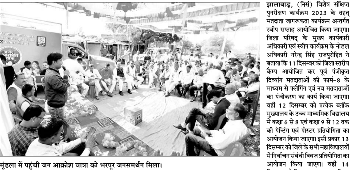
मूंडला में पहुंची जन आक्रोश यात्रा को भरपूर जनसमर्थन मिला।