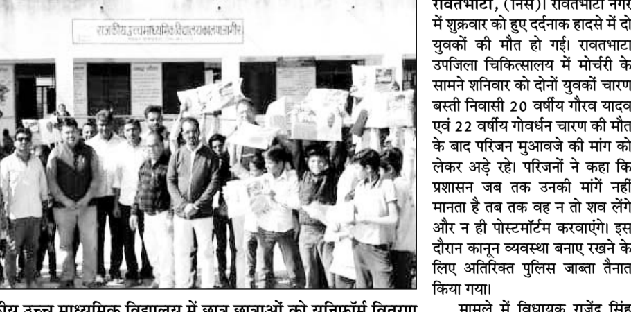
छीपाबडौद के काल्याजागीर राजकीय उच्च माध्यमिक विद्यालय में छात्र छात्राओं को यूनिफॉर्म वितरण किया गया।