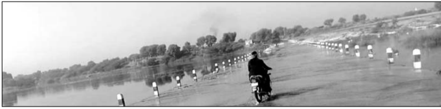
टोडारायसिंह-टोंक क्षेत्र के मध्य बनी चूली रपट पर व्यर्थ बहता बीसलपुर की नहरों से आया पानी।

टोंक, (निसं)। बीसलपुर परियोजना की बांघी मुख्य नहर से खेतों में सिंचाई के लिए छोड़ा गया पानी अभी तक टेल पर भी नहीं पहुंचा है, वहीं नहर में अधिक पानी ने बीसल नदी में एक बार फिर वर्षा के मौसम की याद दिला दी है। जिससे टोडारायसिंह-टोंक क्षेत्र के मध्य बने चूली रपट पर पानी की चादर चल रही है। जिससे बीसलपुर का मीठा पानी अधिकारियों की अनदेखी व लापरवाही से व्यर्थ बह रहा है। बीसलपुर की नहरों से नदी में आए पानी से फसल में खेती करने वाले किसानों को नुकसान भी खराब हो रही है।