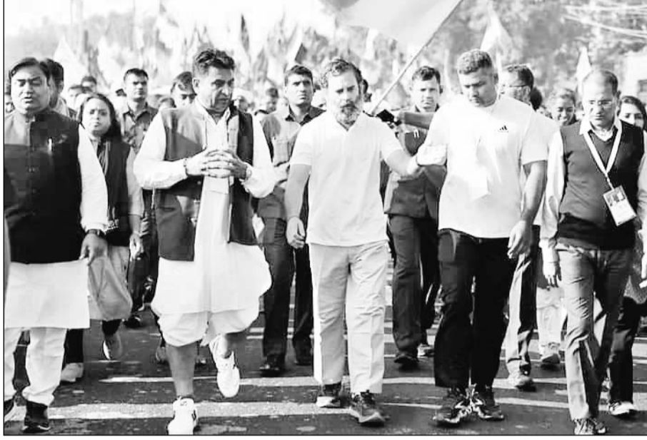
राहुल गांधी की भारत जोड़ो यात्रा शनिवार को बून्दी के केशोरायपाटन से शुरू हुई। यात्रा में धर्म गुरुओं के साथ-साथ सफाईकर्मियों भी शामिल हुये। पूर्व उप मुख्यमंत्री सचिन पायलट शेरगढ़ गैस काण्ड के पीड़ितों से मिलने जोधपुर गये हुये थे इसलिए वे टी ब्रेक के बाद अरनेठा से यात्रा में शामिल हुये।

ज्ञातव्य है कि यात्रा सुबह 6 बजे गुडली से रवाना होनी थी। लेकिन बाद में यात्रा 8:40 बजे केशोरायपाटन से प्रारंभ की गई, जिससे स्थानीय आमजन और ग्रामीण निराश नजर आए।