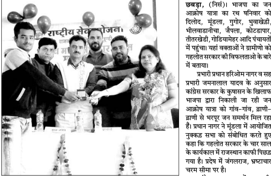
प्रतियोगिता के विजेताओं को पारितोषिक देकर सम्मानित किया।

बून्दी (निसं)। राजकीय महाविद्यालय में संचालित राष्ट्रीय सेवा योजना द्वारा कुशल भारत-सशक्त भारत थीम पर शिबिर आयोजित किया गया।