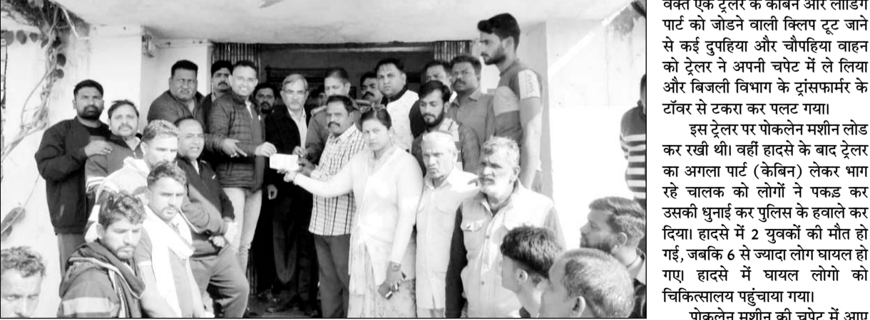
उपखंड कार्यालय में एचसीसी कंपनी की ओर से पांच-पांच लाख रुपए की राशि के चैक दोनों के परिवारों को सौंपा।