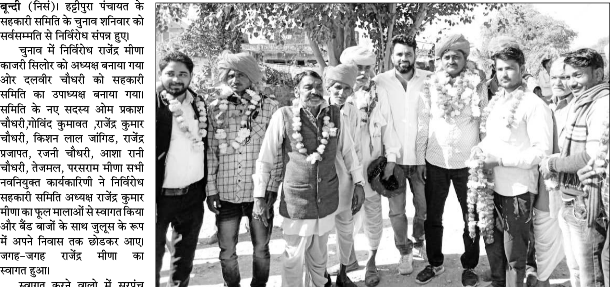
हट्टीपुरा सहकारी समिति निर्विरोध निर्वाचित अध्यक्ष व कार्यकारिणी का स्वागत किया गया।

बून्दी (निसं)। हट्टीपुरा पंचायत के सहकारी समिति के चुनाव शनिवार को सर्वसम्मति से निर्विरोध संपन्न हुए।