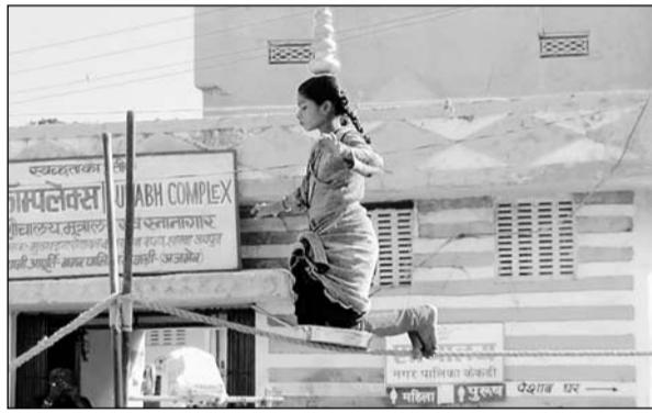
जान जोखिम में डालकर करतब दिखाती छोटी बच्ची।

नहीं दी जा सकती है। जिस पर याची ने हार्डकोर्ट में चुनौती दी। याची की ओर से बताया गया कि दिव्यांगजन अधिका अधिनियम 2016 और राजस्थान दिव्यांगजन अधिका अधिनियम, 2018 के प्रावधानों के अनुसार विशेष योग्यजन वर्ग में किसी अन्य राज्य का मूल निवासी होने के आधार पर नियुक्ति से वंचित नहीं किया जा सकता है। जबकि विज्ञाप में भी स्पष्ट लिखा गया था कि संपूर्ण भारत के किसी भी राज्य के सक्षम अभ्यर्थी द्वारा जारी विकलांगता प्रमाण पत्र मांगना होगा। नियमानुसार दिव्यांगजन व्यक्ति को मूल निवासी होने के आधार पर नियुक्ति से वंचित करना संविधान के प्रावधानों के विपरीत है।