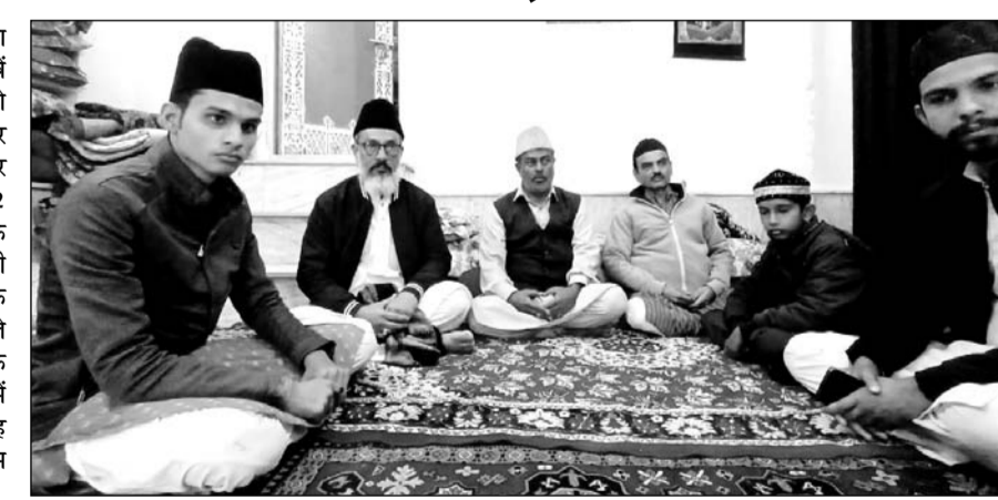
भीलवाड़ा का गौरी परिवार अजमेर पहुंचा, जो झंडे की रस्म अदा करेगा।