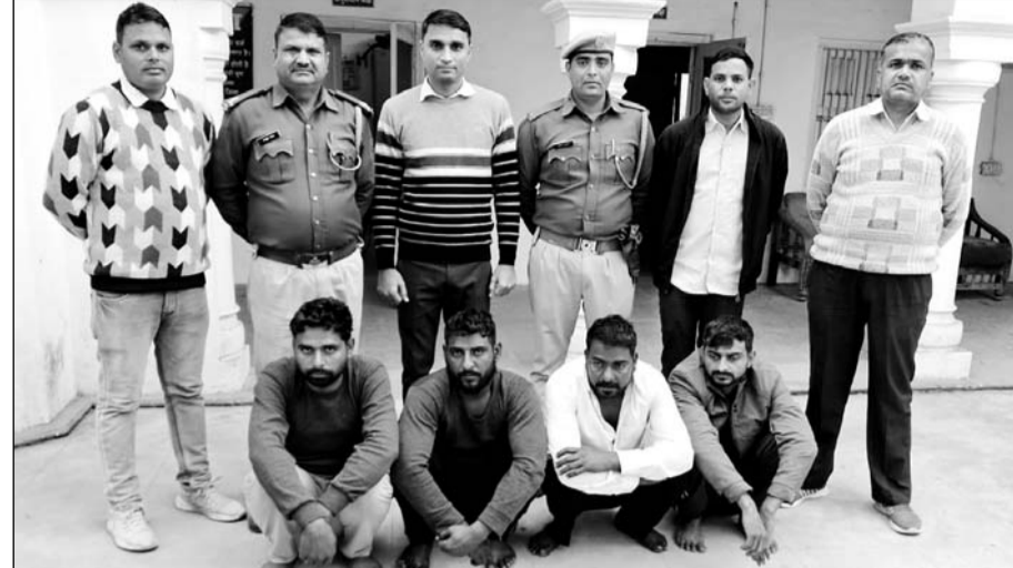
कोटपूतली पुलिस ने ए.टी.एम. लूट के चार आरोपियों को गिरफ्तार किया।

अन्तर्राज्यीय गैंग के चार शातिर बदमाश गिरफ्तार