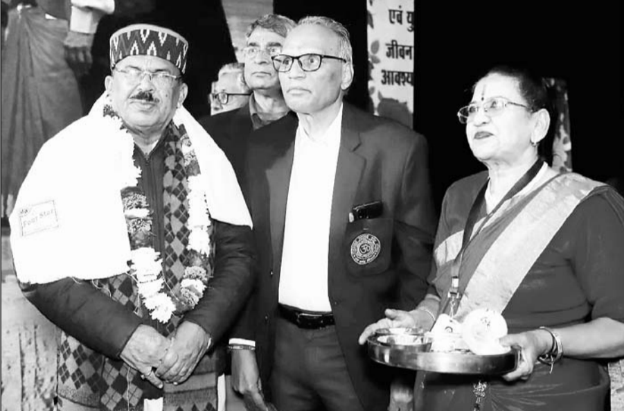
विधानसभा अध्यक्ष देवनानी का रविवार को जयपुर के राष्ट्रीय आयुर्वेद संस्थान में आयोजित यज्ञ, योग एवं युक्ताहार नववर्ष सम्मेलन में स्वागत किया गया।

जयपुर, (का.सं.)। विधानसभा अध्यक्ष वासुदेव देवनानी ने कहा है कि सभी मितराजुल कर स्वस्थ भारत की रचना करें। उन्होंने कहा कि शरीर, मन, मस्तिष्क स्वस्थ रहेंगे तब ही राष्ट्र की उन्नति होगी। उन्होंने लोगों से आह्वान किया कि वे राष्ट्र को स्वस्थ बनाने के लिए आवश्यक योग, यज्ञ और संतुलित आहार को आचरण में लाएं।