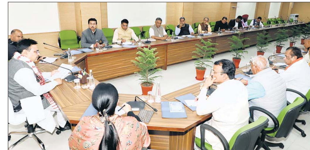
मुख्यमंत्री भजनलाल शर्मा ने अपने मंत्रिमंडल के सदस्यों को लंच दिया। लंच से पहले उन्होंने मंत्रिमंडल की अनौपचारिक बैठक भी ली।