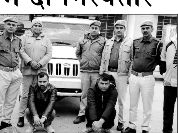
पुलिस ने विद्युत लाइट के तार चोरी के मामले में दो पकड़े।