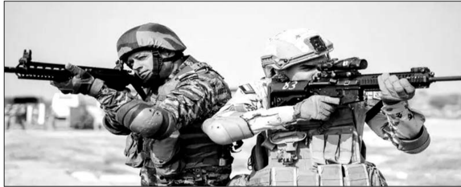
भारत व यूएई के सैनिकों ने एशिया की सबसे बड़ी युद्धाभ्यास स्थली महाजन फील्ड फायरिंग रेंज में संयुक्त युद्धाभ्यास किया।

बीकानेर, ( निर्स )। एशिया की सबसे बड़ी युद्धाभ्यास स्थली महाजन फील्ड फायरिंग रेंज एक बार फिर विदेशी सैनिकों के साथ हमारी सेना के संयुक्त युद्धाभ्यास का साक्षी बनी है। रेंज के धोरे राइफल से निकल रही गोलियों की आवाज के साथ बम के धमाके से गुंज रहे हैं। पहले पांच दिन के अभ्यास में भारत और यूएई के 90 सैनिकों ने एक-दूसरे के हथियारों को समझा और युद्ध के रणनीतिक कौशल पर बात की। अब फायरिंग और बम से हमले जैसे हालात पर अभ्यास शुरू हो गया है। एक दशक से संयुक्त राष्ट्र के चैप्टर के तहत काउंटर टेररिज्म पर हर साल विदेशी सेना के साथ महाजन रेंज में भारतीय सेना संयुक्त अभ्यास कर रही है। दूसरे देश की सैन्य टुकड़ी अपने हथियार और साजो-सामान के साथ आकर आतंकीयों पर सैन्य ऑपरेशन का अभ्यास करती हैं। अभी 2 जनवरी से यूएई और भारतीय सेना के बीच अभ्यास चल रहा है। भारत और अन्य देश के सैनिकों के 90 से 120 सैनिक 13 से 15 दिन तक संयुक्त अभ्यास करते हैं। दुश्मन के हमले या आतंकी हमले का महाजन रेंज में काल्पनिक छाका तैयार किया जाता है। अधिकोश युद्धाभ्यास दिसम्बर-जनवरी में होते हैं। कड़ाके की ठंड के सीजन में रैतीले