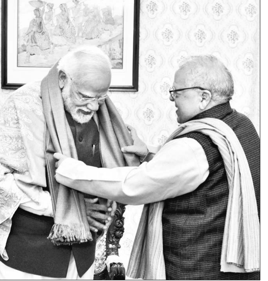
राज्यपाल कलराज मिश्र ने रविवार सुबह राजभवन विश्राम गृह में देश के प्रधानमंत्री नरेन्द्र मोदी से विशेष रूप से मुलाकात की। मिश्र ने इस अवसर पर शुभता के प्रतीक भगवान श्री गणेश की छवि में उकेरी राजस्थान की प्रसिद्ध मीनाकारी कला का स्मृति चिह्न भी उद्धृत किया। उन्होंने शॉल ओढ़ाकर प्रधानमंत्री का अभिनंदन किया। राज्यपाल मिश्र ने प्रधानमंत्री मोदी से इस दौरान प्रदेश के विकास से जुड़े विभिन्न मुद्दों और संवैधानिक जागरूकता के लिए किए जा रहे कार्यों पर चर्चा भी की।