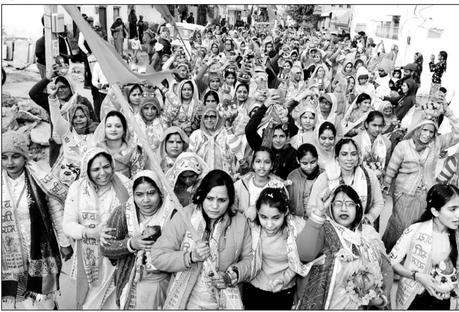
अक्षत शोभायात्रा स्थानीय श्रीराम मंदिर से रवाना होकर धर्म स्तूप, स्टेशन रोड़ व नई सड़क होते हुए नया बास स्थित शिव कला मंच पहुंची।