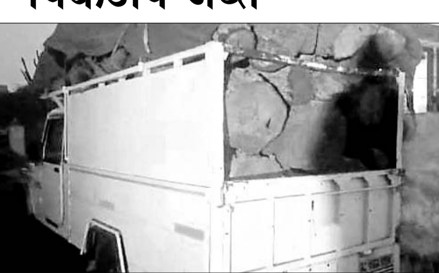
वन विभाग ने कार्रवाई कर हरि लकड़ियों से भरी पिकअप पकड़ी।