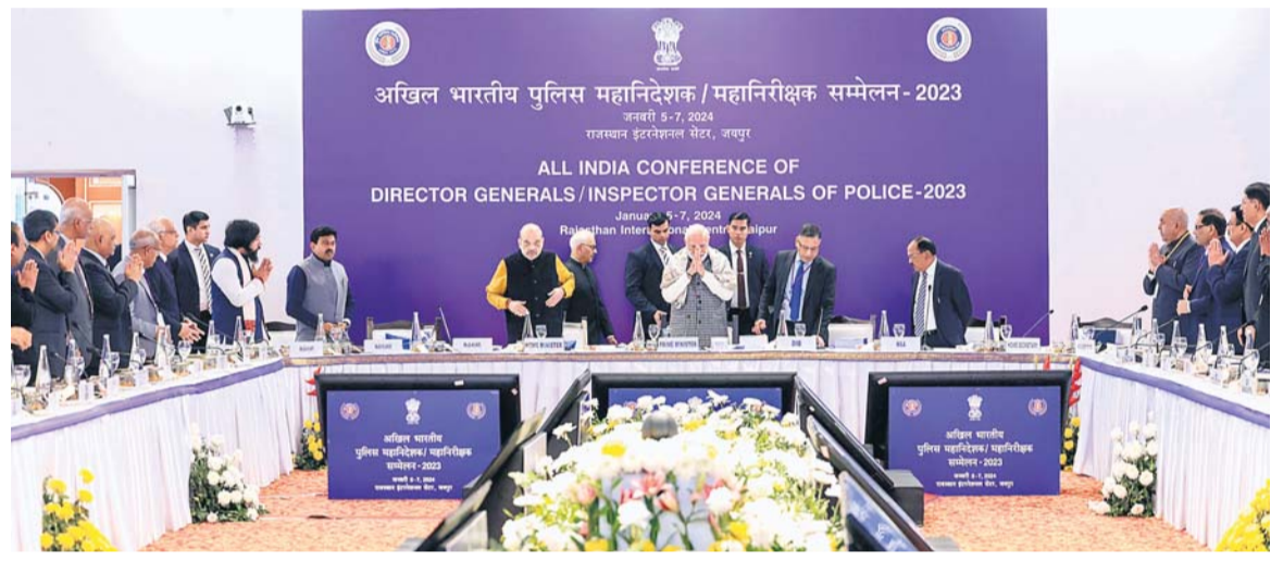
प्रधानमंत्री नरेन्द्र मोदी ने 58वीं डीजी-आईजी कॉन्फ्रेंस के समापन समारोह को संबोधित किया।

प्रधानमंत्री मोदी ने जयपुर के झालाना स्थित राजस्थान इंटरनेशनल सेंटर में आयोजित तीन दिवसीय 58 वीं डीजी-आईजी कॉन्फ्रेंस के समापन समारोह को संबोधित किया