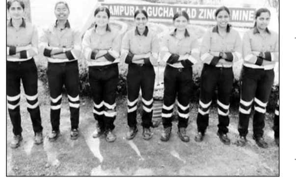
रामपुरा आगुचा माईस में महिला टीम ने पूर्ण प्रशिक्षण किया

भीलवाड़ा, (निर्स)। हिन्दुस्तान जिंक की राजपुरा दरीबा माईस के देश के पहली महिला रेस्क्यू टीम का गौरव हासिल करने बाद रामपुरा आगुचा माईस में महिला रेस्क्यू टीम ने अपना प्रशिक्षण पूर्ण कर देश में दूसरी महिला माईस रेस्क्यू टीम की उपलब्धी प्राप्त की है। रामपुरा आगुचा खदान का सुरक्षा में समावेशित और उत्कृष्टता की दिशा में एक महत्वपूर्ण कदम है। माइनेर रेस्क्यू एनस्टेशन, वेस्टर्न कोल फील्ड लिमिटेड, नागपुर के विशेषज्ञ मार्गदर्शन एवं खान सुरक्षा महानिदेशालय के निदेशों के अनुपालन में, रामपुरा आगुचा खदान की महिला इंजीनियर ने 18 दिनों का गहन प्रशिक्षण कार्यक्रम पूर्ण किया। अंडरग्राउंड माइन ऑपरेशंस एंड मेटेनेंस की 8 प्रतिभाशाली महिला इंजीनियरों को भूमिगत खदान बचाव तकनीकों में साधनाधीनपूर्वक प्रशिक्षित किया गया। प्रशिक्षण में टीम को महत्वपूर्ण जीवन-रक्षक कौशल, जिसमें सीपीआर, स्व-निहित क्लोज्ड सर्किट ब्रीदिंग उपकरण का उपयोग, पुनर्जीवित उपकरण, और