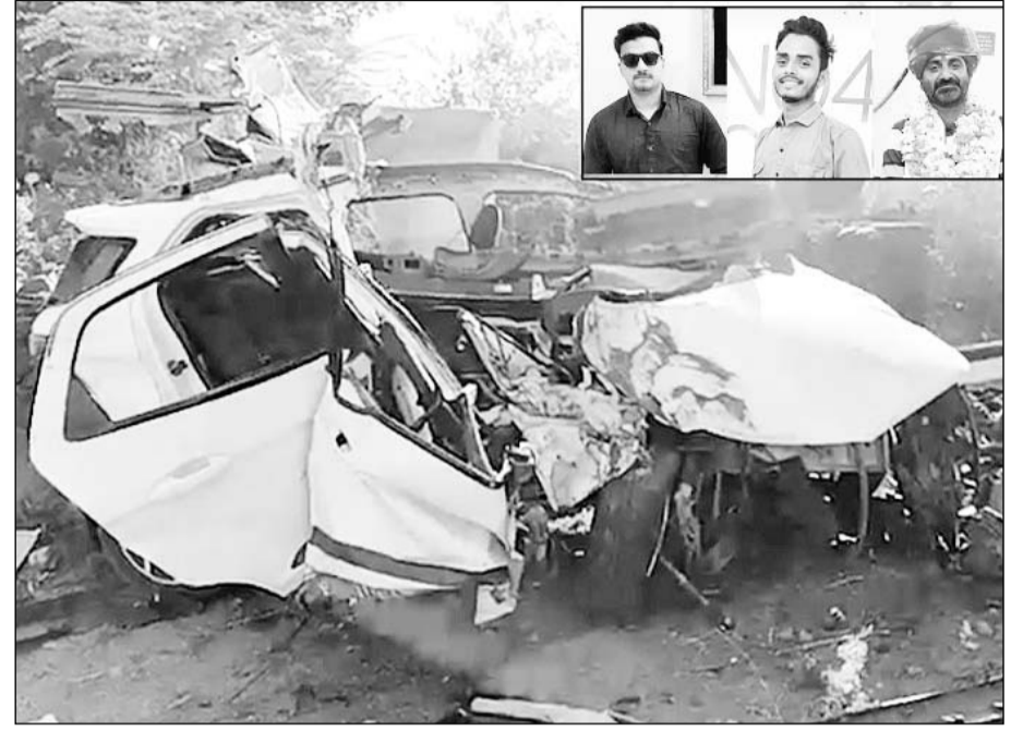
कालिंजरा-बागीदौरा मार्ग पर अनियंत्रित कार पेड़ों से टकराकर कार क्षतिग्रस्त हो गई।

बांसवाड़ा, (निर्स)। कालिंजरा-बागीदौरा मार्ग पर एक कार अनियंत्रित होकर पेड़ से टकरा गई जिससे तीन युवाओं की मौत हो गयी वहीं दो युवक गंभीर रूप से घायल हो गये।