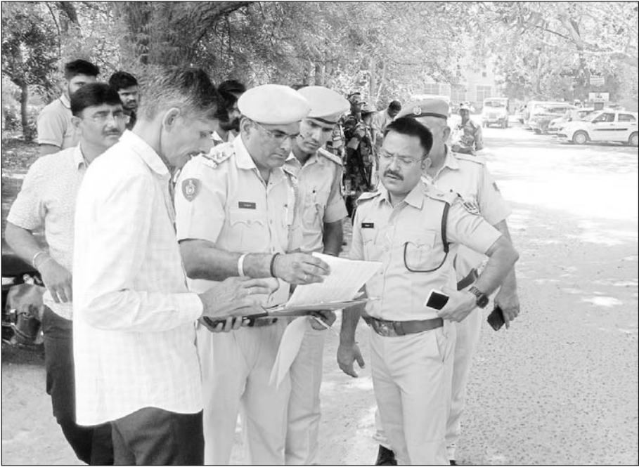
जोधपुर में पुलिस और प्रशासन ने सुरक्षा व्यवस्था कड़ी कर रखी है।

जोधपुर, (कासं)। राज्य में लोकसभा चुनाव के दूसरे चरण में जोधपुर में हुए मतदान के बाद ईवीएम मशीनें देर रात तक कड़ी सुरक्षा के साथ स्ट्रांग रूम में पहुंची हैं। अब पुलिस और प्रशासन ईवीएम मशीनों की सुरक्षा के लिये जुटा हुआ है।