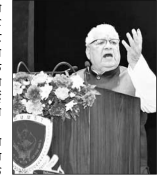
राज्यपाल कलराज मिश्र

जयपुर, (का.सं.)। राज्यपाल कलराज मिश्र ने कहा है कि फैकल्टी डेवलपमेंट के अंतर्गत शिक्षण की बोझिलता को दूर करने के लिए कार्य किए जाने की आवश्यकता है। उन्होंने कहा कि चिकित्सा शिक्षा में जो नवीनतम परिवर्तन हो रहे हैं, उनको सम्मिलित करते हुए नई शिक्षा नीति के आलोक में शिक्षण को प्रभावी किया जाए।