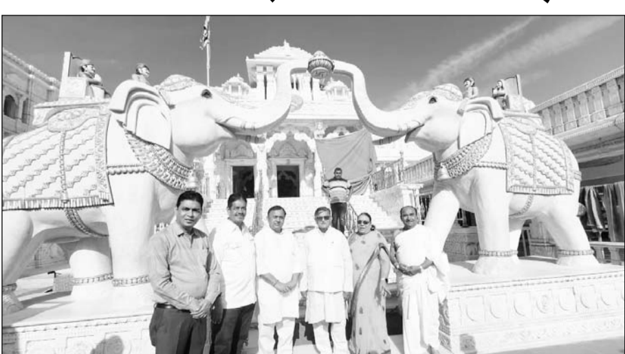
असम के राज्यपाल गुलाबचंद कटारियापार्ष्वनाथ भगवान व भैरवदेव के दर्शन किए।