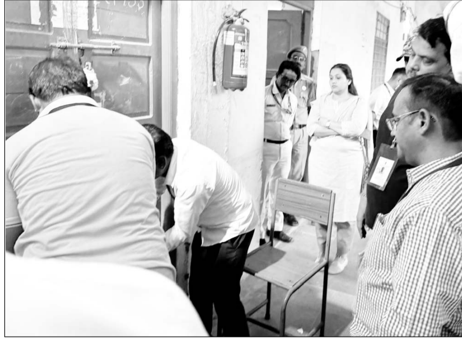
ई.वी.एम. व वी.वी.पेट मशीनें पाली के बांगड़ महाविद्यालय के स्ट्रांग रूम में सील की।

पाली, (नि.सं.)। पाली लोकसभा आम चुनाव 2024 के मतदान सम्पन्न होने के बाद पाली संसदीय क्षेत्र की सभी विधानसभाओं क्षेत्र की ईवीएम व