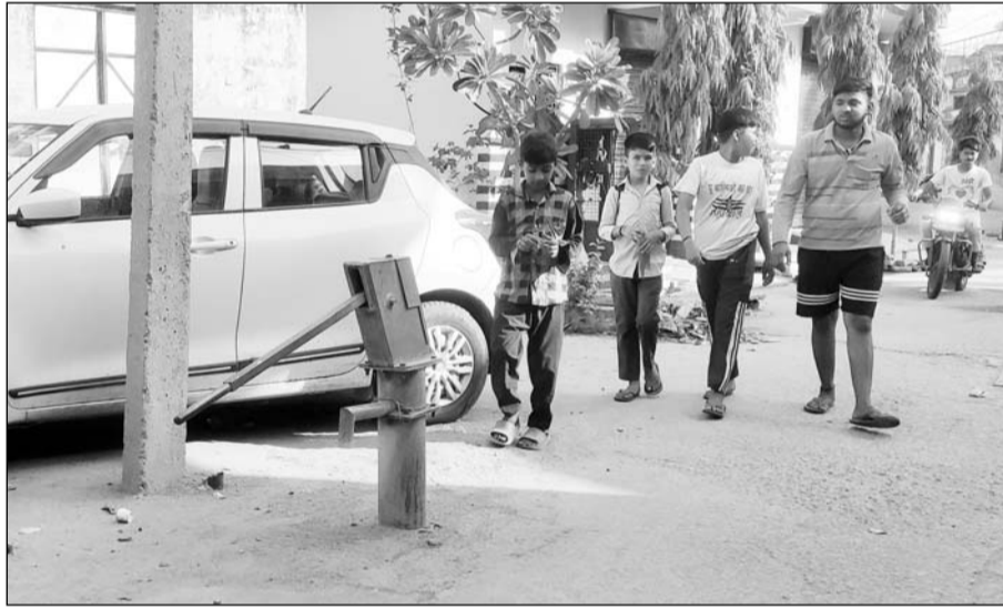
किशनगढ़बास में हनुमान मंदिर के पीछे चौक में लगा हैंडपंप शो-पीस बनकर रह गया है।

किशनगढ़ बास, (निर्स)। 24 घंटे पानी देकर लोगों की जरूरत को पूरा करने वाले हैंडपंप देख-रेख के अभाव में आज शो पीस बनकर खड़े हैं। लोग हैंडपंप की अहमियत को भूल गए हैं। चलते हुए राहगीर भी हैंडपंप का पानी पीकर अपने कंटों की प्यास बुझा लिया करते थे।