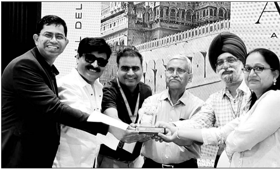
इंडियन साइक्रेटिक सोसायटी की कॉन्फ्रेंस के समापन पर वरिष्ठ चिकित्सकों को सम्मानित किया।