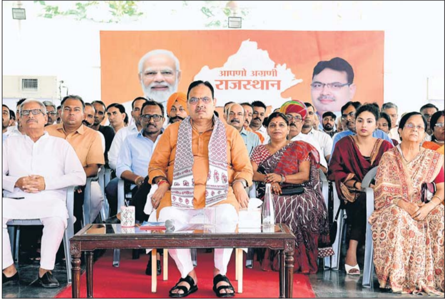
मुख्यमंत्री भजनलाल शर्मा ने आमजन के साथ अपने निवास पर प्रधानमंत्री नरेंद्र मोदी की मन की बात का उद्बोधन सुना।

मुख्यमंत्री भजनलाल शर्मा ने आमजन के साथ प्रधानमंत्री का सम्बोधन सुना