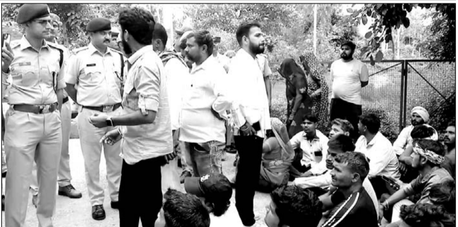
गांव जया में ट्रैक्टर से कुचलने से एक बालक की मौत के बाद परिजनों एवं ग्रामीणों ने प्रदर्शन किया।