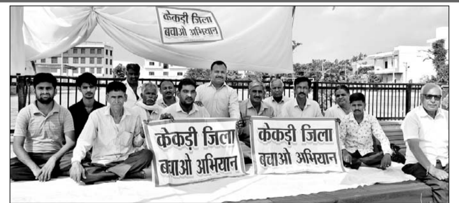
केकड़ी जिले को यथावत रखने की मांग को लेकर धरना जारी रहा।

जानकारी के अनुसार केकड़ी जिले को यथावत रखने की मांग को लेकर त्योंहारी सीजन के बावजूद व्यापारियों ने अपनी दुकानें बंद रखीं। सवार बाजार सहित अन्य इलाकों में बंद कर दिया गया है। उल्लेखनीय है कि पिछले दिनों भाजपा प्रदेशाध्यक्ष मदन राठौड़ ने केकड़ी, सांचौर सहित छोट्टे जिलों को हटाने के बयान दिया था। पिछले दिनों ही केकड़ी एसपी का स्थानांतरण कर चार्ज अजमेर एसपी को देने के बाद से ही केकड़ी में लोगों में आक्रोश व्याप्त है। जिले को हटाने की अटकलों के चलते पिछले चार दिनों से बार एसोसिएशन सहित विभिन्न संगठन आंदोलनरत हैं। शनिवार को बार एसोसिएशन के