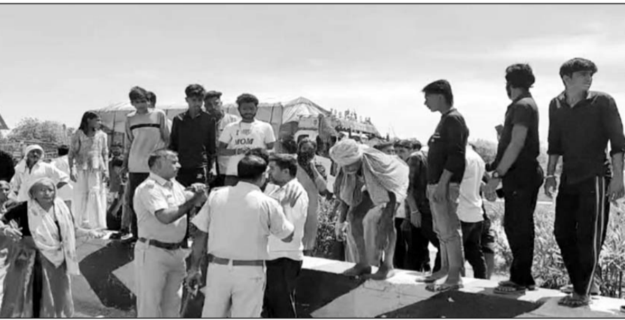
बूंदी जिले के तालेड़ा उपखंड क्षेत्र के खुराड़ गांव में खेतों में आगजनी की घटना के बाद आक्रोशित ग्रामीणों ने हाईवे जाम कर दिया जिसे पुलिस ने समझाईश कर खुलवाया।