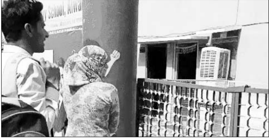
अलवर में एसआई भर्ती परीक्षा कड़ी सुरक्षा के बीच सम्पन्न हुई।

अलवर। अलवर में आयोजित एसआई भर्ती परीक्षा के पहले दिन प्रशासन की सख्ती और अभ्यर्थियों की परेशानी दोनों ही देखने को मिली। पहली परी में परीक्षा देने पहुंचे अभ्यर्थियों को सख्त सुरक्षा जांच से गुजरना पड़ा, जहां कई केंद्रों पर परीक्षास्थलों से जूते, चुन्नी और ज्वेलरी