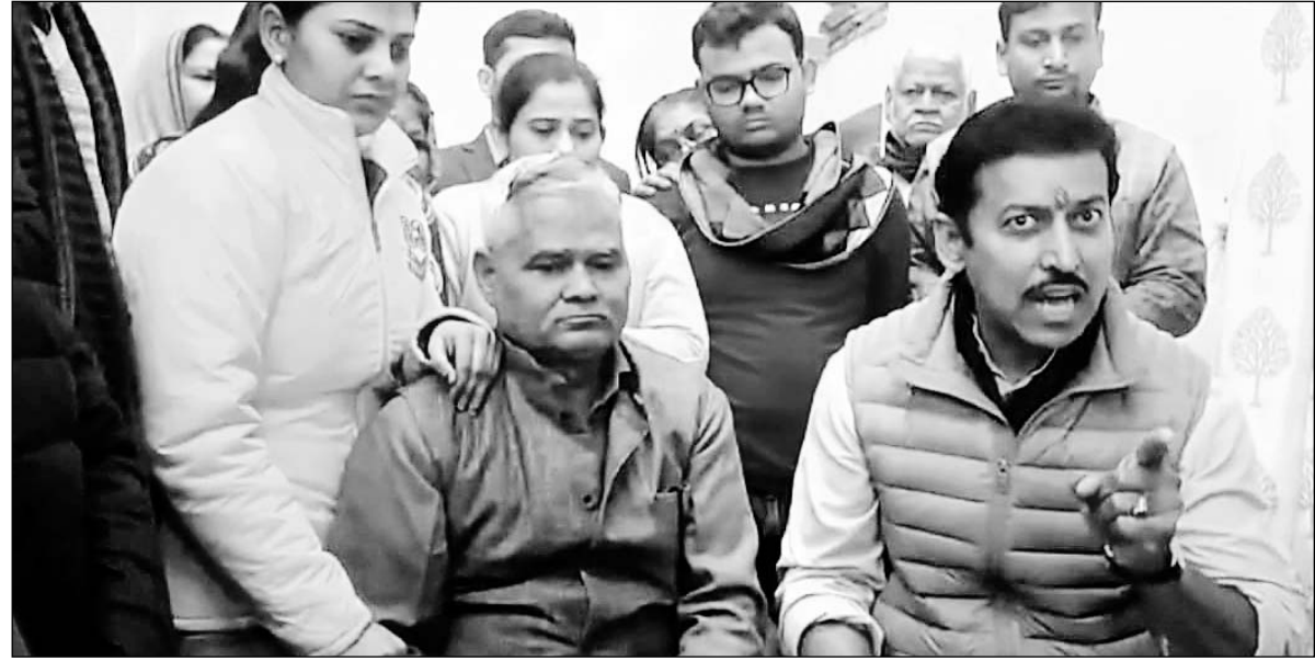
कोटपूतली में सांसद राज्यवर्धन सिंह राठौड़ ने पत्रकारों को सम्बोधित किया।

कोटपूतली, (नि.सं.) कस्बे में नगर परिषद द्वारा कोटपूतली के मास्टर प्लान 2011-31 को लागू करने और सड़क चौड़ी करने को लेकर पुरानी नगरपालिका से आजाद चौक तक कि जा रही संरचनाये तोड़ने की कार्यवाही जारी रही। इस दौरान नगरपरिषद दस्ता दिन भर पोक्सेड मशीन व जेसीबी की सहायता से ध्वस्त संरचनाओं का मलबा उठाने में जुटा रहा वहीं बिजली विभाग भी नई विद्युत लाइन डालने के लिए पोल गाडता नजर आया। दूसरी और जयपुर ग्रामीण सांसद कर्नल राज्यवर्धन सिंह राठौड़ ने भी