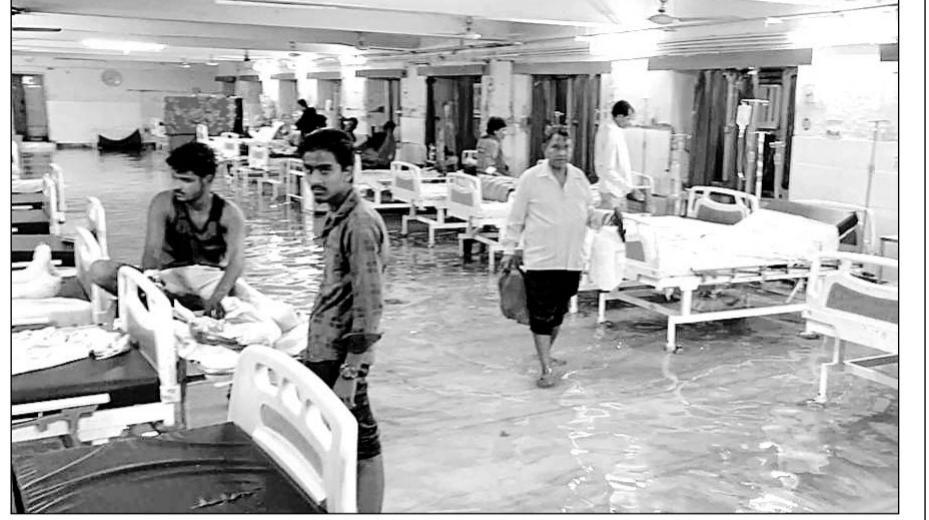
अजमेर के जवाहर लाल नेहरू अस्पताल के वार्डों में भरा पानी।

अजमेर, (कांसं)। बिपरजाय तूफान व तेज हवाओं के साथ दो दिन से अजमेर शहर में शहर लगातार बारिश के चलते शहर के हालात बिगड़ने लगे हैं तो वहीं अजमेर संभाग का सबसे बड़ा जवाहर लाल नेहरू अस्पताल दरिया बन गया, यहां के कुछ वार्डों को छोड़कर सभी वार्डों में पानी भरने से यहां आने वाले मरीज व उनके परिजन को भारी परेशानी का सामना करना पड़ा। अस्पताल के वार्ड पानी से लबालब जेएलएन अस्पताल है जहां महिला हड्डी वार्ड में दो फुट तक पानी जमा हो गया और अनान फानन में सभी मरीजों को अन्यत्र शिफ्ट करना पड़ा। वहीं बरसात से शहर के वैशाली नगर, चौपाटी के सामने, कचहरी रोड, जवाहर लाल नेहरू अस्पताल, कमला नेहरू अस्पताल, इंडिया मोर्टस सर्किल, रेलेवे स्टेशन, शहर का वार्ड नंबर 54 शक्ति नगर, गुलाबवाडी, भजनगंज, जादूगर, अलवरगोट समेत शहर के कई इलाकों में पानी भर गया, कई लोगों के घरों में पानी भरने से लोगों