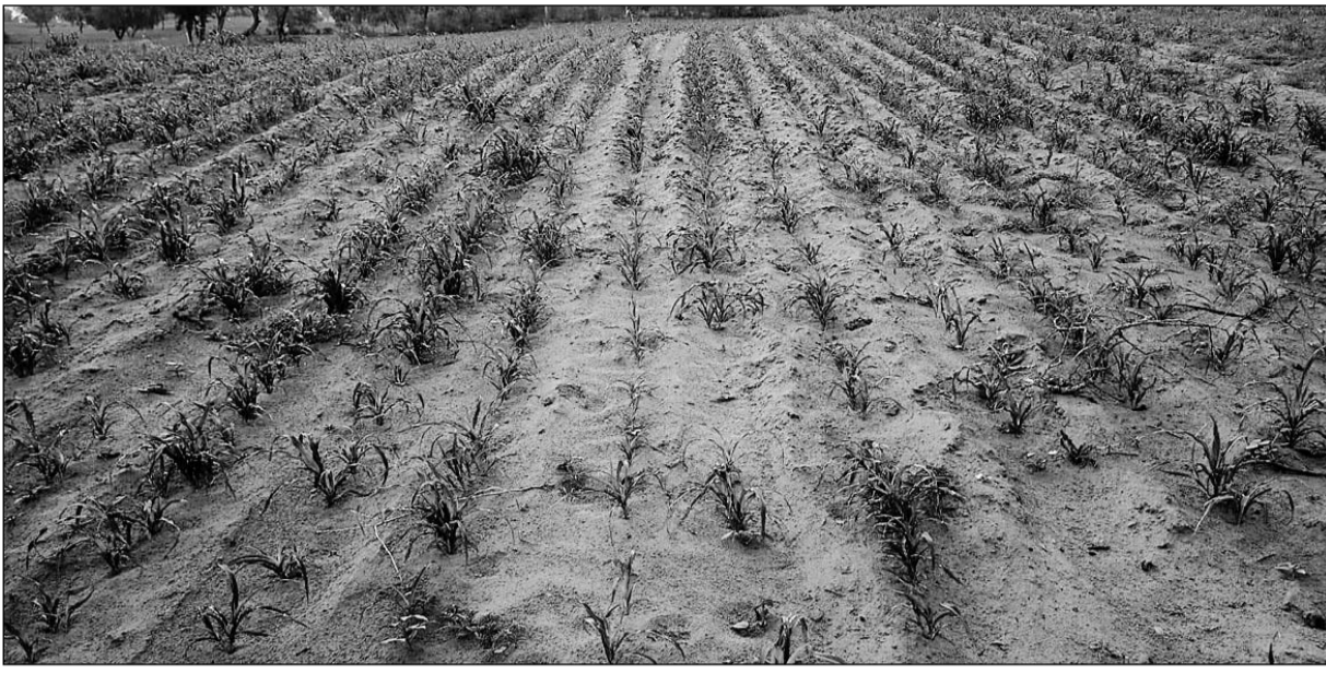
भाकरां गांव की रोही में खड़ी फसल।