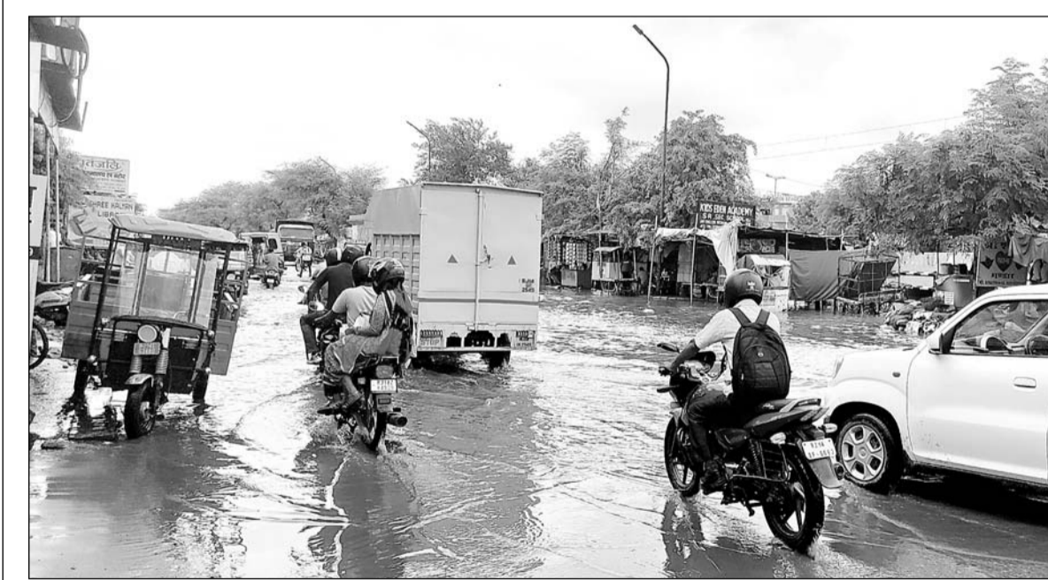
'बिपरजॉब' चक्रवाती तूफान के कारण राजधानी जयपुर में बीते दो दिनों में हुई बारिश ने प्रशासन की व्यवस्थाओं की पोल खोलकर रख दी है। शहर के बाहरी इलाकों में सड़क किनारे बने नालों की सफाई नहीं होने के कारण सड़कें दरिया बनी दिखीं। बैनाड रोड पर प्रथम नगर में मुख्य सड़क पर सोमवार को बारिश के दौरान पानी भर गया, इस कारण यहां से गुजरने वाले वाहनचालकों को भारी परेशानी हुई।