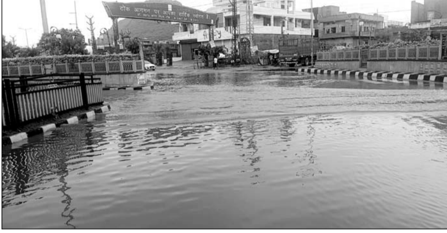
टोंक में हुई बरसात के कारण कई जगह पर पानी भर गया।

टोंक, (निंसां)। जिले में बीती रात से अब तक लगातार हो रही बारिश से जन जीवन-अस्त व्यस्त हो गया। जिले का सबसे बड़ा बीसलपुर बांध में देर शाम तक 25 सेमी पानी की आवक हुई है। वहीं शहर समेत प्रामाण्य क्षेत्रों में बिजली गुल रही। बिपरजाय तूफान का 16 से