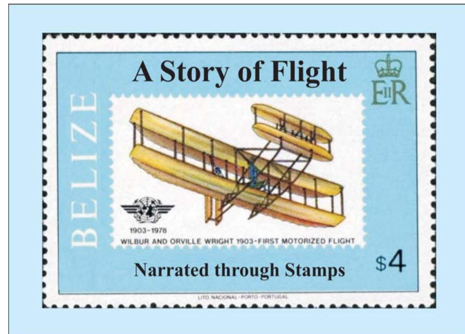
Concept and Design by Nihal Mathur Computer Graphics by Bharat Kumawat