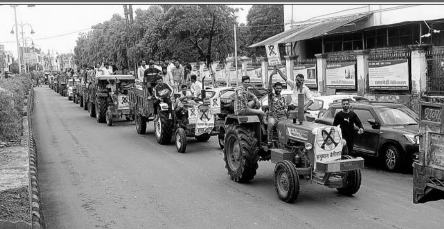
भीलवाड़ा में बजरी राँयल्टी कर्मचारियों ने रैली निकाली।

कलेक्टर को सीएम के नाम दिए गए ज्ञापन में बताया कि राज्य में 5 वर्ष तक बजरी खनन पर रोक के बाद सरकार ने आम जनता को राहत पहुंचाने और राजस्व में वृद्धि के लिए जून 2021 में बजरी खनन लीजों को अनुमति दी जिससे हजारों लोगों को रोजगार मिला। ज्ञापन में आरोप लगाया गया है कि नागौर सांसद हनुमान बेनीवाल