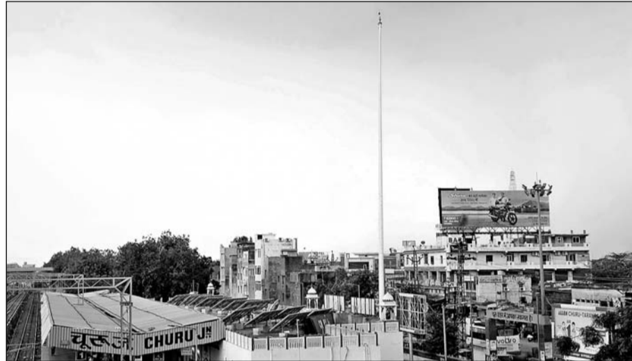
चूरु में रेलवे विभाग ने लापरवाही की सभी हदें पार करते हुए तिरंगे को ही गायब कर दिया है।

कार्यवाही करने की मांग की है। लोगों ने कहा कि यहाँ तिरंगे को हटाकर चूरु रेलवे विभाग के अधिकारी क्या साबित करना चाहते हैं। यहाँ आमजन की भावनाओं के साथ खिलवाड़ भी हो रहा है। क्यों नहीं संबंधित अधिकारियों पर कार्यवाही होनी चाहिए। इस प्रकार से मनमानी नहीं चलेगी।