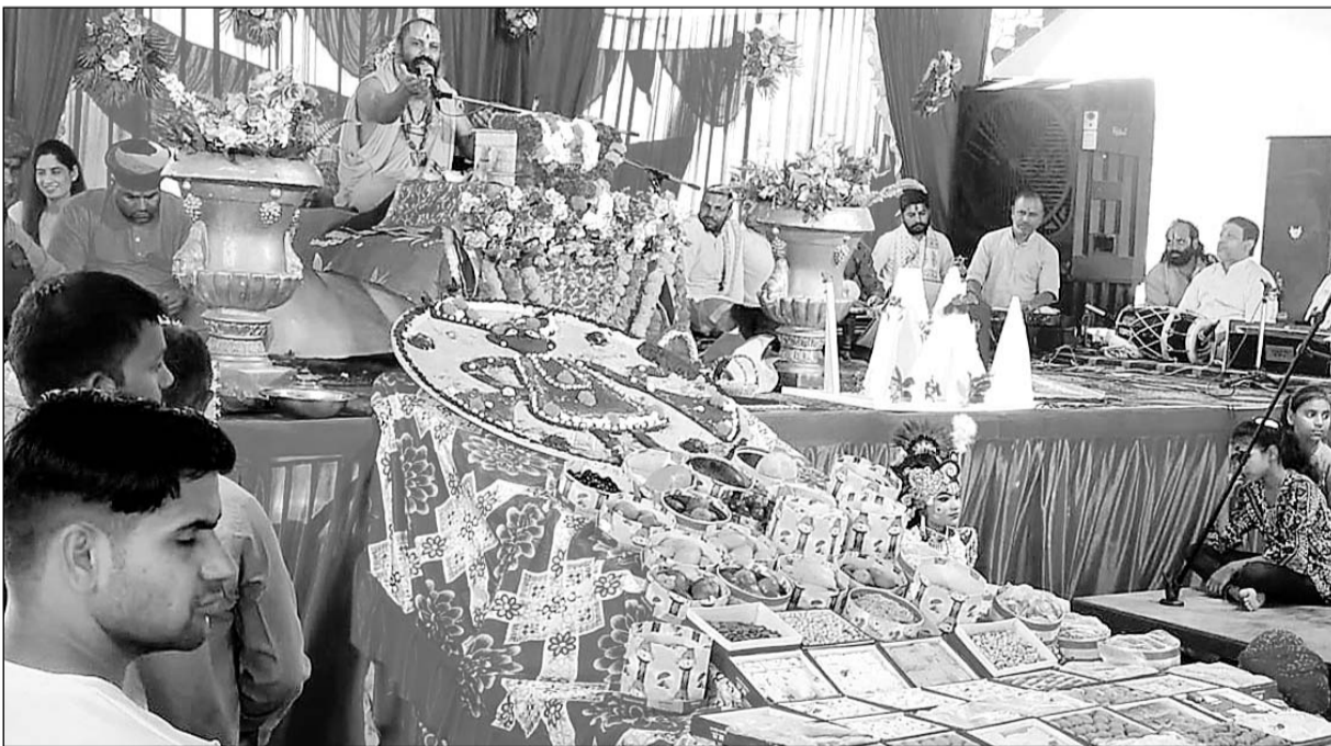
शाहपुरा के समीपवर्ती रुण्डल में संतो के बाग में जमदग्नि आश्रम में संतो ने प्रवचन दिये।