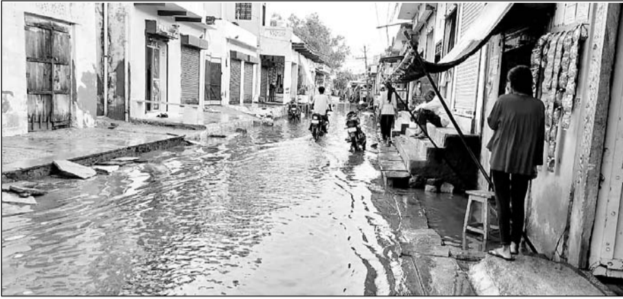
पावटा में दो दिन से हो रही बारिश से सड़कों पर पानी भर गया।

■ भारी बारिश की संभावना के निर्देशों के बावजूद प्रशासन द्वारा जल भराव की समस्या का कोई समाधान नहीं किया