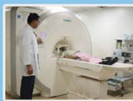
1.5 टेस्ला एम.आर.आई.