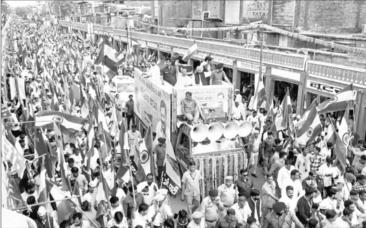
आम आदमी पार्टी ने सोमवार को जयपुर में सांगानेरी गेट से अजमेरी गेट तक तिरंगा यात्रा निकाली जिसमें भारी भीड़ उमड़ पड़ी।

उन्होंने कहा कि अब कांग्रेस और भाजपा वाले ये नहीं कह सकते हैं कि राजस्थान की जनता ने हमें मौका नहीं दिया। 48 साल बहुत होते हैं और 18 साल भी बहुत होते हैं। इसके बावजूद हम देख सकते हैं कि राजस्थान का क्या हाल है। राजस्थान में बहुत गरीब हैं। किसान-मजदूर आत्महत्या कर रहे हैं। किसानों को अपनी फसल के दाम नहीं मिल रहे हैं। बेरोजगारी और महंगाई है और पेपर लीक हो रहे हैं। पूरे राजस्थान का बहुत बुरा हाल है। शहीदों की वीरगंगाएं जब अपना हक