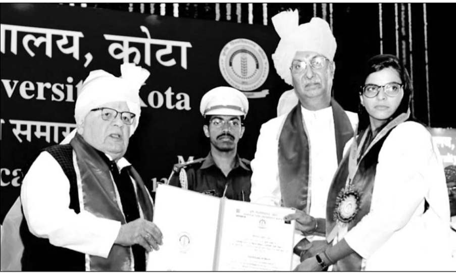
कोटा में दीक्षांत समारोह में राज्यपाल के द्वारा उपाधियां प्रदान की गईं।

उन्होंने कहा कि दीक्षांत शिक्षा का नए रूप में आरम्भ है। विद्यार्थी विश्वविद्यालय में अर्जित ज्ञान को जीवन व्यवहार में उपयोग में लेकर जमीन व पानी की कमी, जलवायु परिवर्तन एवं कृषि लागत में बढ़ोतरी जैसी कृषि चुनौतियों को दूर करने में काम लें। उन्होंने कहा कि कृषि विश्वविद्यालय विद्यार्थियों को गुणवत्ता युक्त शिक्षा प्रदान कर कृषि प्रबंधन में दक्ष एवं योग्य युवा तैयार करें। जिससे विद्यार्थी भविष्य में कृषि से जुड़े उद्यम तैयार कर लोगों को रोजगार देने का