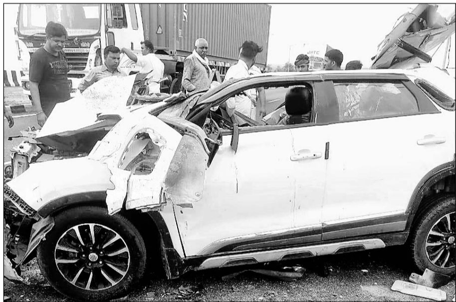
बांदनवाड़ा में हुए हादसे के बाद मौके पर लोगों की भीड़ जमा हो गई।