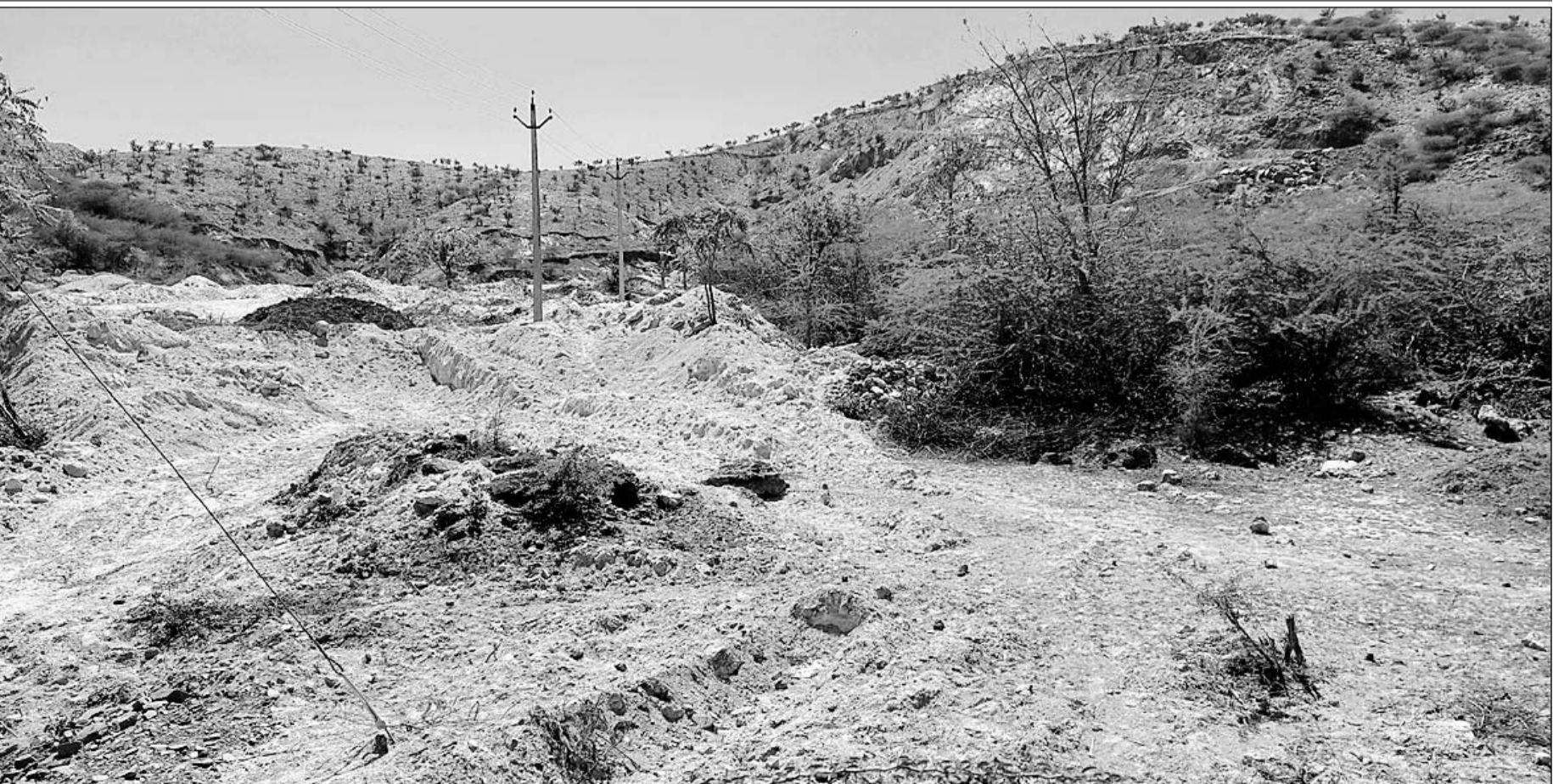
अभयपुरा गांव के पास सोपस्टोन की खदान से सटी वन भूमि के पहाड़ में अवैध खनन किया जा रहा है।

उधर खदान संचालक ने बताया कि खदान की निर्धारित सीमा में ही नियमानुसार खनन कार्य किया जा रहा है। ग्रामीणों को कोई परेशानी है तो समाधान किया जाएगा।