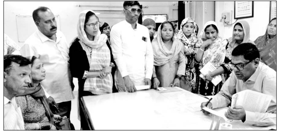
कोटा अतिरिक्त जिला कलेक्टर को ज्ञापन सौंपा गया।