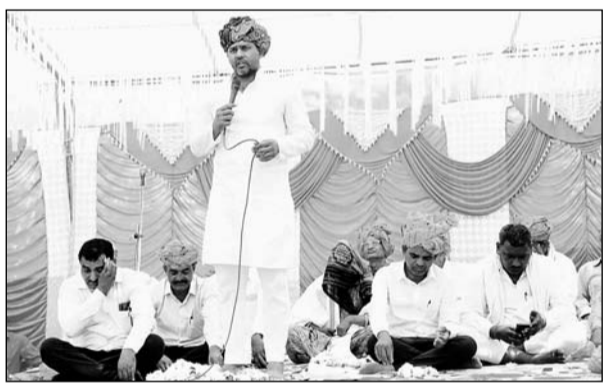
राज्य मंत्री अशोक चांदना ने विकास कार्यों के कैलेंडर विमोचन कार्यक्रम को संबोधित किया।

राज्यमंत्री ने कहा कि हिण्डोली-नैनवां क्षेत्र के बहुमुखी विकास में कड़ी कमी नहीं रखी गई है। पेयजल, सिंचाई, बिजली, चिकित्सा, शिक्षा, सडक, कृषि