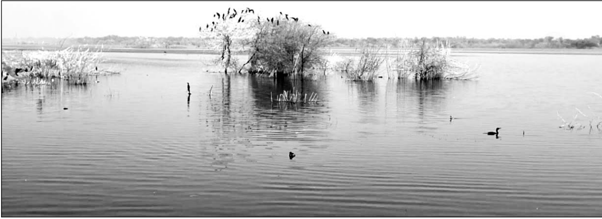
कानोता बांध को जिस उद्देश्य के लिए बनाया गया था आज वह उद्देश्य पूरी तरह मर चुका है।

इस बांध में पानी की आवक से आसपास का जलस्तर ऊंचा जरूर हुआ है, लेकिन सिंचाई के लिए बनी नहरों में पानी न छोड़े जाने से नहरों के आसपास गांवों में सिंचाई लुप्त होने के कगार पर है। बांध निर्माण के शुक्रवाती दिनों में तो इसका उपयोग सिंचाई एवं पीने के पानी के रूप में किया गया लेकिन वर्तमान में यह बांध सिंचाई एवं पीने के पानी के लिए अनुपयोगी साबित हो रहा है। इतना ही नहीं अब तो इस बांध में भरने वाला पानी पशु-पक्षियों एवं मछलियों के लिए मौत का कारण भी बन रहा है। इसका कारण इस बांध में जयपुर शहर के साथ ही जलमहल से आने वाला गंदा एवं कैमिकल युक्त पानी है। इस