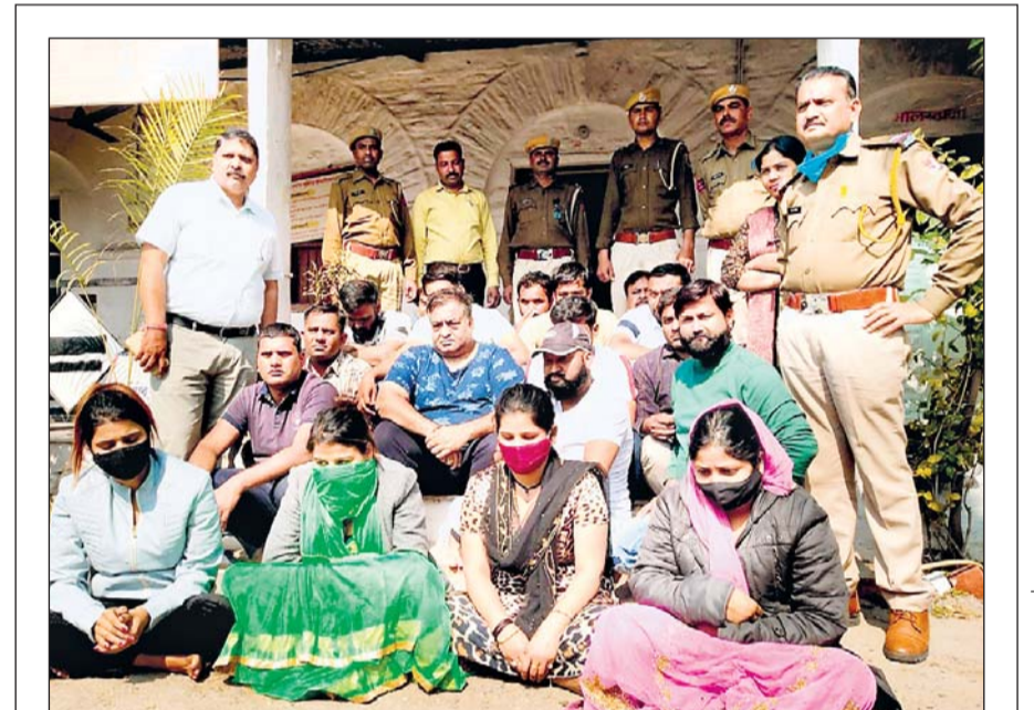
राजसमंद पुलिस ने एक होटल में रेड डालकर यहां रेव पार्टी कर रहे 18 युवक-युवतियों को गिरफ्तार किया है।

केन्द्र सरकार ने राजस्थान राज्य विद्युत उत्पादन निगम लिमिटेड