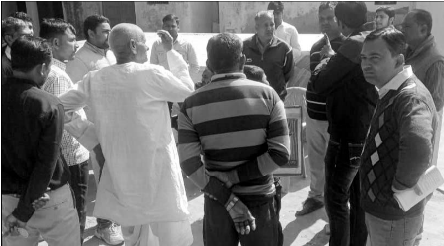
सीनियर स्कूल बदरिका में हुई फायरिंग की घटना के बाद ग्रामीणों ने आरोपी को दबोचा।

धौलपुर, (निर्स)। धौलपुर जिले के कौलारी थाना इलाके के राजकीय उच्च माध्यमिक विद्यालय बदरिका में मंगलवार को छात्रों में झगड़ा हो गया। जिस पर छात्रों के परिजन मौके पर पहुंच गए जिन्होंने फायरिंग कर दी। जिससे स्कूल में दहशत फैल गई। वहीं झगड़े के दौरान एक छात्र गंभीर रूप से घायल हुआ है। हालांकि कुछ लोगों का कहना है कि आरोपी ने मौके पर फायरिंग नहीं की, केवल अवैध कट्टा हवा में लहराया था। वहीं ग्रामीणों ने आरोपी को मौके पर ही अवैध कट्टा और कारतूस सहित दबोच