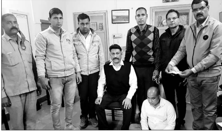
झालावाड़ एसीबी की टीम ने मगिसपुर ग्राम पंचायत के विकास अधिकारी को गिरफ्तार किया।