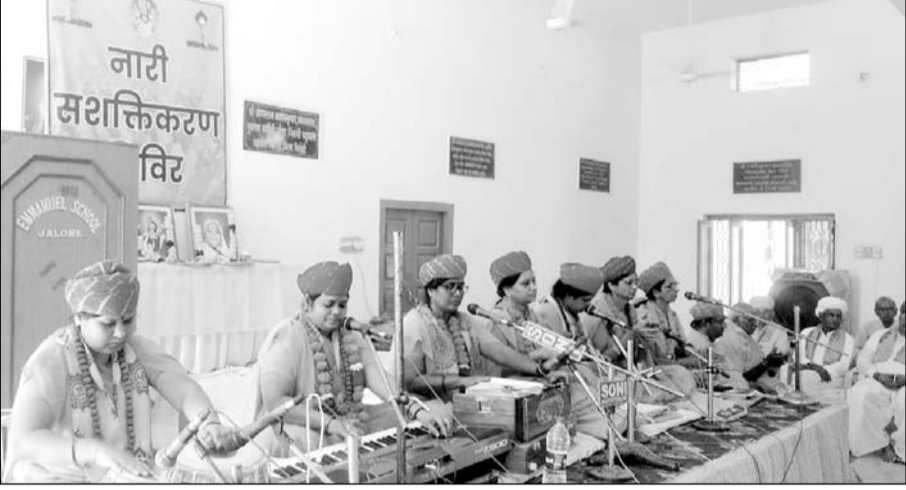
जालोर शहर के आत्मानंद गुरु मंदिर में गायत्री परिवार का धार्मिक कार्यक्रम हुआ।

जालोर, (कास)। शहर के रेलवे फाटक के पास आत्मानंद गुरु मंदिर परिसर में अखिल विश्व शाखा की श्याम राठीर शाखा जालोर की ओर से शिविर के दूसरे दिन रविवार को विभिन्न धार्मिक कार्यक्रम आयोजित हुआ।