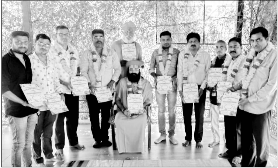
जालोर में श्रीयादे सेवा संस्थान की ओर से अक्षय तृतीया पर आयोजित सामूहिक विवाह को लेकर आमंत्रण पत्रिका का विमोचन किया गया।

जालोर, (कांस)। श्रीयादे सेवा संस्थान जालोर की ओर से आगामी 10 मई अक्षय तृतीया को आयोजित होने वाले सामूहिक विवाह समारोह की तैयारी जोरों पर चल रही है।