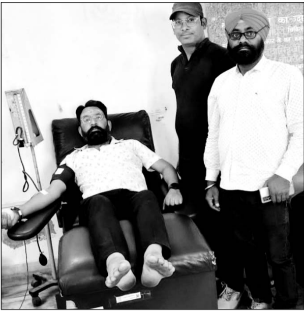
जालोर के राजकीय चिकित्सालय में रक्त की कमी के चलते रक्तदाता आगे आ रहे हैं।

जालोर, (कास)। जालोर शहर के राजकीय सामान्य चिकित्सालय में स्थित ब्लड बैंक में रक्त की कमी के चलते मरीजों को परेशानी का सबब बनता जा रहा है। ब्लड बैंक के अधिकारी बताते हैं कि गर्वमेंट एवं प्राइवेट हॉस्पिटल के ब्लड बैंक में हरदिन लगभग 20 से 25 लोग ब्लड की डिमांड लेकर पहुंच रहे हैं जबकि बैंक में 5 से 7 यूनिट खून ही रिप्लेस में आ पा रहा है नतीजतन जो स्टॉक था वह भी खत्म हो गया, जिसके चलते मरीजों को काफी दिक्कत हो रही है। जालोर सरकारी अस्पताल परिसर में स्थित ब्लड बैंक खुद ही ब्लड की कमी से जूझ रहा है। यह बात इस ब्लड बैंक की व्यवस्था संभालने वाले जिम्मेदार लोग ही बता रहे हैं। उनकी समस्या ये है कि उनके पास बड़ी संख्या में लोग ब्लड की डिमांड लेकर पहुंचते हैं, लेकिन उनके पास ब्लड का उतना स्टॉक ही नहीं पा रहा कि वे हर जरूरतमंद को ब्लड उपलब्ध करा सकें। रक्तदान के प्रति जागरूक न होने से रिजर्व स्टॉक की स्थिति भी इतनी चिंताजनक है कि ब्लड बैंक में अब महज 30 से 50 यूनिट ब्लड बचा है। जबकि खपत लगभग प्रतिदिन 20 से 25 यूनिट की है। इसमें भी पॉजिटिव युग्म का तो एक बूंद भी स्टॉक नहीं है। सबसे बड़ी बात