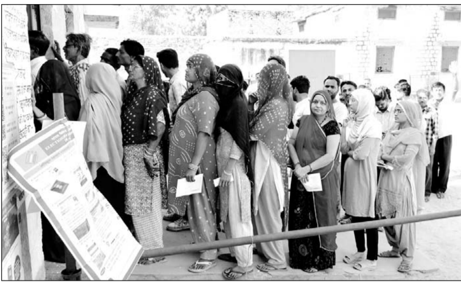
जालोर में महिलाओं ने मतदान करने को लेकर उत्साह दिखाया।

जालोर जिले के सांचौर व रानीवाड़ा विधानसभा क्षेत्र में महिलाएँ पुरुषों के बजाय पीछे रही। सांचौर विधानसभा क्षेत्र में भी महिलाएँ पुरुषों से पीछे रही। जबकि सिरोही जिले के तीनों विधानसभा क्षेत्रों में महिलाओं ने बाजी मारी।