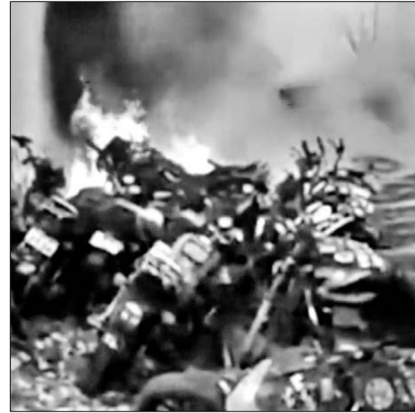
रावतभाटा थाना परिसर में आग लगने दोपहिया वाहन जल गए।