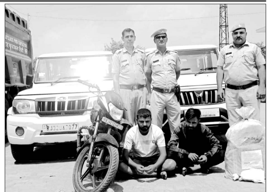
नीमकाथाना के देवसिटी में पुलिस एवं डीएसटी टीम ने दो जनों को गिरफ्तार किया।