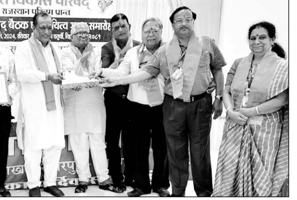
भारत विकास परिषद् राजस्थान पश्चिम प्रांत की प्रथम बैठक एवं दायित्व ग्रहण समारोह सुमेरपुर में हुआ।