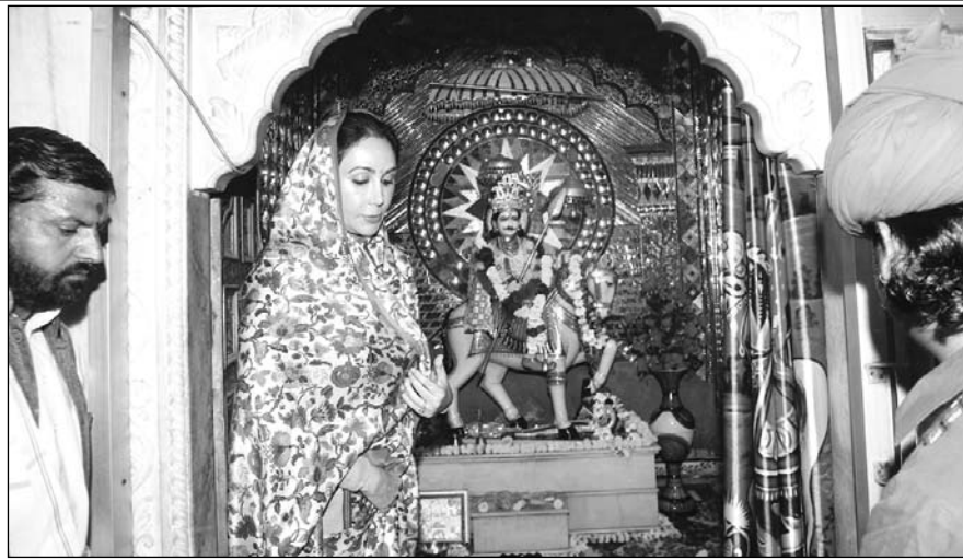
उपमुख्यमंत्री दिया कुमारी ने सर्वाहोत्र में भगवान श्री देवनारायण जी के दर्शन किये।

■ उपमुख्यमंत्री ने प्रेमसागर सरोवर के सौंदर्यीकरण, लाइट डेकोरेशन के कार्य व देवनारायण आवासीय बालिका विद्यालय खोलने की घोषणा की