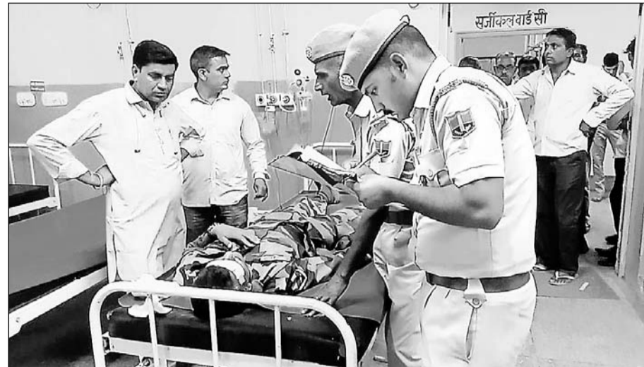
घायलों को अस्पताल में भर्ती कराया।