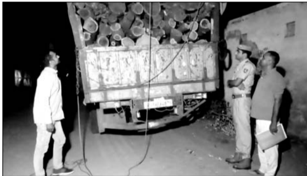
सुलताना पुलिस चौकी ने हरी लकड़ियों से भरा एक ट्रक पकड़ा।

■ सुलताना पुलिस ने यह कार्रवाई चिड़ावा-सुलताना रोड पर मुखबिर की सूचना पर की