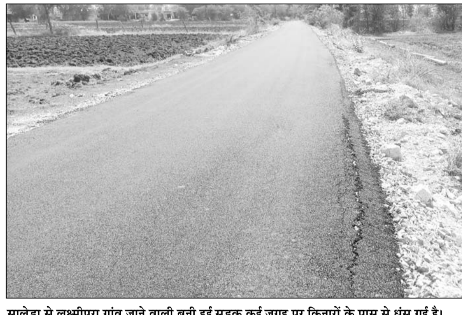
सालेड़ा से लक्ष्मीपुरा गांव जाने वाली बनी हुई सड़क कई जगह पर किनारों के पास से धंस गई है।

विरुद्ध कोई कार्रवाई नहीं की। आज भी हालात जस के तब बने हैं। ग्राम पंचायत पीथलपुरा में बनी सड़क भी समय अवधि से पहले टूट गई और कई जगह पर पेच वर्क शुरू हो चुका है। विभाग द्वारा भींडर ब्लॉक में बनाई गई अधिकतर डांपर सड़कों की हालत दयनीय हो चले हैं। और जिम्मेदार जनप्रतिनिधियों का भी इस ओर कोई ध्यान नहीं है।