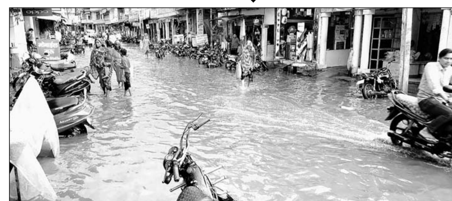
मालपुरा में हुई भारी बारिश से महावीर मार्ग के मुख्य बाजार में भरा पानी।

अचानक हुई बरसात से जनजीवन अस्त-व्यस्त हो गया तो लाखों का सामान पानी में तैर गया। वहीं नीचे इलाकों में भारी पानी भर जाने से लोग घरों में कैद हो गये। नगरपालिका कार्यलय में फोन की घंटियां बजती रही लेकिन रविवार के अवकाश के चलते आमजन को किसी प्रकार की कोई राहत नहीं मिल पाई। पालिका बोर्ड