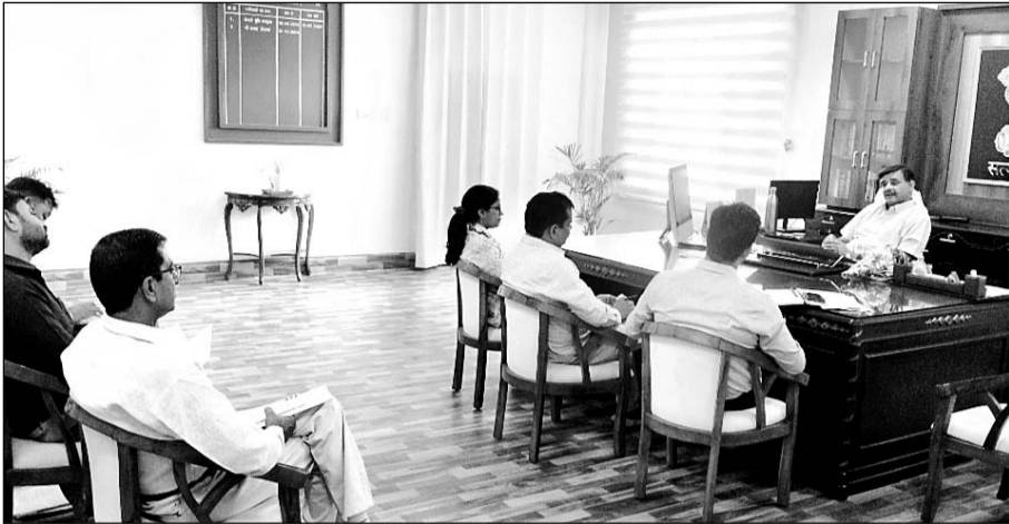
नगरपरिषद् एवं नगरपालिका के अधिकारियों की बैठक कलेक्टर सभागार नीमकाथाना में आयोजित हुई।

पाटन, (निसं.) जिला कलेक्टर शरद मेहरा की अध्यक्षता में नगरपरिषद् एवं नगरपालिका के अधिकारियों की बैठक कलेक्टर सभागार नीमकाथाना में आयोजित हुई। बैठक में जिला कलेक्टर शरद मेहरा ने सभी अधिकारियों से प्रगति रिपोर्ट ली तथा उदयपुरवाटी में जेईएन का पद रिक्त होने पर खेतडी जेईएन को उदयपुरवाटी का अतिरिक्त प्रभार सौंपा। मेहरा ने कहा कि नगरपरिषद् एवं नगरपालिकाओं को सुचारु रूप से चलाने के लिए स्टाफ की कमी को दूर करना ही हमारी पहली प्राथमिकता रहेगी।