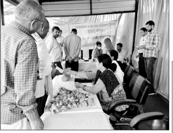
झुंझुनू में तीन दिवसीय निःशुल्क शिविर का शुभारंभ किया गया।

अतः यह बेहद जरूरी है कि वे तनाव रहित जीवनशैली को अपनाने के साथ चिकित्सकों द्वारा दी गई सलाह को मनायें। उन्होंने इस अवसर पर वहां उपस्थित चालक, परिचालक