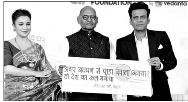
14 लाख आंगनबाड़ियों में सुधार करने के लक्ष्य के तहत नंद घर ने अभिनेता मनोज बाजपेयी के साथ विशेष कैम्पेन की शुरुआत की।

जयपुर। 14 लाख आंगनबाड़ियों में सुधार करने के लक्ष्य के तहत नंद घर ने अभिनेता मनोज बाजपेयी के साथ पूरे देश में एक विशेष कैम्पेन की शुरुआत की है, जिसका शीर्षक है “अगर बचपन से पूछा खाना खाया, तो देश का कल बनाया।” नंद घर द्वारा चलाए जा रहे इस कैम्पेन का उद्देश्य भावी पीढ़ी को पोषित करना है, जिसमें समग्र स्वास्थ्य देखभाल, गुणवत्तापूर्ण पोषण और बच्चों को सर्वोत्तम प्री-स्कूल शिक्षा प्रदान करना शामिल है। इस मुहिम में शामिल होने पर मनोज बाजपेयी का स्वागत करते हुए अनिल अग्रवाल, चैयरमैन, वेदंता, ने कहा कि प्रोजेक्ट नंद घर पूरे देश में बच्चों और महिलाओं को स्वस्थ और सुपोषित करने में मदद करने पर केंद्रित है। मनोज बाजपेयीजी का इस महत्वपूर्ण मुहिम से जुड़ना हमारे लिए