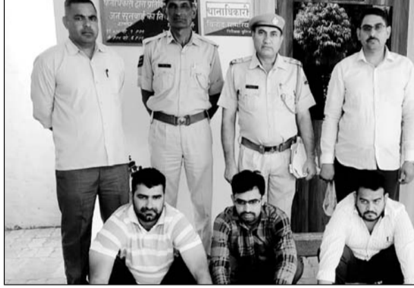
फोटो 0098 चिड़ावा थाना पुलिस ने क्रिकेट मैच पर सट्टा खाईवाली करते तीन आरोपियों को गिरफ्तार किया।