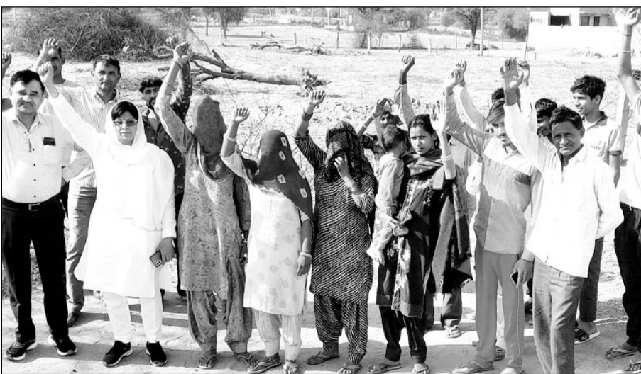
अवैध अतिक्रमण के चलते रास्ता खुलवाने की मांग को लेकर प्रदर्शन करते ग्रामीणजन ।