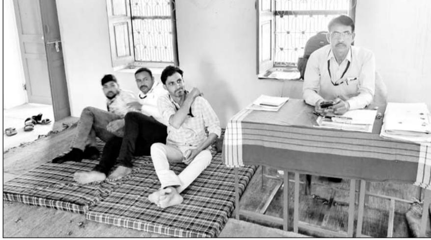
मतदान केंद्र पर मतदान अधिकारी एवं कर्मचारी सुबह से बैठे ही रहे, उन्होंने केवल अपना ही वोट डाला।

ग्रामीणों ने यमुना के पानी की मांग को लेकर यह कदम उठाया