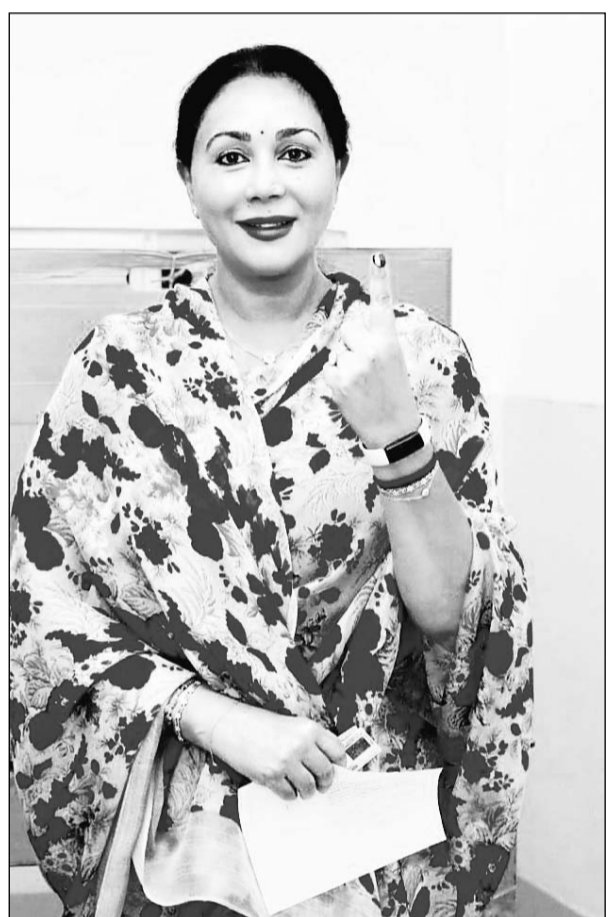
उपमुख्यमंत्री दिया कुमारी ने परकोटे में गणगौरी बाजार में जनाना ड्योडी स्थित एक स्कूल में मतदान किया।