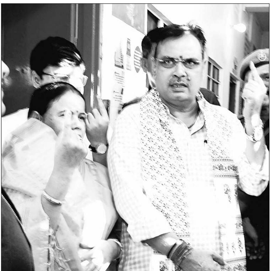
मुख्यमंत्री भजनलाल शर्मा शुक्रवार को प्रातः लोकसभा आम चुनाव 2024 के प्रथम चरण के तहत हो रहे मतदान के लिए सिद्धार्थ नगर के नवोदय महिला शिक्षक प्रशिक्षण महाविद्यालय मतदान केंद्र पहुंचे। उन्होंने मतदान केंद्र पर सपरिवार मतदान किया।

ग्रामीण, जयपुर शहर, अलवर, भरतपुर, करौली-धौलपुर, दौसा और नागौर में हुए इन लोकसभा चुनावों में ई.वी.एम. के जरिए 57.26 फीसदी वोटिंग हुई है, जबकि शेष 0.61 प्रतिशत मतदान पोस्टल वॉलेट के जरिए हुआ। अगर इन्हीं 12 लोकसभा क्षेत्रों में