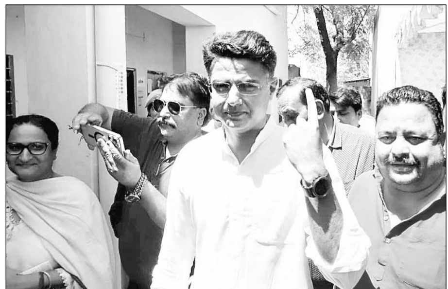
पूर्व उपमुख्यमंत्री सचिन पायलट ने शुक्रवार को जयपुर में सी-स्क्रीम स्थित सरदार पटेल मार्ग पर रेजीडेंसी स्कूल में अपना वोट डाला।

सभी मतदान केंद्रों पर मतदाताओं के सुविधा को ध्यान में रखते हुए रैम्प, पीने के पानी, छाया, व्हीलचेयर और बुजुर्ग मतदाताओं के लिए वाहन सहित अन्य व्यवस्थाएं की गईं। साथ ही, मतदाताओं की सहायता के लिए हर मतदान केंद्र पर वॉलंटियर्स तैनात किए गए।