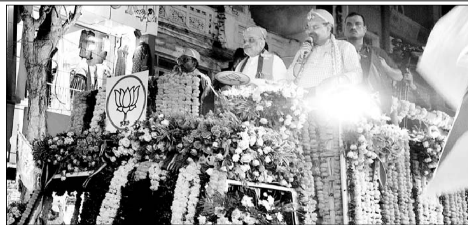
उदयपुर में रोड शो के दौरान गृहमंत्री अमित शाह के साथ मुख्यमंत्री भजन लाल शर्मा भी मौजूद रहे।