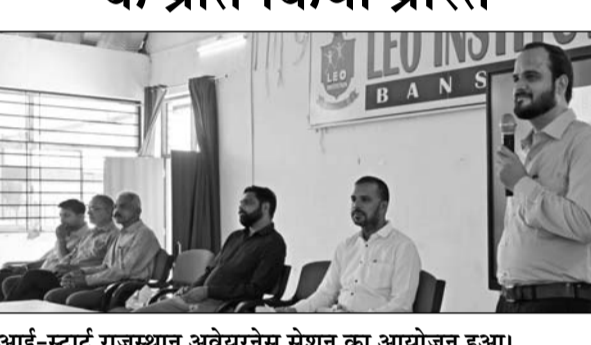
आई-स्टार्ट राजस्थान अवैधरनेस सेशन का आयोजन हुआ।

अभ्यास के माध्यम से आपदा की स्थिति में समन्वित कार्रवाई, त्वरित निर्णय क्षमता एवं संसाधनों के प्रभावी उपयोग का परीक्षण किया गया। मॉक ड्रिल में सिविल डिफेंस, एसडीआरएफ, पुलिस, फायर फाइटर्स, स्काउट, चिकित्सा एवं स्वास्थ्य विभाग सहित विभिन्न विभागों के कार्मिकों ने सक्रिय भागीदारी निभाई। सभी टीमों ने निर्धारित प्रोटोकॉल के अनुसार कार्य करते हुए राहत एवं बचाव कार्यों का सफलतापूर्वक संचालन किया।