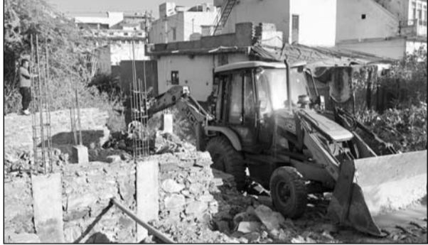
गेपसागर झील से निकलने वाले ओटे पर किए गए अवैध अतिक्रमण को जेसीबी से ध्वस्त किया।

डूंगरपुर, (निसं)। शहर में बढ़ते अतिक्रमण पर लुगाम कसने के लिए नगर परिषद ने गुरुवार को बड़ी कार्रवाई को अंजाम दिया। परिषद की टीम ने आदर्शनगर लिंक रोड स्थित एक निर्माणधीन मकान के पीछे गेपसागर झील से निकलने वाले ओटे पर किए गए अवैध अतिक्रमण को जेसीबी की मदद से ध्वस्त कर दिया।