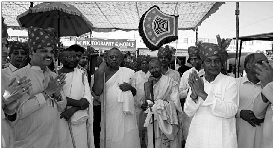
राजसमंद के श्री नाकोड़ा धाम पड़ासली में आयोजित प्रतिष्ठा महोत्सव में जैन संतों का मंगल प्रवेश हुआ।

मंगल प्रवेश के दौरान श्रद्धालुओं की बड़ी संख्या उपस्थित रही, जिन्होंने जयकारों और भक्ति भाव से संतों का अभिनंदन किया। इस अवसर पर 35 फीट ऊंची नाकोड़ाजी की भव्य प्रतिमा सभी के आकर्षण का केंद्र रही। संतों ने प्रतिमा के दर्शन कर इसे ऐतिहासिक एवं दुर्लभ स्थल बताया और इसकी भव्यता की सराहना की। उन्होंने कहा कि इस प्रकार के धार्मिक स्थल समाज में आस्था और संस्कृति के संवाहक होते हैं। कार्यक्रम समिति के संयोजक