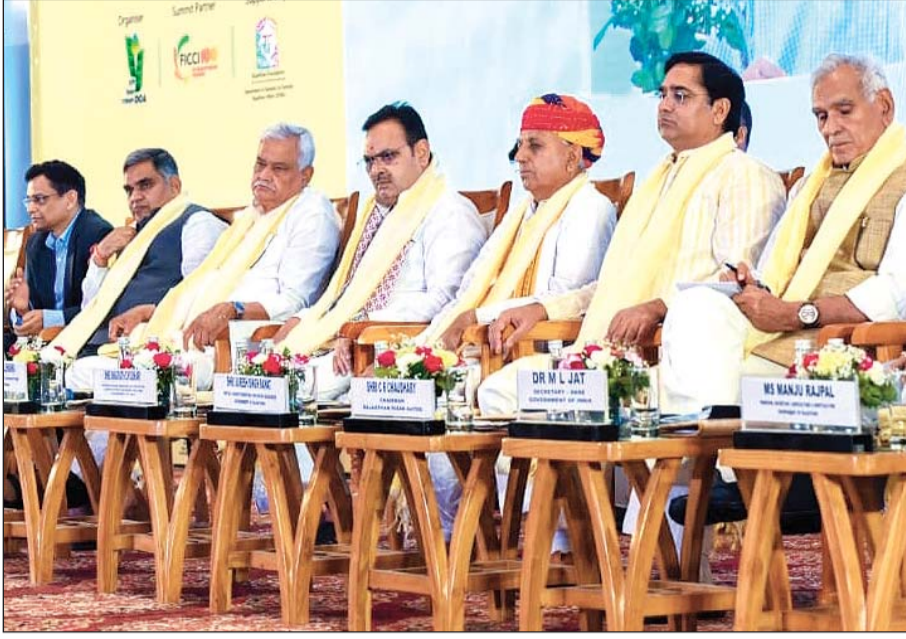
मुख्यमंत्री भजनलाल शर्मा ने गुरुवार को नई दिल्ली में आयोजित ग्राम-2026 इन्वेस्टर मीट को संबोधित किया।

■ मुख्यमंत्री भजनलाल शर्मा ने कहा कि बाजरा, सरसों, तिलहन, जौ, ग्वार, ईसबगोल व जीरे के उत्पादन में राजस्थान का देश में प्रथम स्थान है। दलहन उत्पादन के लिए झालावाड़ व टोंक को मॉडल जिले के रूप में विकसित किया जा रहा है।