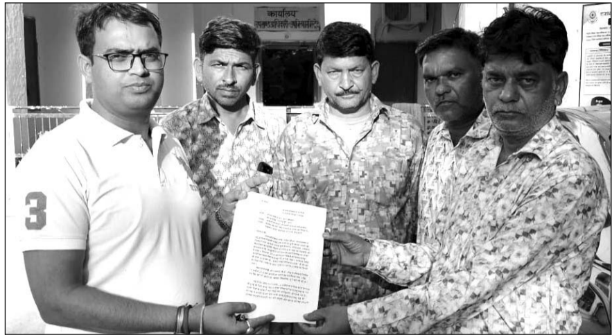
माण्डलगढ़ में समाजजनों ने एसडीएम को मुख्यमंत्री के नाम ज्ञापन दिया।