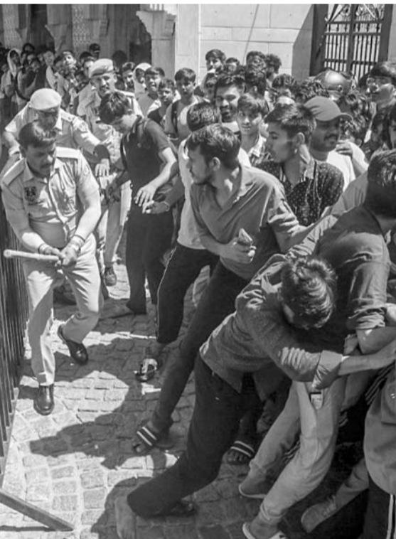
जयपुर में इंडियन प्रीमियर लीग-2026 मैच के स्टूडेंट्स के टिकट 4 घंटे में बिके : टिकट नहीं मिलने युवाओं ने फाड़े बैनर और पुलिस ने चलाये डंडे।