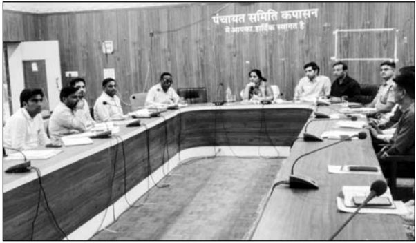
जिला कलेक्टर डॉ मंजू जिला कलेक्टर ने पंचायत समिति कपासन सभागार में ब्लॉक स्तरीय अधिकारियों को बैठक की।

कपासन, (निसं)। जिला कलेक्टर डॉ. मंजू ने गुरुवार को कपासन उपखंड क्षेत्र के सिंदपुर में स्थित नर्सरी, निंबाहेडा क्षेत्र की गौरानाथ गौशाला तथा कपासन उपजिला चिकित्सालय का निरीक्षण कर व्यवस्थाओं का जायजा लिया। निरीक्षण के दौरान जिला कलेक्टर निंबाहेडा में आयोजित रात्रि चौपाल के लिए जाते समय सिंदपुर नर्सरी पहुंची। यहां उन्होंने ग्राम पंचायत को आग बढ़ाने के उद्देश्य से नर्सरी में फलदार एवं छायादार पौधों का अधिकधिक रोपण करने के निर्देश ग्राम पंचायत सचिव एवं विकास अधिकारी को दिए। निंबाहेडा क्षेत्र में गौरानाथ गौशाला का अवलोकन करते हुए उन्होंने गौशाला परिसर में छायादार वृक्ष लगाने के निर्देश दिए। साथ ही गौशाला समिति को गौशाला के माध्यम से आय के स्रोत विकसित करने के लिए आवश्यक पहल करने को कहा, जिससे व्यवस्थाएं और सुदृढ़ हो सकें।