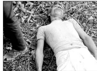
बून्दी जिले के पटपड़िया के नजदीक भुजर घाटे पर आकाशीय बिजली गिरने से तीन व्यक्तियों की मौत हो गई।