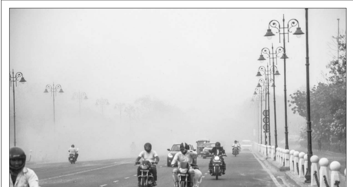
तीन दिन की तेज गर्मी के बाद शुक्रवार शाम को राजधानी जयपुर में अचानक तेज आंधी आई। इसके बाद हुई हल्की बरसात से गर्मी में कुछ राहत मिली।

'पॉलिसी का शीघ्र कराएं नवीनीकरण' जयपुर, (का.सं.)। मुख्यमंत्री आयुष्मान आरोग्य योजना में जिन परिवारों की पॉलिसी वैधता अवधि 30 अप्रैल समाप्त हो रही है, वे परिवार शीघ्र पॉलिसी का नवीनीकरण कराएं। पॉलिसी नवीनीकरण होने पर ही उन्हें 1 मई, 2024 से स्वास्थ्य बीमा योजना का लाभ मिल सकेगा।