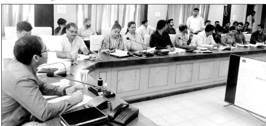
जिला स्वास्थ्य समिति की बैठक आयोजित में जिला कलेक्टर ने चिकित्सा मापदण्डों को पूरा करने के लिए निर्देश

भरतपुर (निस)। जिला कलेक्टर डॉ. अमित यादव की अध्यक्षता में जिला स्वास्थ्य समिति की बैठक शुक्रवार को कलेक्टर सभागार में आयोजित की गई। जिला कलेक्टर ने कहा कि सभी अधिकारी चिकित्सा संस्थानों में साफ-सफाई, विभागीय लक्ष्यों की प्रगति के लिये निरन्तर प्रमग कर निरीक्षण करें जिससे कमियाँ दूर हो सकें। उन्होंने मौसमी बीमारियों की रोकथाम एवं मच्छरजनित बीमारियों की रोकथाम के लिये जलभराव क्षेत्रों में गम्बूहिया मच्छली डलवाने, ग्राम पंचायतों में साफ-सफाई पर विशेष ध्यान देने के निर्देश दिये। उन्होंने कहा कि नवीन स्वीकृत चिकित्सा संस्थानों में उपकरणों की उपलब्धता के लिये स्थानीय जनप्रतिनिधियों एवं भामाशाहों के सहयोग लें। जिला कलेक्टर ने राष्ट्रीय बाल स्वास्थ्य कार्यक्रम के तहत स्क्रीनिंग किये जाने वाले सभी बच्चों का समय पर उपचार सुनिश्चित करने एवं ईलाज के बाद मिले लाभ का निरीक्षण करने के निर्देश दिये। उन्होंने कहा कि शहरी क्षेत्रों में तम्बाकू का सेवन युवाओं एवं विद्यार्थी वर्ग में देखने को मिल रहा है, कोटपा के तहत प्रभावी कार्यवाही