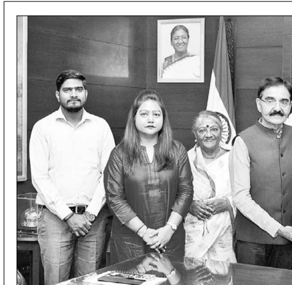
राज्यपाल कलराज मिश्र को शुक्रवार को राजभवन में सड़क सुरक्षा जागरूकता के आलोक में तैयार ट्रेफिक टैल्स ग्राफिक नोवल बूट किया गया। मुस्कान फाउंडेशन फॉर रोड सेफ्टी द्वारा प्रकाशित इस अंग्रेजी नोवल में सड़क पर वाहन चलाने से संबंधित सावधानियां, दुर्घटना से बचाव और सड़क सुरक्षा से संबंधित सावधानियों को चितकथा-रूप में संयोजित किया गया है। राज्यपाल मिश्र ने इस प्रयास की सराहना की है।

मुख्यमंत्री भजनलाल शर्मा ने शुक्रवार को प्रदेश में लोकसभा चुनाव के दूसरे चरण के तहत 13 सीटों पर शांतिपूर्ण मतदान सम्पन्न होने पर आमजन का आभार व्यक्त किया। उन्होंने कहा कि आज का मतदान प्रधानमंत्री नरेन्द्र मोदी के अद्भुत और मजबूत नेतृत्व में युवाओं, महिलाओं एवं बुजुर्गों के दृढ़ विश्वास को दिखा रहा है। प्रदेश में भारतीय जनता पार्टी सभी 25 लोकसभा सीटों पर जीत की हैट्टिक का इतिहास बनाएगी।