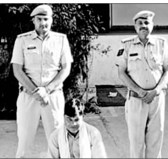
करोली कोतवाली पुलिस ने ईनामी बदमाश को गिरफ्तार कर लिया।