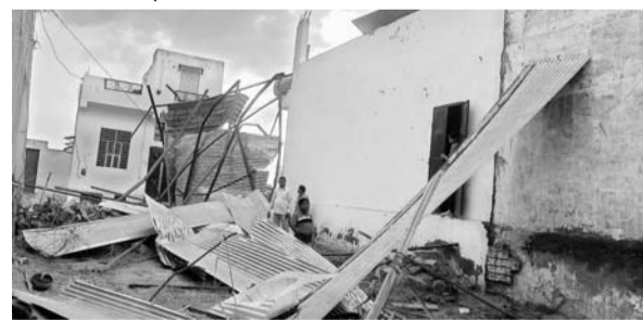
चाकसू में तेज अंधड़ और बारिश से कई जगह पर टीनशेड उड़ गए।

बिजली के पोल व तार टूट गए जिससे पूरे कस्बे में बिजली बंद हो गयी अंधड़ की रफ्तार इतनी तेज थी किसी को सम्भलने का ही मौका नहीं मिल सका। अंधड़ के बाद बादलों की तेज गर्जना के साथ जोरदार बारिश हुई सड़कों पर पानी ही पानी हो गया। छोटे-मोटे गड्ढे पानी से लबालब हो गए। हालांकि इस दौरान हुई वर्षा से लोगों को गर्मी से राहत मिल गई और मौसम