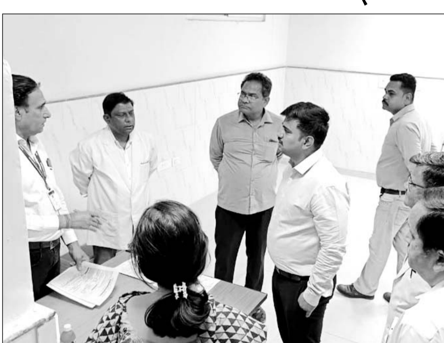
जिला कलेक्टर श्रीनिधि बी.टी. ने शुक्रवार को जिला अस्पताल धौलपुर का औचक निरीक्षण कर व्यवस्थाओं का जायजा लिया।

में बेहतर बनाने के निर्देश दिए। उन्होंने अस्पताल को साफ सफाई व्यवस्था को और दुरुस्त करने के निर्देश दिए। उन्होंने कहा कि अस्पताल परिसर में गुटेखा खाकर धुकने वाली पर सखी करें। अस्पताल परिसर में केवल गंधीर मरीजों को लाने वाले वाहनों को ही अंदर आने दें, जिससे मरीजों को सहूलियत मिल सके और अस्पताल परिसर में अवैध वाहनों का जमावडा रोक जा सके।