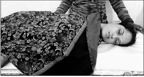
भीलवाड़ा हॉस्पिटल पहुंचने पर डॉक्टरों ने महिला को मृत घोषित कर दिया।

भीलवाड़ा, (निस)। एक विवाहिता की संदिग्ध परिस्थितियों में मौत के बाद गुस्साए पीहर पक्ष ने हॉस्पिटल में जमकर हंगामा मचाया और ससुराल पक्ष पर बेटी को दहेज के लिए प्रताड़ित करने, मारपीट करने और आज उसकी हत्या कर देने के आरोप लगाए। इधर ससुराल पक्ष के लोगों का कहना था कि लड़की के मां-बाप द्वारा लगाए गए आरोप बेबुनियाद हैं उन्होंने उनकी बहू को नहीं मारा। मामला भीलवाड़ा के आसंद थाना क्षेत्र के नेगाडिया गांव का है।