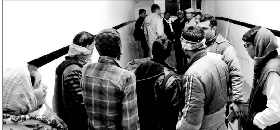
युवक की मौत से गुस्साए परिजनों ने ग्रामीणों के साथ हॉस्पिटल में हंगामा किया।

युवक की मौत से गुस्साए परिजनों ने ग्रामीणों के साथ हॉस्पिटल में जमकर हंगामा किया