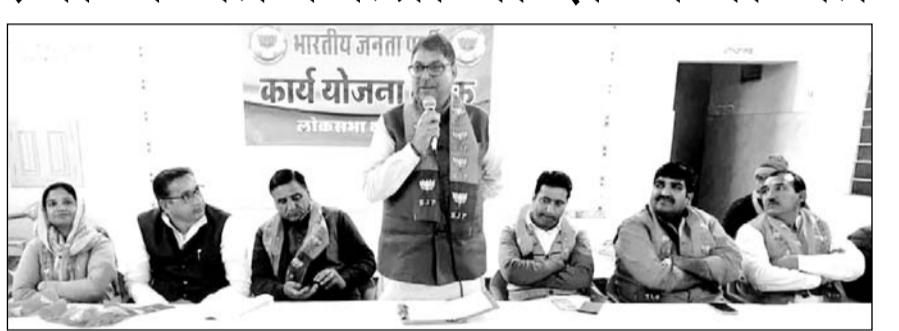
लोकसभा चुनाव की तैयारियों को लेकर डॉ. सतीश पुनियां ने बैठक ली।

जयपुर/चूरू। भाजपा पूर्व प्रदेशाध्यक्ष डॉ. सतीश पुनियां ने चूरू में लोकसभा कार्ययोजना बैठक में पार्टी के कोर समिति पदाधिकारियों व कार्यकर्ताओं के साथ संवाद किया, जिसमें उन्होंने भाजपा जिला टीम चूरू से विस्तृत चर्चा कर केंद्र में फिर से मोदी सरकार बनाने में अग्रणी योगदान देने के लिये आह्वान किया। लोकसभा चुनाव कार्ययोजना तैयारियों को लेकर डॉ. सतीश पुनियां तीन दिवसीय बीकानेर संभाग के प्रवास पर रहे, जहां उन्होंने श्रीगंगानगर, हनुमानगढ़ और चूरू में पार्टी के कोर समिति पदाधिकारियों व कार्यकर्ताओं के साथ बैठक कर केंद्र में तीसरी बार भाजपा सरकार बनाने और नरेन्द्र मोदी को तीसरी बार प्रधानमंत्री बनाने के संकल्प को पूरा करने के लिए मजबूती से कार्य करने का आह्वान किया।