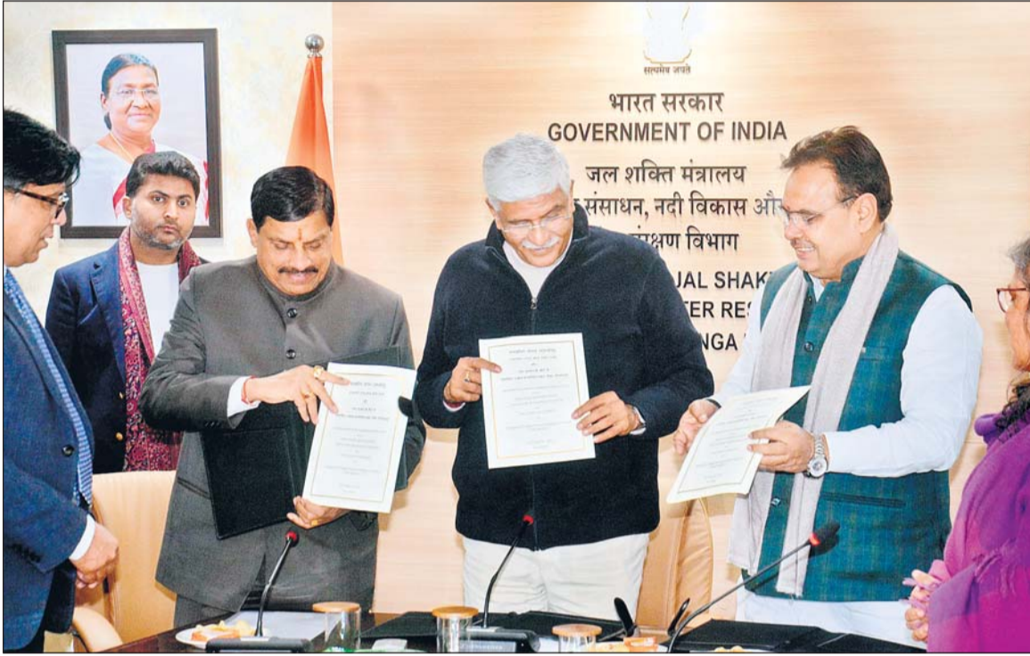
बहुप्रतीक्षित पूर्वी राजस्थान नगर परियोजना (ई.आर.सी.पी.) के निर्माण पर राजस्थान व मध्य प्रदेश के बीच एम.ओ.यू. पर हस्ताक्षर हुए। केन्द्रीय जल शक्ति मंत्री गजेन्द्र सिंह शेखावत, राजस्थान के मुख्यमंत्री भजन लाल शर्मा तथा मध्य प्रदेश के मुख्यमंत्री मोहन यादव दिल्ली में हुए इस समारोह में उपस्थित थे।