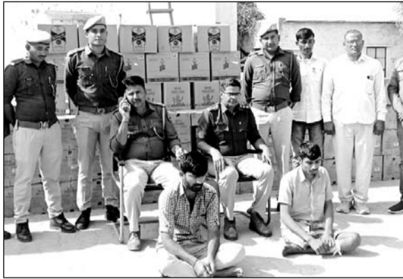
गुडामालानी पुलिस ने शराब सहित दो आरोपियों को गिरफ्तार किया।