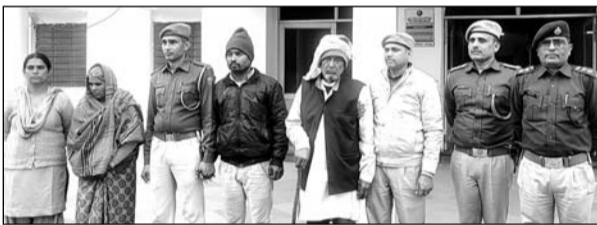
युवक की हत्या के मामले में पुलिस ने तीन को गिरफ्तार किया।

भरतपुर, (निसं)। चिकसाना थाना इलाके में एक युवक की हत्या के मामले में पुलिस ने एक महिला और दो व्यक्तियों को गिरफ्तार कर लिया है। आरोपी पक्ष जमीन पर अवैध रूप से कब्जा करना चाहता था। जिसको लेकर विवाद हुआ और एक व्यक्ति ने अपने ही परिवार के युवक को गोली मार दी। आरोपी भागने की फिराक में रेलवे स्टेशन पर था। पुलिस ने उसे रेलवे स्टेशन से ही गिरफ्तार कर लिया।