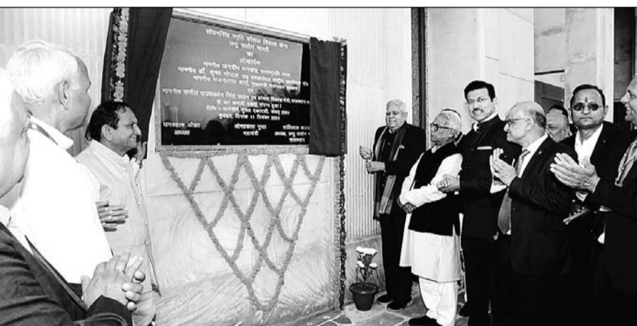
उपराष्ट्रपति जगदीप धनखड़ ने बुधवार को जयपुर में अपैरल पार्क रीको औद्योगिक क्षेत्र में लघु उद्योग भारतीय की ओर से नव निर्मित सोहन सिंह स्मृति कौशल विकास केंद्र का लोकार्पण किया।

जयपुर। ज्ञान और कौशल के भरोसे ही विकसित भारत का संकल्प सार्थक होगा। कौशल से व्यक्ति को सामर्थ्य और सम्मान दोनों ही मिलते हैं। ये कहना है उपराष्ट्रपति जगदीप धनखड़ का। वे आज जयपुर में अपैरल पार्क रीको औद्योगिक क्षेत्र में लघु उद्योग भारतीय की ओर से नव निर्मित सोहन सिंह स्मृति कौशल विकास केंद्र के लोकार्पण समारोह को सम्बोधित कर रहे थे।