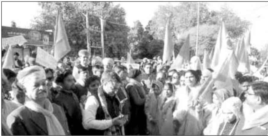
करौली शहर के प्रमुख मार्गों से होकर गुजरती आक्रोश रैली में शामिल लोग ।

लिफ बांग्लादेश में हिंदू समुदाय पर हो रहे अत्याचारों को लेकर नारेबाजी करते हुए चल रहे थे रैली शहर के हिंडौन गेट, फूटाकोट चैराहा,सदर बाजार,अनाज मंडी,बड़ा बाजार,वजीरपुर गेट, कलेक्ट्रेट सकिंल होते हुए जिला कलेक्ट्रेट पहुंची जहां हिंदू समाज के कई प्रमुख लोगों और संत समुदाय ने रैली को संबोधित करते हुए अपना आक्रोश जताया इसके पश्चात राष्ट्रीय