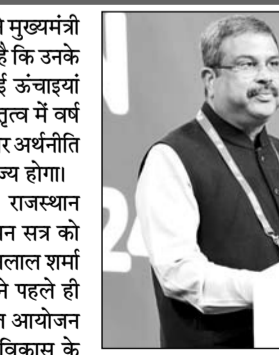
केन्द्रीय शिक्षा मंत्री धर्मेन्द्र प्रधान

जयपुर। केन्द्रीय शिक्षा मंत्री धर्मेन्द्र प्रधान ने मुख्यमंत्री भजनलाल शर्मा की प्रशंसा करते हुए कहा है कि उनके कुशल नेतृत्व में राजस्थान विकास की नई ऊंचाइयां छू रहा है और प्रधानमंत्री नरेन्द्र मोदी ने वर्ष 2047 तक भारत दुनिया का सबसे ताकतवर अर्थनीति बनेगा तथा राजस्थान भारत का अग्रणी राज्य होगा।