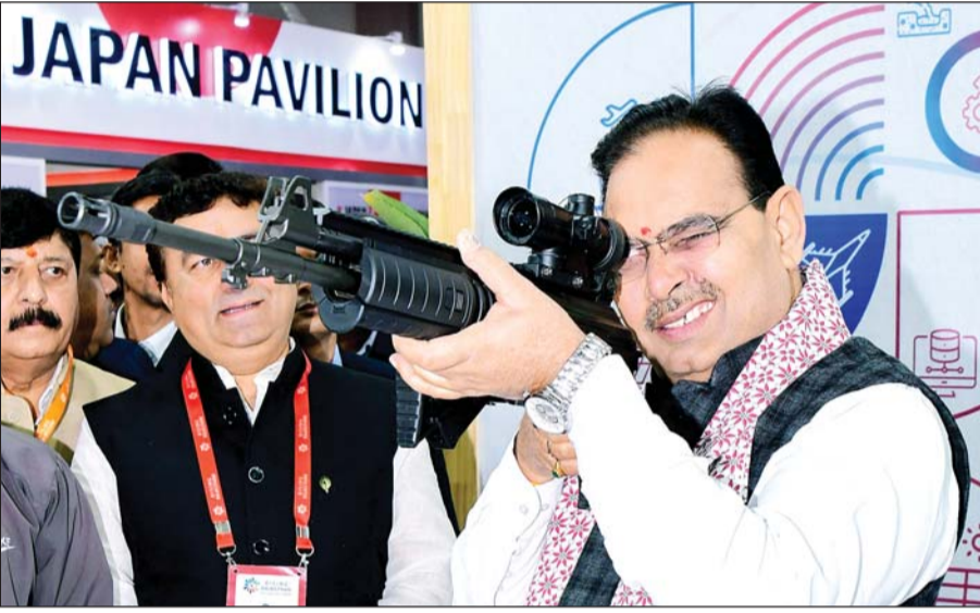
राइजिंग राजस्थान ग्लोबल इन्वेस्टमेंट समिट के समापन पर मुख्यमंत्री भजनलाल शर्मा ने विभिन्न कंपनियों और उपक्रमों के एग्जिक्यूटिव बूथों का जायजा लिया। उन्होंने "बिल्डिंग अ सिक्वोर नेशन" बूथ पर आधुनिक हथियारों का निरीक्षण किया।

राजस्थान समिट में हुए एम.ओ.यू. को धरातल पर उतारने के लिए पूरी शक्ति के साथ काम करेंगे। अगले वर्ष 11