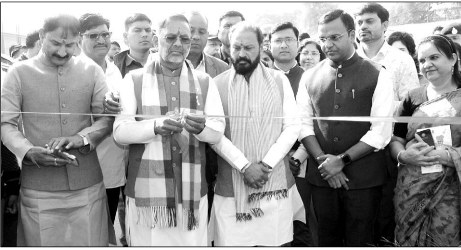
ऊर्जा मंत्री हीरालाल नागर जिला स्तरीय प्रदर्शनी का उद्घाटन किया।

कोटा, (निर्स)। राजस्थान सरकार के एक वर्ष पूर्ण होने के उपलक्ष्य में जिला स्तरीय प्रदर्शनी का आयोजन महाराव उम्मेद सिंह स्टेडियम में गुरुवार को किया गया। मुख्य अतिथि ऊर्जा मंत्री हीरालाल नागर ने प्रदर्शनी का उद्घाटन कर अवलोकन किया। प्रदर्शनी में सूचना एवं जनसम्पर्क विभाग द्वारा मुख्यमंत्री भजन लाल शर्मा के नेतृत्व में हुए नवाचारों, विकास कार्यों को फोटो के माध्यम से प्रदर्शित किया गया। विभिन्न विभागों द्वारा भी विकास कार्यों एवं उपलब्धियों को प्रदर्शनी में तैयार किया गया। ऊर्जा मंत्री ने इस अवसर पर पंच गौरव प्रदर्शनी का भी शुभारंभ किया।