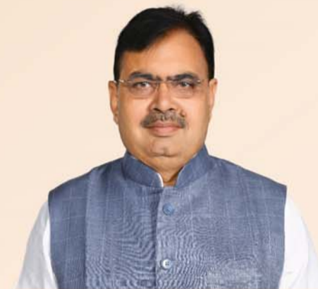
श्री भजनलाल शर्मा माननीय मुख्यमंत्री