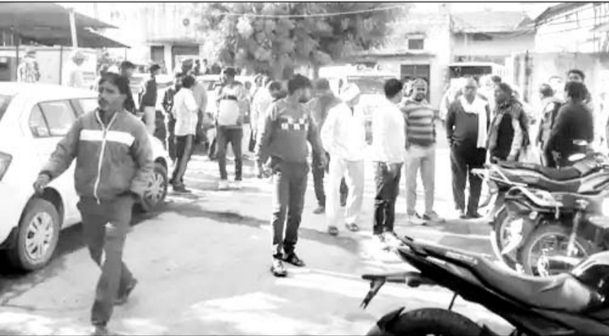
गंगापुर सिटी में अस्पताल में लगी परिजनों की भीड़।