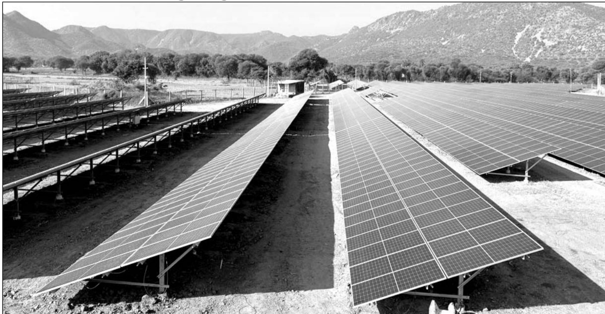
राज्य में “पीएम कुसुम योजना” को जमीनी स्तर पर क्रियान्वयन को गति मिल रही है।

उल्लेखनीय है कि बोते करीब दो माह में जयपुर विद्युत वितरण निगम में कुसुम योजना के कंपोनेंट-सी के अन्तर्गत कुल 42 मेगावाट क्षमता के 15 प्लांट स्थापित किए जा चुके हैं। इनमें कोटपूतली सर्किल में सर्वाधिक सात, पिवाड़ी वृत्त में पाँच तथा जयपुर जिला उत्तर, जयपुर जिला दक्षिण एवं झालावाड़ वृत्त क्षेत्र में एक-एक सौर ऊर्जा संयंत्रों से बिजली उत्पादन प्रारंभ किया गया है। कंपोनेंट-सी के अन्तर्गत जयपुर डिस्कॉम में अब तक 52.63 मेगावाट क्षमता के कुल 20 सोलर प्लांट स्थापित हो चुके हैं, जिनसे 5575 किसानों को खेतों के लिए दिन में बिजली उपलब्ध हो रही है। वहीं अजमेर एवं जोधपुर डिस्कॉम को मिलाकर तीनों डिस्कॉम में