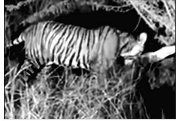
सर्वाइमाधोपुर के रणथंभौर टाइगर नेशनल पार्क के त्रिनेत्र गणेश मंदिर सड़क मार्ग पर बाघिन टी-107 में एक गाय का शिकार किया।

बॉली-बामनवास, (निसं)। सर्वाइमाधोपुर के रणथंभौर टाइगर नेशनल पार्क के त्रिनेत्र गणेश मंदिर सड़क मार्ग पर स्थित शिल्पग्राम व जोगीमहल रेस्टोरेंट के पास बुधवार शाम को सुल्ताना नाम से प्रसिद्ध बाघिन टी-107 में एक गाय का शिकार किया। इस दौरान वहां पर उपस्थित लोगों ने बाघिन के भ्रमण व शिकार का वीडियो व फोटो सोशल मीडिया पर भेजा। सूचना पाकर वन विभाग की टीम मौके पर पहुंची एवं लोगों को वहां से हटाकर बाघिन को जंगल में भेजा। सुल्ताना बाघिन का टेरेटरी जॉन नंबर एक एवं गणेश परिक्रमा मार्ग है अनेकों बार वह रणथंभौर त्रिनेत्र गणेश जी मंदिर के सड़क मार्ग पर आती रहती है।