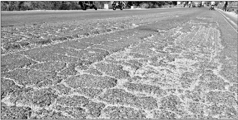
मांडलगाढ़ से भीलवाड़ा एनएच 758 सड़क मार्ग कई जगह से क्षतिग्रस्त हो गया है।

माण्डलगाढ़, (निर्स)। मांडलगाढ़ लाडपुरा से भीलवाड़ा तक 60 किलोमीटर सड़क मार्ग विगत 8 साल से नेशनल हाइवे 758 घोषित चला आ रहा है, लेकिन मौक़े पर टू लेन सड़क होने के बावजूद वाहनों से नेशनल हाइवे के नियमों से सड़क का वाहनों से टोल वसूला जा रहा है। गत 8 वर्षों में टोल प्लाज़ा पर सड़क निर्माण की लागत से भी अधिक राशि वसूल कर ली गई है। वहीं एनएचएआई के अधिकारियों की कथित लापरवाही के चलते रखरखाव के अभाव में सड़क दुर्घटना का शिकार हो रही है। नेशनल हाइवे की यह टू लेन सड़क कई जगह से क्षतिग्रस्त होने से दो साल में सैकड़ों हादसे हो चुके हैं। जिसमें कई लोगों की मौत हो चुकी है।