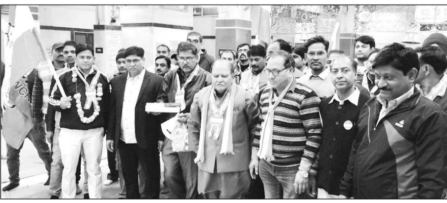
रेलवे मान्यता चुनाव में कर्मचारियों ने जीत का जश्न मनाया।