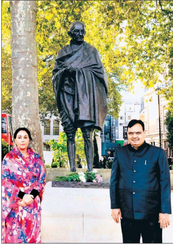
लन्दन यात्रा के दौरान मुख्यमंत्री भजन लाल शर्मा तथा उपमुख्यमंत्री दीपा कुमारी ने ब्रिटेन के पार्लियामेंट हाउस लंदन के सामने महात्मा गांधी की प्रतिमा पर पुष्प अर्पित कर श्रद्धांजलि दी।

उपमुख्यमंत्री दीपा कुमारी ने गुरुवार को प्रवासी राजस्थानी समुदाय से संवाद किया। उन्होंने कहा कि यू.के. के प्रवासी समुदाय की उद्यमिता राजस्थान में व्यापार को प्रोत्साहित कर नए रोजगार के अवसर पैदा कर सकती है। दिया कुमारी