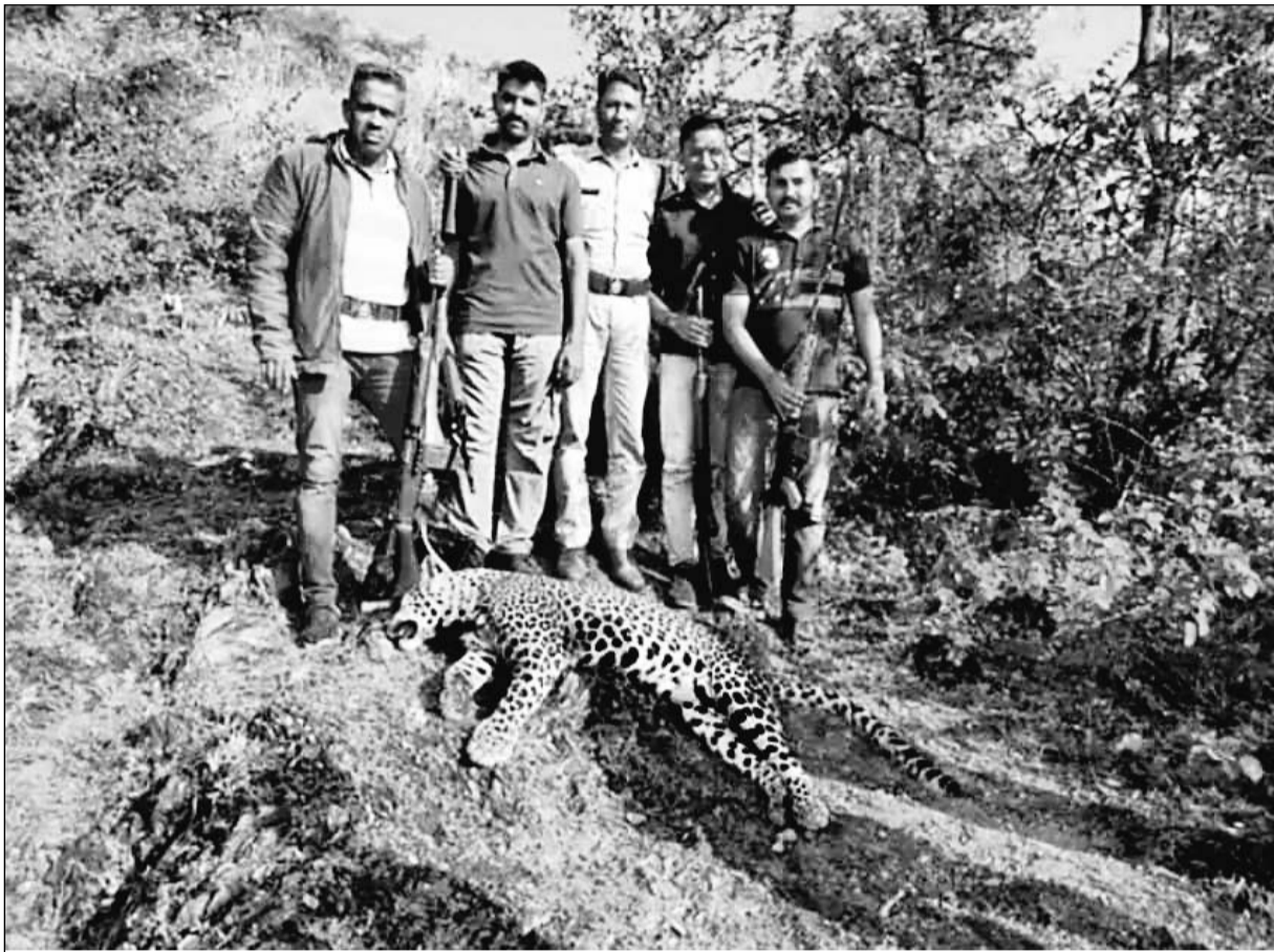
आखिरकार आदमखोर पैंथर मारा गया, जिसके आतंक और डर से उदयपुर के ग्रामीण इलाके के लोगों की रातों की नींद हाराम थी। वन विभाग और पुलिस की टीम ने संयुक्त कार्यवाही करते हुए शुक्रवार को सुबह मदार बड़ा तालाब पर पैंथर को गोली मार दी। मारा गया पैंथर नर है। पैंथर को उसी जगह मारा गया, जहाँ उसने एक महिला का शिकार किया था। अभी यह पुष्टि होना बाकी है कि क्या यह वही आदमखोर पैंथर है, पर, जिस तरह से इसने घेराबंदी किए हुए एक जवान पर हमला किया उससे संभावना है कि यह वही आदमखोर पैंथर हो सकता है।