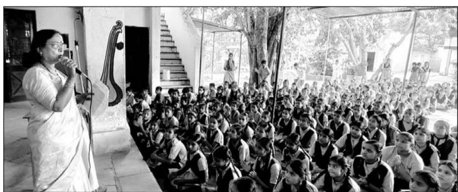
पांच हजार से अधिक बालिकाओं एवं विद्यार्थियों को "आवाज दो" कार्यक्रम की विस्तृत जानकारी दी।