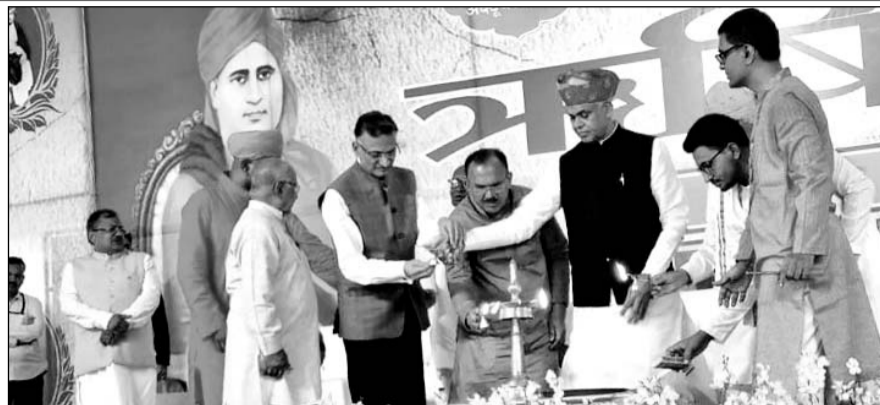
गुजरात के राज्यपाल आचार्य देवव्रत ने ऋषि मेले का शुभारंभ किया।

देवव्रत ने कहा कि लोग देसी गौमाता, प्राकृतिक कृषि और पर्यावरण के संरक्षण का संकल्प लेंगे। महर्षि दयानन्द सरस्वती की 200 वीं जयंती इसी मिशन के साथ मनाई जा रही है। आर्य समाज सदा से ही समाज व देश सेवा में अग्रणी रहा है। महर्षि दयानन्द सरस्वती जो देश के बड़े समाज सुधारक और सांस्कृतिक मूल्यों के संस्थापक, संस्कृति के प्रचारक रहे हैं उनके विचार जनमानस तक पहुंचे इस