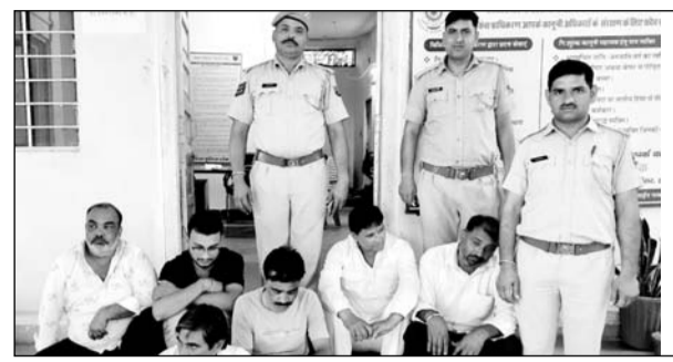
बरोनी थाना पुलिस ने जुआरियों को गिरफ्तार किया।