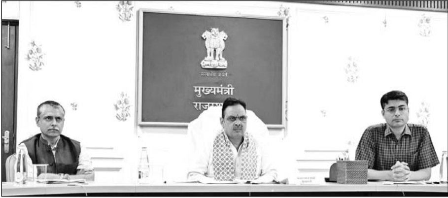
मुख्यमंत्री भजनलाल शर्मा ने शुक्रवार को मुख्यमंत्री कार्यालय में आयोजित राज उन्नति की छठी बैठक में अधिकारियों दिशा-निर्देश दिए।

मुख्यमंत्री भजनलाल शर्मा ने श्रीगंगानगर जिले में एक ही भूमि के दो पट्टे जारी किए जाने पर जन सुविधा की आरक्षित भूमि पर व्यवसायिक पट्टा देने के प्रकरण में यूआईटी सचिव सहित 6 कार्मिकों को निलंबित करने के निर्देश दिए।