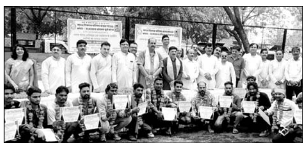
भारत विकास परिषद केशव शाखा द्वारा सफाईकर्मीयों को सम्मानित किया गया।

कोटा, (निसं)। भारत विकास परिषद केशव शाखा की ओर से स्वच्छ भारत अभियान में प्रथम प्रहरी के रूप में योगदान दे रहे सफाईकर्मीयों का सम्मान समारोह रविवार को श्रीनाथपुरम स्थित अग्निशमन केंद्र पर किया गया।