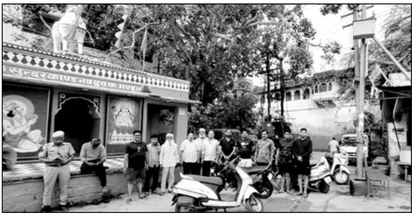
मंदिर के पास बने अवैध कचरा डिपो से आमजन परेशान है।

वार्ड के धार्मिक क्षेत्र रंगनाथ मंदिर के आस पास के क्षेत्र में बने अवैध कचरा डिपो ने क्षेत्रवासियों का जीना दुश्वार कर रखा है। जहां दूरे वार्डों का कचरा लाकर उडला जाता है पर नगर परिषद में वार्डों के मुखिया प्रदर्शन व जापनबाजियों के अलावा कुछ कर नहीं पा रहे है। रविवार को रंगनाथ मंदिर क्षेत्रवासियों ने अवैध कचरा डिपो को हटाने की मांग को लेकर बुलबुल के चबुतरे पर प्रदर्शन कर समस्या