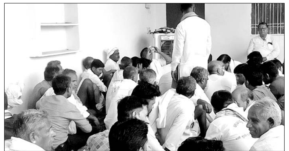
गाडरी समाज की बैठक में समाजबंधु मौजूद रहे।

साथ ही दुकान की बोली लगाने के लिए पहले दस हजार रुपए की रसीद समिति के यहां कटवानी होगी। तत्पश्चात ही दुकानों की बोली में भाग लिया जा सकेगा। बोली में भाग लेने के लिए रसीद 30 जुलाई से एक