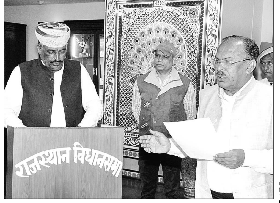
विधानसभा अध्यक्ष वासुदेव देवनानी ने उपचुनाव में निर्वाचित हुए सात नव निर्वाचित विधानसभा सदस्यों को शपथ दिलाई।

जयपुरा विधानसभा अध्यक्ष वासुदेव देवनानी ने मंगलवार को विधानसभा उपचुनाव में निर्वाचित हुए सात विधायकों को अपने कक्ष में विधानसभा सदस्य पद की शपथ दिलायी। सभी विधायकों ने हिंदी भाषा में विधानसभा सदस्य पद की शपथ ग्रहण की। इस अवसर पर देवनानी ने सभी नव निर्वाचित विधायकों को बधाई एवं