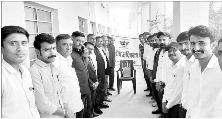
जालोर में अधिवक्ता परिषद की ओर से अधिवक्ता दिवस मनाया गया।