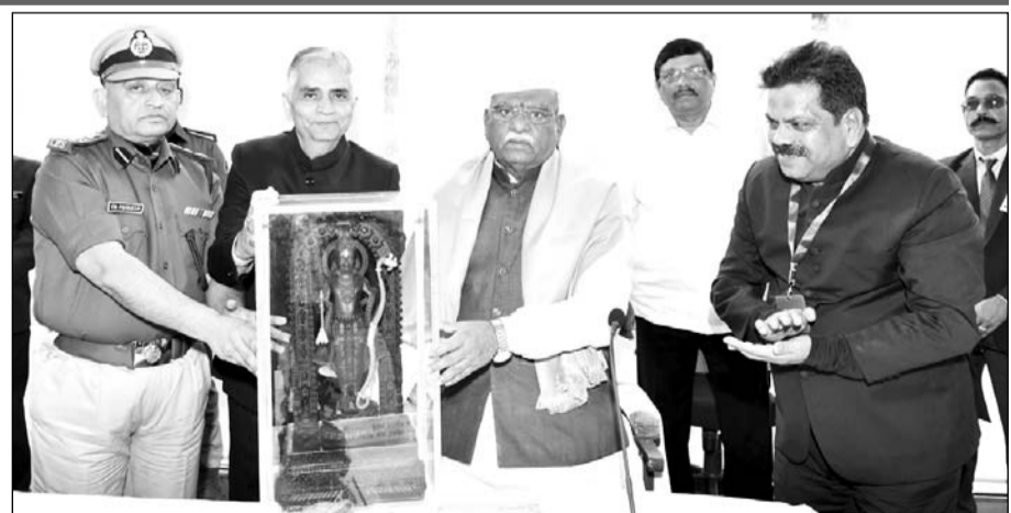
राज्यपाल हरिभाऊ बागडे का ब्यावर में स्वागत किया।

ब्यावर (निर्स) राज्यपाल ने जिला स्तरीय अधिकारियों की बैठक लेकर केंद्र व राज्य सरकार की योजनाओं की समीक्षा की। राज्यपाल हरिभाऊ बागडे ने कहा कि गरीब वंचित वर्ग के उत्थान के लिए विभागीय अधिकारी हमेशा कटिबद्ध रहे। जिले के अंतिम छोर तक बैठे प्रत्येक वंचित एवं पात्र व्यक्ति को विकास कार्यक्रमों व योजनाओं से लाभान्वित करें।