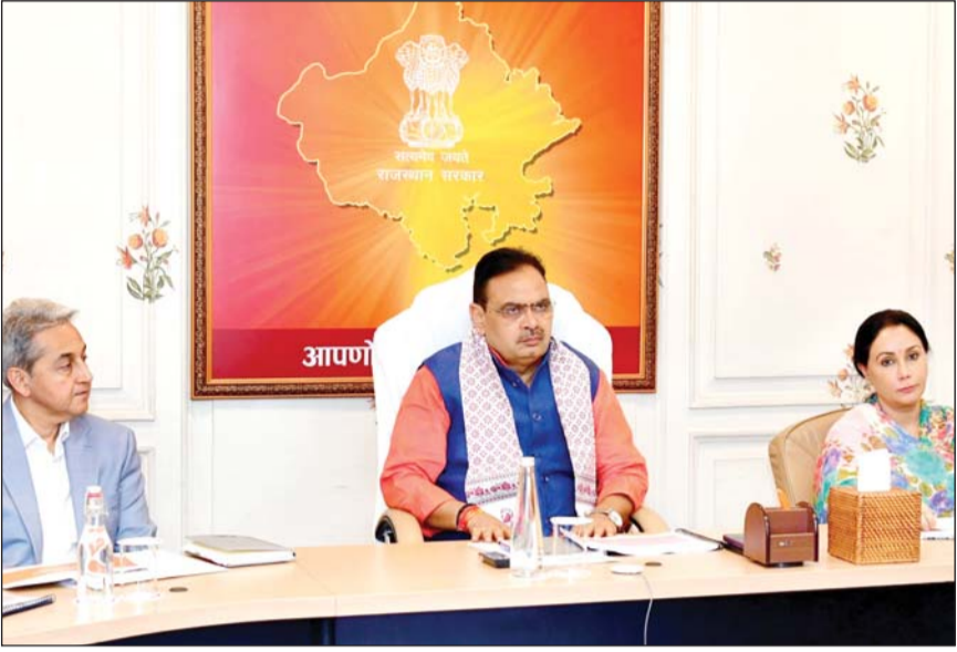
मुख्यमंत्री भजनलाल शर्मा ने महिला एवं बाल विकास विभाग की समीक्षा बैठक को संबोधित किया और अधिकारियों को आंगनबाड़ी केन्द्रों का सघन निरीक्षण करने और आवश्यक व्यवस्थाएं दुरुस्त करने के लिए निर्देश दिए।

मुख्यमंत्री ने शिक्षा सेतु योजना की समीक्षा की व अधिकारियों से कहा कि बीच में ही पढ़ाई छोड़ने वाली लड़कियों को शिक्षा की मुख्य धारा से जोड़ने वाले व्यक्तियों एवं संस्थाओं को प्रोत्साहित एवं पुरस्कृत किया जाए। मुख्यमंत्री ने कहा कि बालिकाओं को समुचित शिक्षा और सम्बल प्रदान करने के लिए ‘लाडो प्रोत्साहन योजना’ अहम है, जिसके तहत हमारी सरकार बेटों के जन्म से लेकर स्नातक शिक्षा पूरी करने तक एक लाख रुपये की राशि दे रही है। उन्होंने बताया, राज्य सरकार शीघ्र ही इसके अन्तर्गत 1 साथ 1 लाख लाभार्थियों को खतों में प्रति लाभार्थी 2500 रुपये की किस्त हस्तांतरित करेगी। उन्होंने यह भी बताया कि राज्य