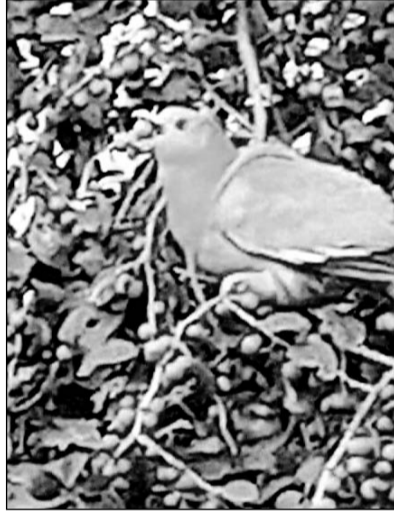
हरियल पक्षी ( येलो फुटेज ग्रीन पिजन )