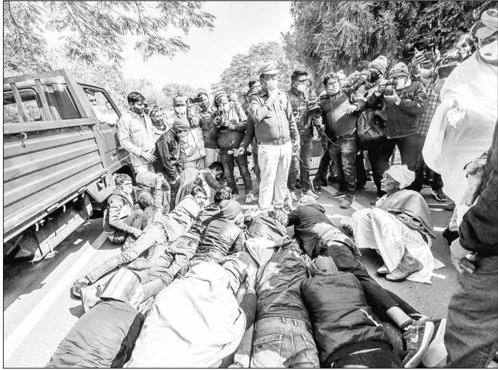
संपूर्ण कर्ज माफी की मांग को लेकर किसानों ने सिविल लाइन्स फाटक पर दंडवत विरोध प्रदर्शन किया।

जयपुर (कासं)। सांसद किरोड़ी मीणा ने राज्य सरकार पर वादाखिलाफी का आरोप लगाते हुए याद दिलाया कि प्रदेश के किसानों का पूरा माफ होना चाहिए था। मुख्यमंत्री ने अभी किसानों की कृषि भूमि नीलामी आदेश को स्थगित किया है, जबकि पूर्ण कर्जों माफ करते हुए 15 लाख से अधिक किसानों की कृषि भूमि नीलामी के आदेश को निरस्त किया जाए।