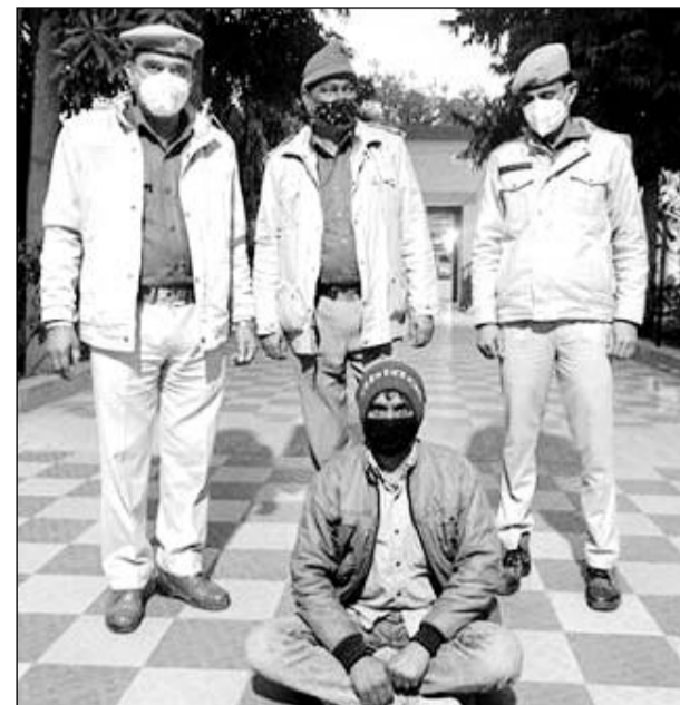
सीआईडी क्राइम ब्रांच जयपुर की टीम ने जम्मू-कश्मीर के अनंतनाग से लाई गई 5 किलो चरस के साथ तस्कर को गिरफ्तार किया।