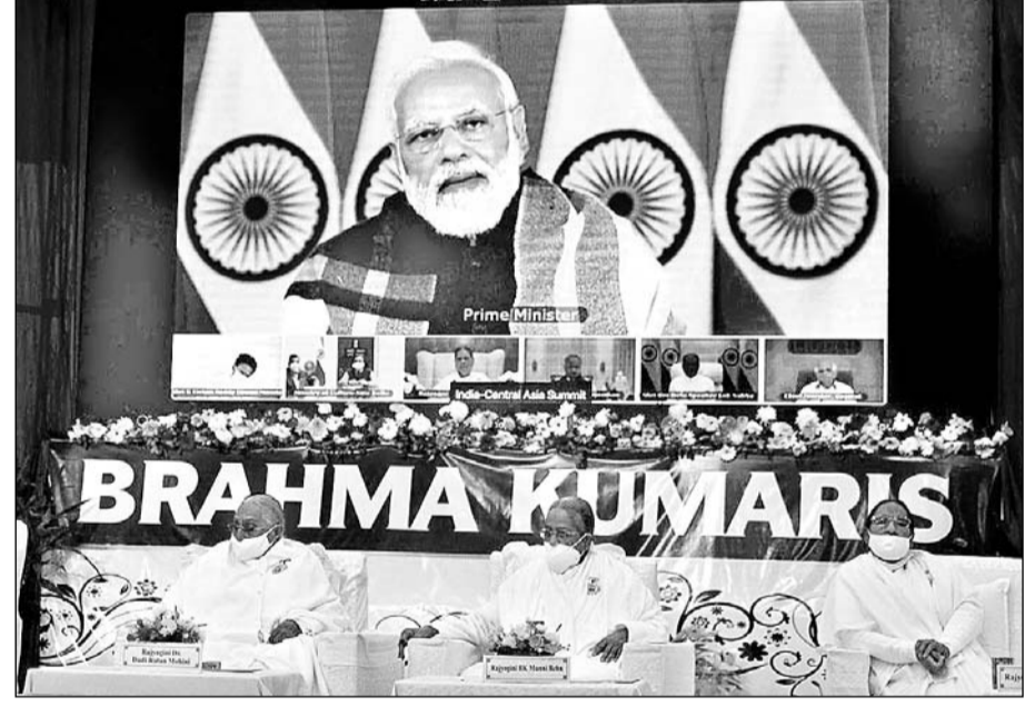
प्रधानमंत्री नरेन्द्र मोदी ने ब्रह्माकुमारीज संस्था के आबूरुड स्थित शांतिवन परिसर में आजादी के अमृत महोत्सव से स्वर्णिम भारत की ओर अभियान का वचुँअल शुभारंभ किया।

आबूरुड, (निर्स)। प्रधानमंत्री नरेन्द्र मोदी ने गुरुवार को ब्रह्माकुमारीज संस्था के आबूरुड स्थित शांतिवन परिसर में आजादी के अमृत महोत्सव से स्वर्णिम भारत की ओर अभियान का वचुँअल शुभारंभ किया। इसके साथ सात अभियानों को हरी झंडी दिखाई। इस अवसर पर उन्होंने कहा कि त्याग और कर्त्तव्य भाव से करोड़ों देशवासी आज स्वर्णिम भारत की नींव रख रहे हैं। राष्ट्र की प्रगति से ही हमारी