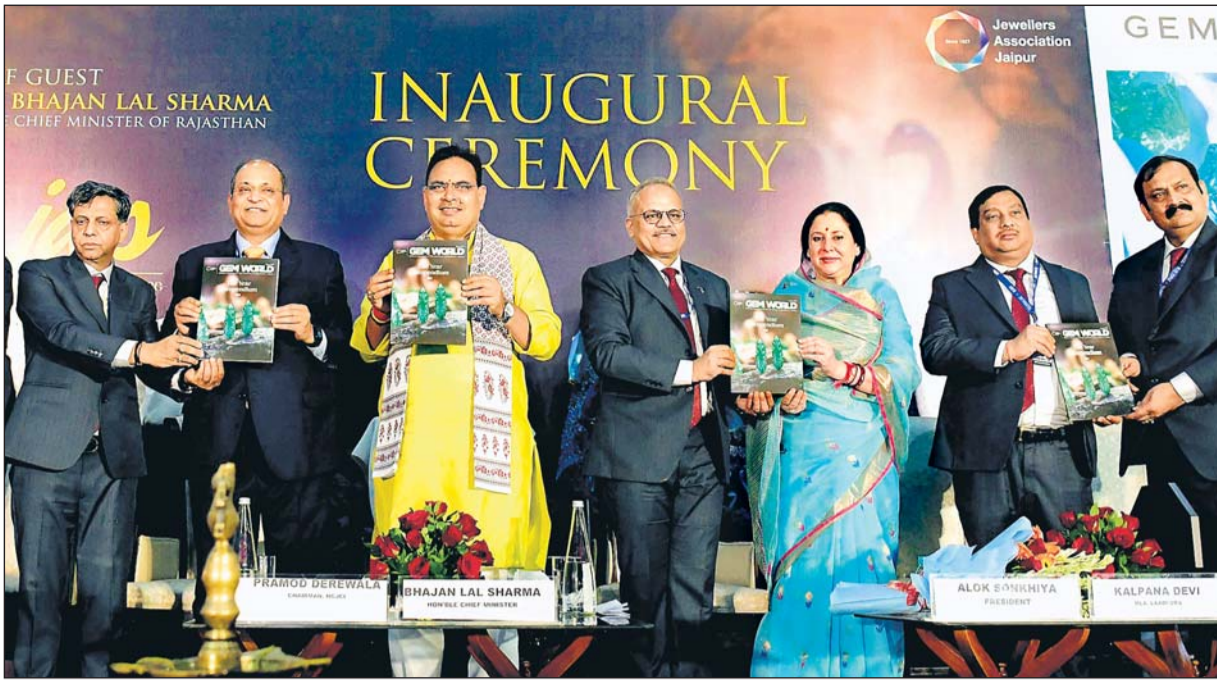
मुख्यमंत्री भजनलाल शर्मा ने शुक्रवार को सीतापुरा में जूली एसोसिएशन द्वारा आयोजित "जस-2024" का उद्घाटन किया।