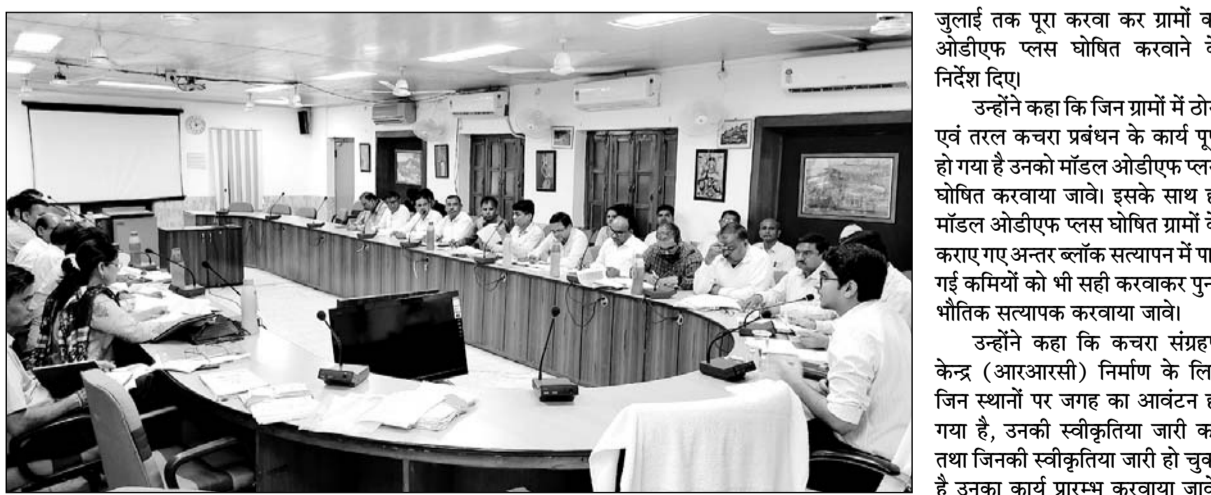
स्वच्छ भारत मिशन योजना की जिला स्तरीय बैठक जिला कलेक्टर अक्षय गोदारा की अध्यक्षता में आयोजित हुई।

उन्होंने निर्देश दिए कि जिन गांवों में शमशान के लिए भूमि आवंटित नहीं है, उन स्थानों के लिए प्रस्ताव बनाकर भिजवाए जाएं। उन्होंने निर्देश दिए कि मनरेगा के तहत अधिक से अधिक कार्य स्वीकृत किए जाएं उन्होंने निर्देश दिए