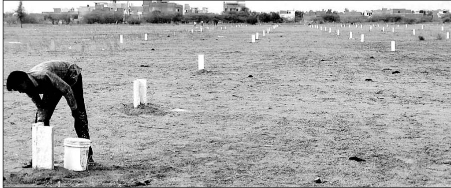
जालोर में बिना भू-रूपानान्तरण के कृषि भूमि पर प्लांटिंग की गई।

जालोर में प्रशासनिक उदासीनता के चलते जालोर शहर के आसपास कृषि भूमि पर भू-माफियाओं द्वारा नियम विरुद्ध बिना किसी प्रकार से भू-रूपानान्तरण किये कॉलोनियां काटकर भूखण्ड बेचे जा रहे हैं। जबकि राज्य सरकार के आदेशानुसार बिना भू-रूपानान्तरण किये किसी भी प्रकार से कृषि भूखण्ड पर कॉलोनियां नहीं काटी जा सकती है। वहीं कृषि भूखण्ड पर कॉलोनियां काट कर उसकी बेचाननामा