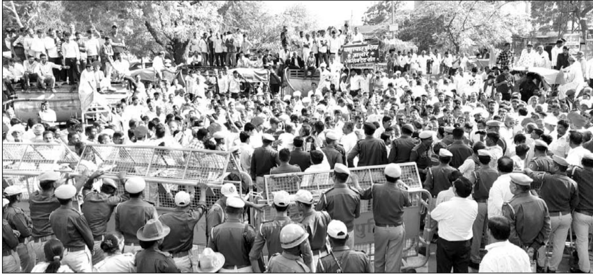
जवाई बांध के पानी पर जालोर के हक को लेकर चल रहा आंदोलन दसवें दिन भी जारी रहा।

जालोर में जवाई बांध के पानी पर जालोर के लिए एक तिहाई हक तय