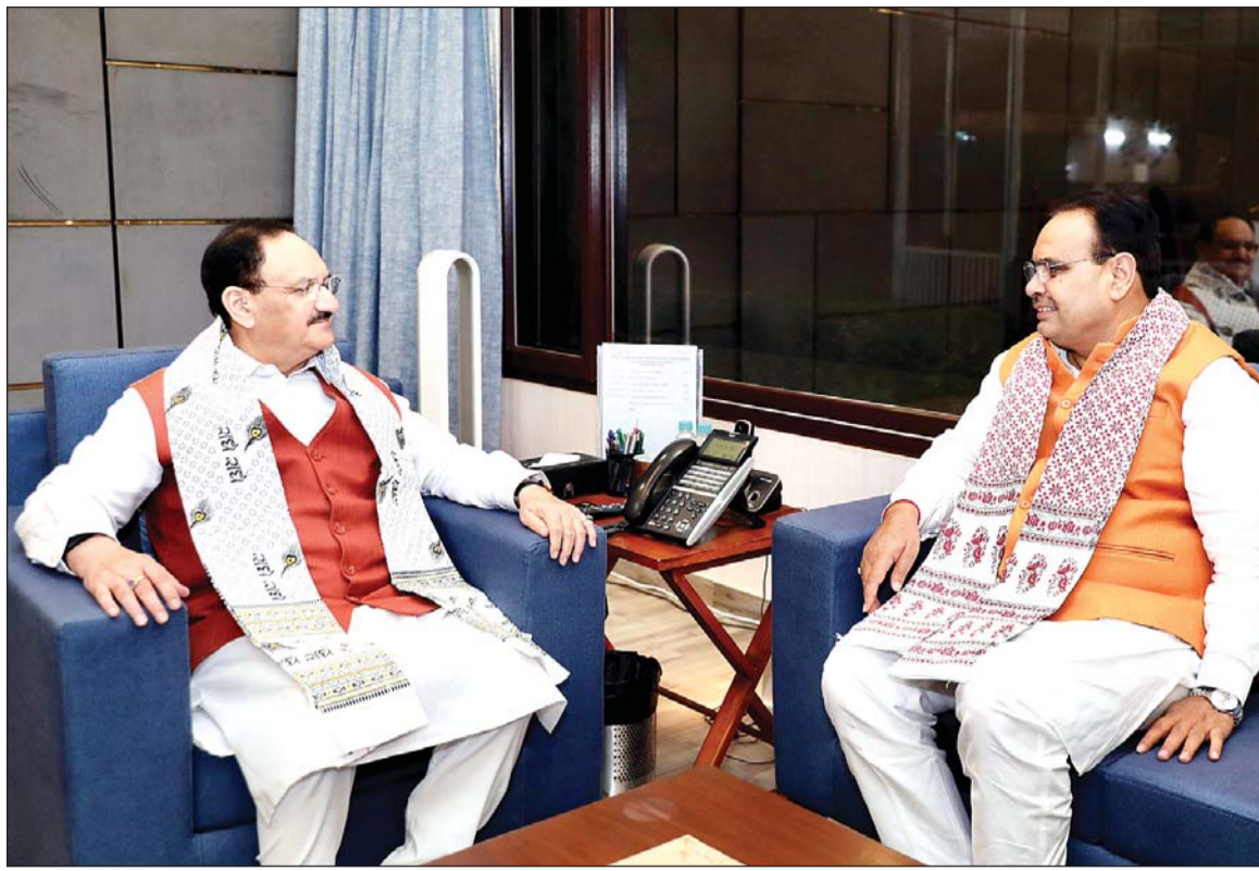
मुख्यमंत्री भजनलाल शर्मा ने भाजपा के राष्ट्रीय अध्यक्ष व केन्द्रीय स्वास्थ्य एवं परिवार कल्याण और रसायन एवं उर्वरक मंत्री जे. पी. नड्डा से नई दिल्ली में शिष्टाचार भेंट की। राजस्थान में स्वास्थ्य इग्रास्ट्रक्चर के विकास, चिकित्सा सुविधाओं के विस्तार एवं जन स्वास्थ्य योजनाओं के क्रियान्वयन पर विस्तृत चर्चा की तथा मार्गदर्शन लिया। राजस्थान के उपचुनावों में शानदार जीत के बाद मुख्यमंत्री की भाजपा के राष्ट्रीय अध्यक्ष से यह पहली मुलाकात थी।