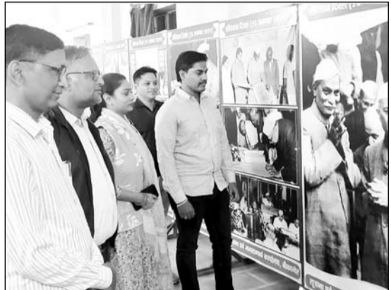
संविधान दिवस से जुड़ी फोटो प्रदर्शनी का अनेक लोगों ने अवलोकन किया।