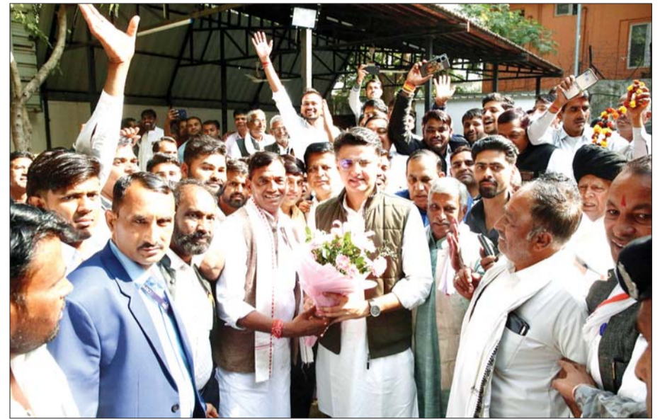
दौसा विधानसभा के नवनिर्वाचित विधायक दीनदयाल बैरवा ने अपने परिजनों एवं क्षेत्रवासियों के साथ कांग्रेस के राष्ट्रीय महासचिव व पूर्व उप मुख्यमंत्री सचिन पायलट से उनके घर पर मुलाकात की व आभार प्रकट किया।

जयपुर, 27 नवम्बर। दौसा से नव-निर्वाचित विधायक दीनदयाल बैरवा के नेतृत्व में आज सैकड़ों कार्यकर्ताओं एवं आमजन ने जयपुर में कांग्रेस के राष्ट्रीय महासचिव एवं पूर्व उप मुख्यमंत्री सचिन पायलट का आभार एवं धन्यवाद व्यक्त किया।