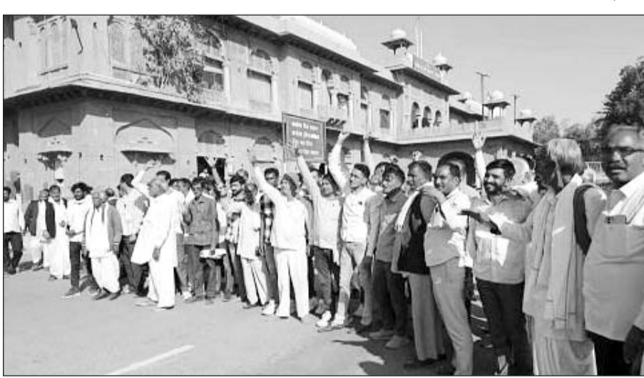
प्रधानमंत्री फसल बीमा योजना में फर्जीवाड़े के विरोध में ग्रामीणों ने प्रदर्शन कर विरोध जताया।

बीकानेर, (कासं)। जिले के नोखा तहसील के सोमलसर गांव में प्रधानमंत्री फसल बीमा योजना के तहत फर्जीवाड़े कर अपने खातों में लाखों रुपये डलवाने का मामला सामने आया है। जिसके विरोध में गांव के अनेक लोगों ने कलेक्टर कार्यालय के सामने प्रदर्शन कर ज्ञापन सौंपते हुए फर्जीवाड़े को मांग की है।