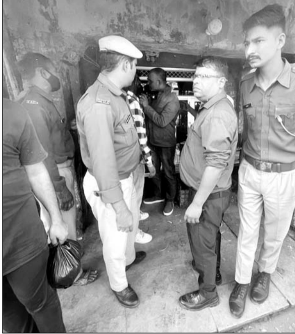
नगर निगम हैरिटेज की पशु प्रबंधन शाखा ने बुधवार को परकोटा क्षेत्र में संचालित मांस की अवेध दुकानों पर कार्रवाई की।