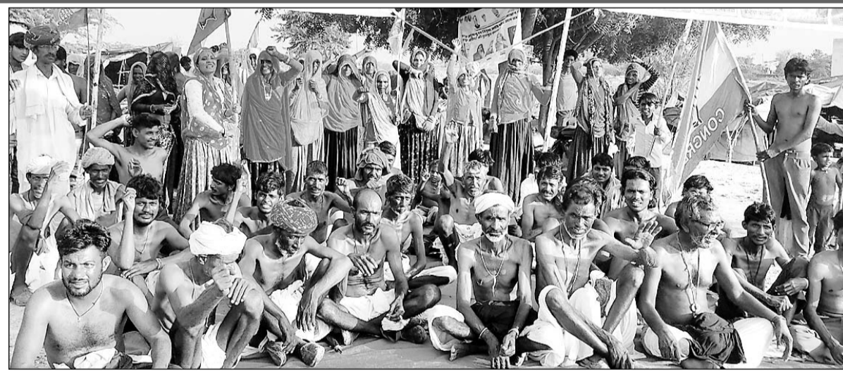
घुमंतू जाति के लोगों ने अर्धनग्न होकर तीसरे दिन भी सरकार से मकान, बिजली-पानी और न्याय की मांग की।