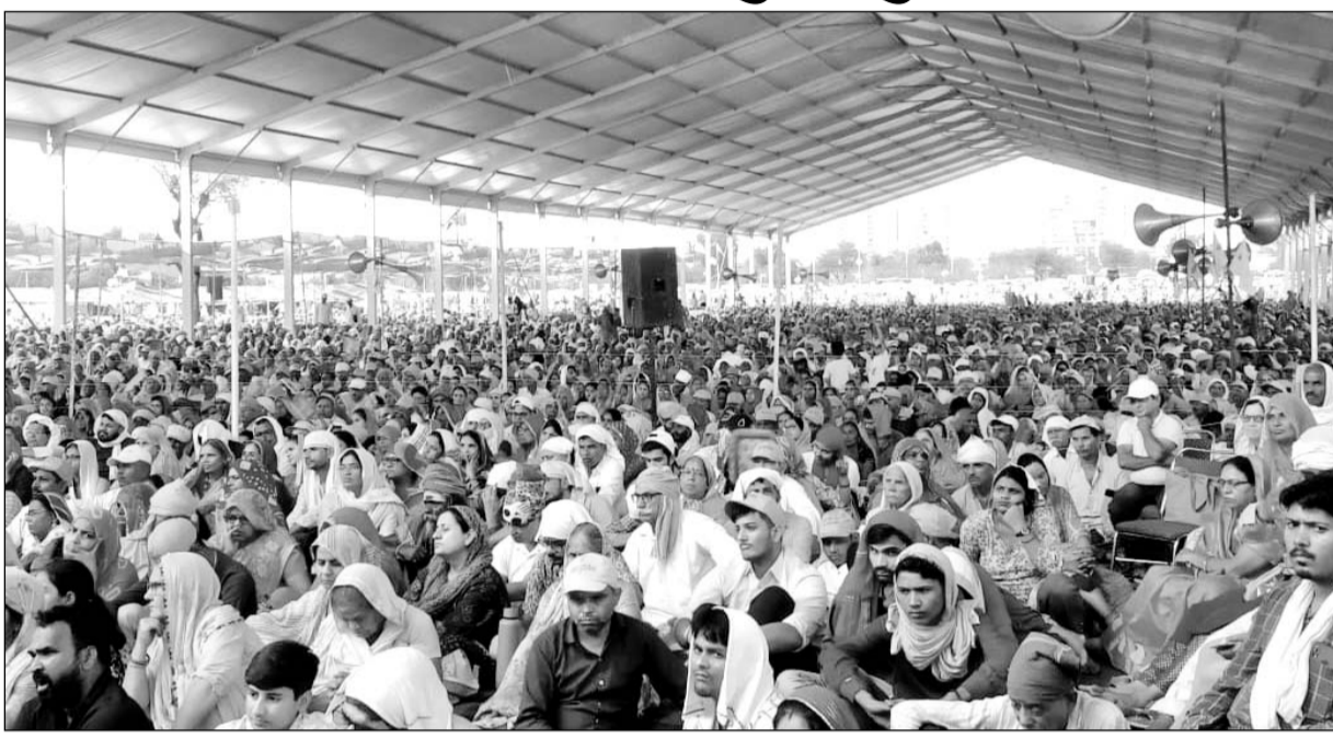
जयपुर के ठीकरी स्थित जयगुरुदेव आश्रम में चल रहे गुरु पूर्णिमा के आध्यात्मिक समागम में देश-विदेश से भक्तों का जन सैलाब उमड़ा।