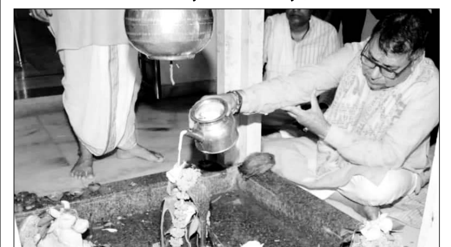
गुरु पूर्णिमा के पावन अवसर पर राजस्थान विधानसभा उपनेता प्रतिपक्ष एवं भाजपा के पूर्व प्रदेशाध्यक्ष डॉ. सतीश पूनिया ने जयपुर और आमेर के 21 से अधिक मंदिरों में दर्शन कर संतों से आशीर्वाद एवं मार्गदर्शन लिया। इस दौरान उन्होंने प्रदेश की खुशहाली की कामना की।