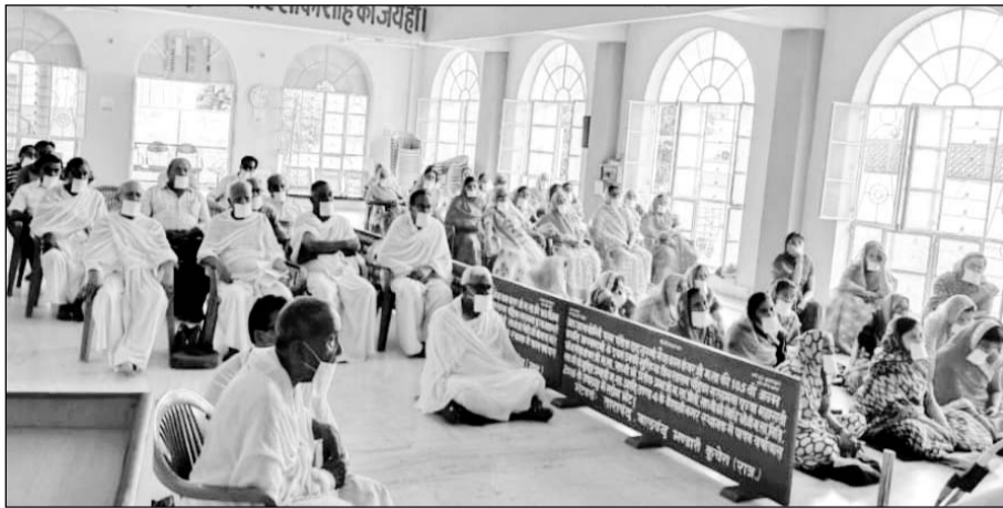
गुरु पूर्णिमा के अवसर पर अजमेर में श्री जैन श्वेताम्बर संस्था पार्श्वनाथ कॉलोनी वैशालीनगर के तत्वावधान में आयोजित धर्म सभा में काफी जने उपस्थित रहे।

अजमेर, (कासं)। हमारे जीवन में चाहे कितनी भी सफलताएं व खुशियां आ जाए लेकिन जब तक गुरु का आशीर्वाद हमें प्राप्त नहीं होगा तब तक वह अधूरी है। गुरु ही है जो हमें जीवन में सफलता की राह पर आगे बढ़ाता है। गुरु के आशीर्वाद से बड़ी इस जग में कोई पूंजी नहीं हो सकती। जिससे गुरु का आशीर्वाद मिल जाए वह शिष्य भाग्यशाली होता है। ये विचार सोमवार को गुरु पूर्णिमा के अवसर पर अजमेर में श्री जैन श्वेताम्बर संस्था पार्श्वनाथ