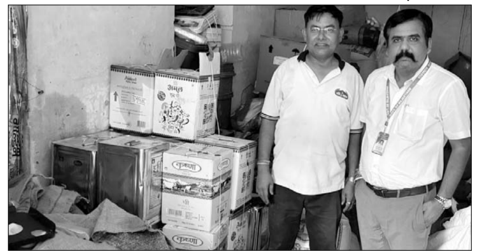
पाली शहर में डेयरी एंड जनरल स्टोर पर घी के नमूने लिये।