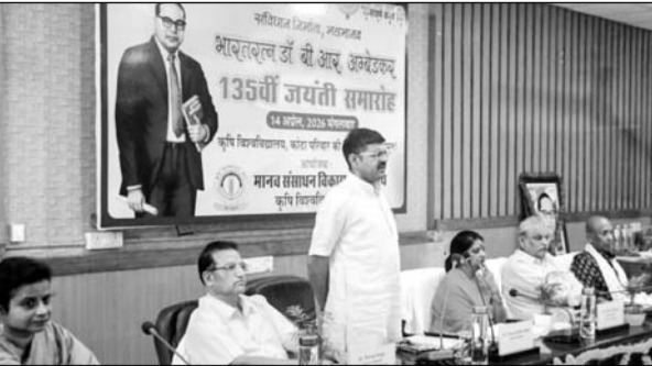
कोटा कृषि विश्वविद्यालय में डॉ. आंबेडकर की 135वीं जयंती पर कार्यक्रम आयोजित किया गया।