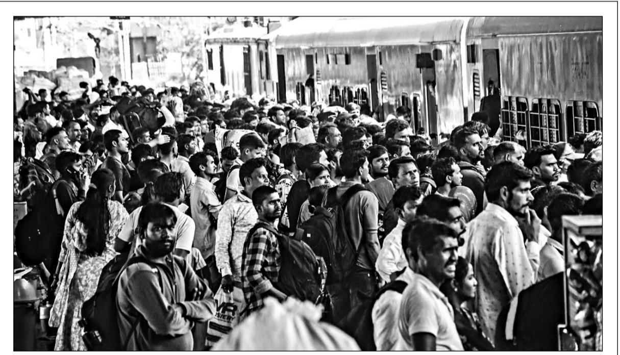
पश्चिमी बंगाल में इसी माह होने वाले चुनाव को देखते हुए जयपुर में रह रहे लोग वापस अपने प्रदेश लौटने लगे हैं। मंगलवार को जयपुर रेलवे स्टेशन पर यात्रियों की भारी भीड़ रही। हालात ऐसे थे कि ट्रेनों में सीटें मिलना तो दूर प्लेटफॉर्म पर खड़े होने की भी जगह नहीं थी।

है, जो हरियाणा और पंजाब के निवासी हैं। पुलिस आरोपियों के कब्जे से 29.850 किलो अवैध डोडा चूरा बरामद किया है। पुलिस ने बताया कि आरोपियों के नेटवर्क और अन्य संभावित साधियों के संबंध में जांच जारी है। साथ ही आमजन से अपील की गई है कि नशे के खिलाफ इस मुहिम में सहयोग करें और अवैध गतिविधियों की सूचना तुरंत पुलिस को दें।