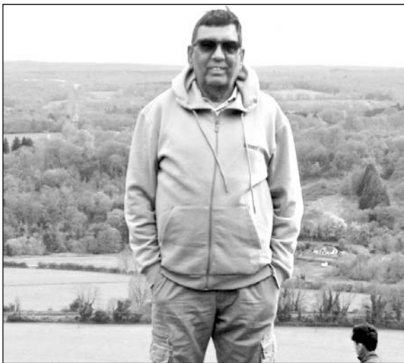
किलोमीटर लंबा है और इसमें लगभग 230 मीटर की ऊंचाई है, और इसे

पसंदीदा जगहों में से एक है। यह हाइकिंग, साइकिलिंग या बस कुछ घंटों के लिए ताज़ी हवा और शानदार नज़ारों के लिए शहर से बाहर घूमने के लिए एकदम सही है। शानदार वॉक और शानदार नज़ारों के लिए बॉक्स हिल प्रसिद्ध है। बॉक्स हिल, लंदन के साउथ-वेस्ट में सेरे में है।