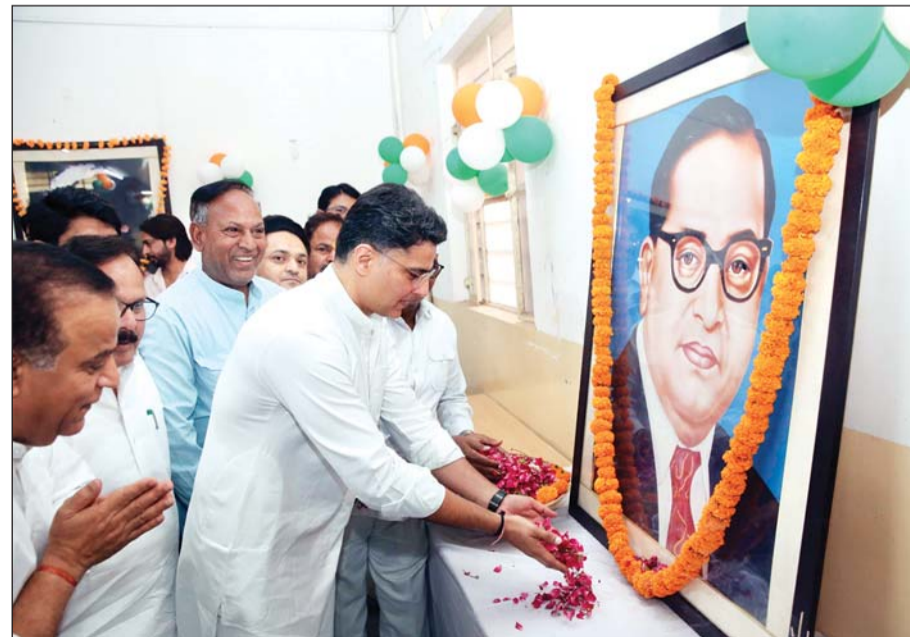
कांग्रेस के राष्ट्रीय महासचिव एवं पूर्व उपमुख्यमंत्री सचिन पायलट ने मंगलवार को प्रदेश कांग्रेस मुख्यालय में बाबा साहेब की जयंती पर आयोजित पुष्पांजलि कार्यक्रम में शामिल हुए।

और जनगणना जैसे मुद्दों पर पारदर्शिता बनाए रखने के लिए सर्वदलीय बैठक बुलाई जानी चाहिए।