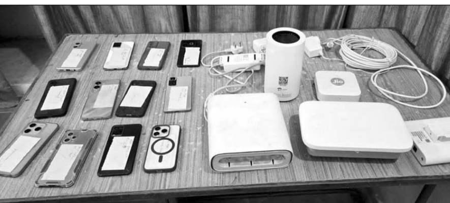
पुलिस ने आरोपियों के कब्जे से 12 मोबाइल फोन और 17 फर्जी सिम कार्ड बरामद किये।

डूंगरपुर, (निर्स)। जिला पुलिस ने सायबर अपराधियों के खिलाफ चलाए जा रहे विशेष अभियान ऑपरेशन सायबर हंट के तहत कार्यवाही करते पुलिस ने 6 सायबर ठगों को गिरफ्तार किया है। आरोपियों के कब्जे से पुलिस ने 12 मोबाइल फोन और 17 फर्जी सिम