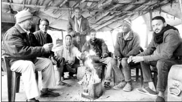
अजमेर में शीतलहर के कारण लोग अलाव तापते नजर आये।

अजमेर, (कास)। पश्चिम विश्वो भी और पहाड़ों पर हुई बर्फबारी व प्रदेश के जिलों में हुई पहली मवात की बारिश के चलते मौसम ने करवट बदली है। मवात और ठंडी हवाओं के चलते घने कोहरे व तापमान में गिरावट के चलते शीतलहर ने लोगों को धुंजणी छुड़ा दी है।