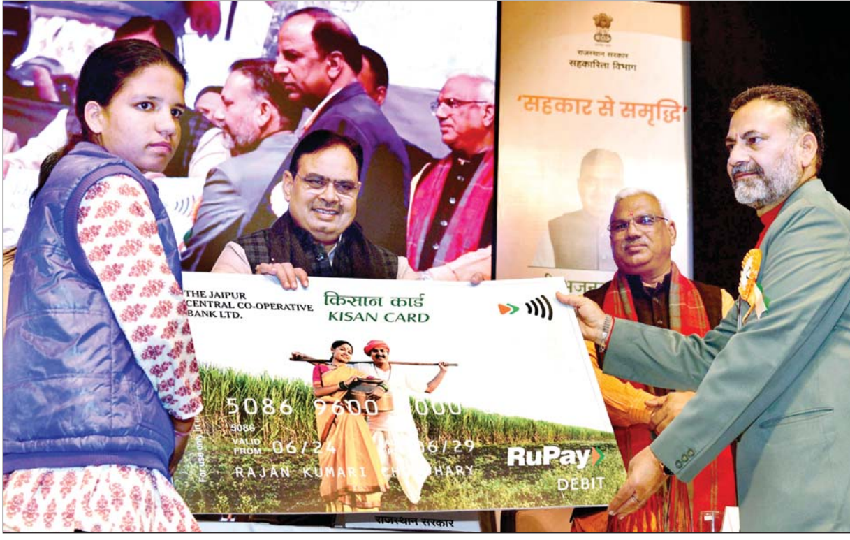
केन्द्रीय सहकारिता मंत्री अमित शाह के "सहकार से समृद्धि" कार्यक्रम में मुख्यमंत्री भजनलाल शर्मा वीडियो कॉन्फ्रेंस के माध्यम से जुड़े। इस अवसर पर किसानों को ऋण उपलब्धता में सुगमता के लिए किसान क्रेडिट कार्ड का नवाचार किया गया।