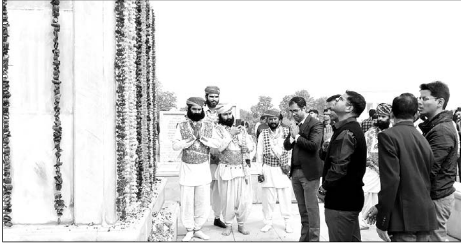
महाराजा सूरजमल के 261 वें बलिदान दिवस पर अधिकारियों ने पुष्पाजलि अर्पित की।

साथ शहर के प्रमुख मार्गों से होकर निकाली गई शौर्य यात्रा से भरतपुर की लोक संस्कृति जीवंत हो उठी। महाराजा सूरजमल चौराहे से किला स्थित किशोरी महल तक जिला प्रशासन एवं पर्यटन विभाग द्वारा भव्य यात्रा का आयोजन किया गया जिसमें बड़ी संख्या में स्थानीय नागरिकों, सामाजिक संगठनों, लोक कलाकारों ने भाग लिया, शौर्य यात्रा का स्थानीय