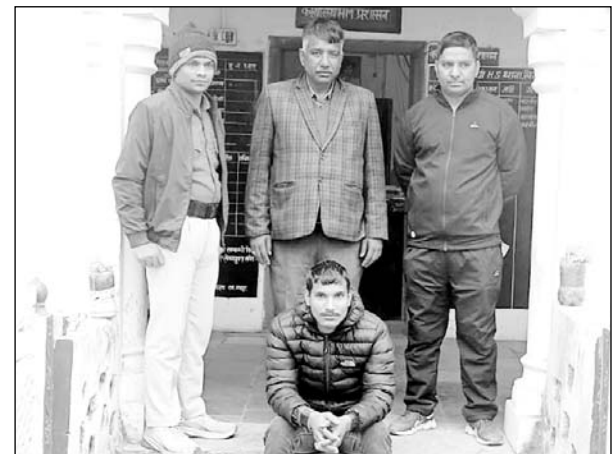
पुलिस ने हत्या के मामले में आरोपी को गिरफ्तार किया।

■ आरोपी ने दो साल पहले बिहार के जमुई में वारदात की थी