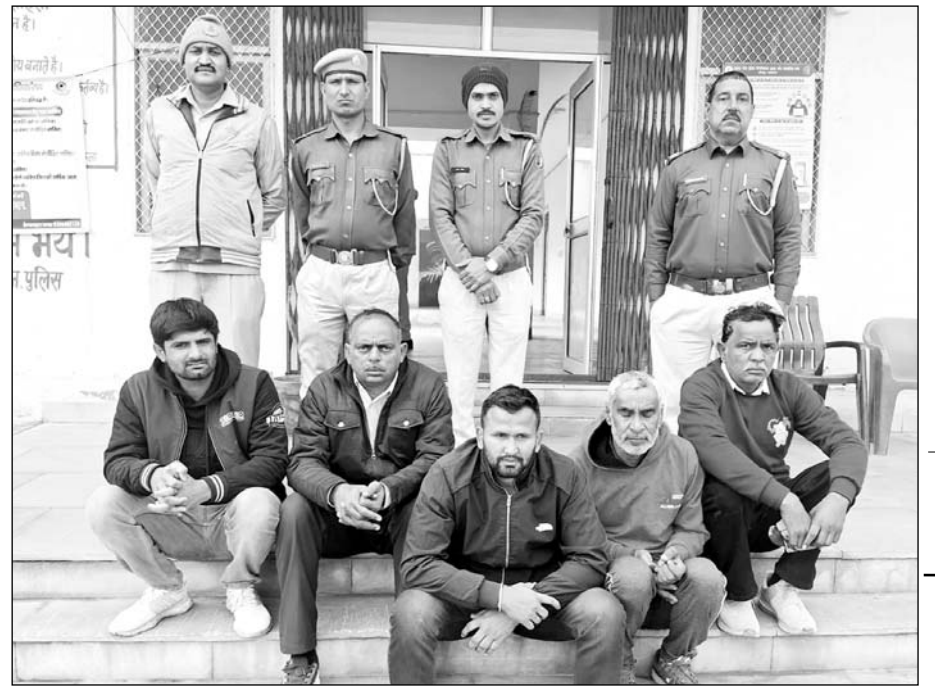
परिवार पर जानलेवा हमला करने के आरोपियों को पुलिस ने गिरफ्तार किया।