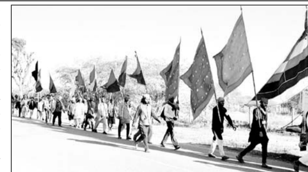
विभिन्न राज्यों से छड़ियां लेकर अजमेर दरगाह पहुंचे मलंग।