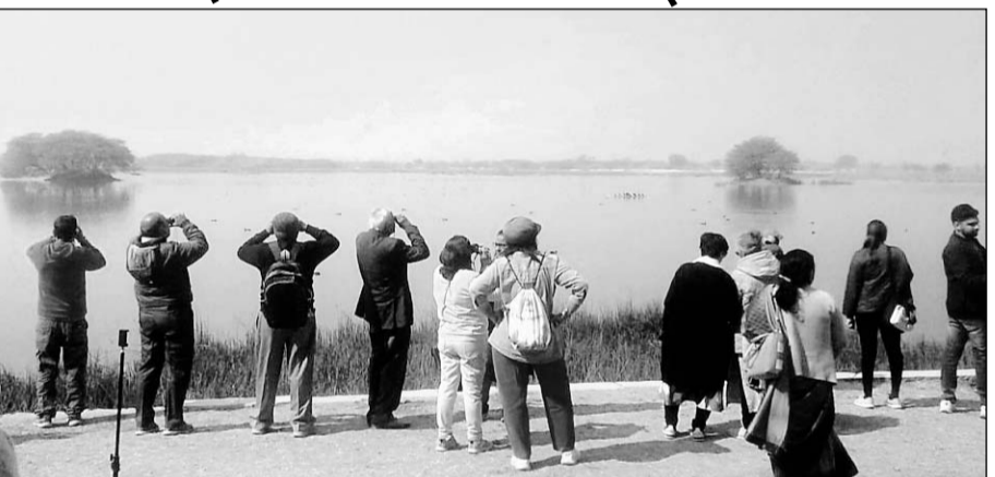
उदयपुर में बर्ड फेस्टिवल के दूसरे दिन शनिवार को विविध जलाशयों पर बर्ड वॉचिंग करते पक्षी प्रेमी।

राजसमंद व गुडला, चौथे रूट पर उदयपुर, मंगलवाड़, नागवली, व बल्लभनगर तथा पांचवें रूट पर उदयपुर, डिन्धोली व भोपालसागर जलाशयों पर बर्ड वॉचिंग की गई। चित्तौड़ ने बताया कि 22 जनवरी को समस्त दल प्रतिनिधि ओ.टी.सी. में