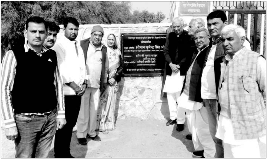
जिले के निकटवर्ती ग्राम पंचायत प्रतापपुरा में अनेकों विकास कार्यों का लोकार्पण किया गया।