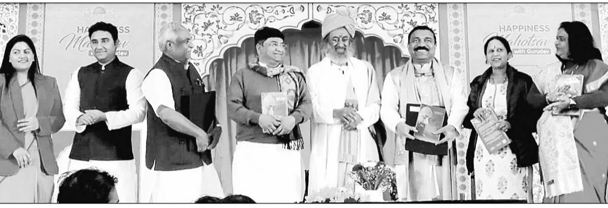
प्रसिद्ध वैश्विक आध्यात्मिक गुरु और मानवतावादी, गुरुदेव श्री श्री रविशंकर ने वर्षों के बाद जयपुर शहर का दौरा किया। अपनी बहुप्रतीक्षित यात्रा के दौरान गुरुदेव ने 3000 से अधिक प्रतिभागियों की उपस्थिति वाले एसएमएस इनडोर स्टेडियम, जयपुर में हैप्पीनेस महोत्सव के प्रतिभागियों को संबोधित किया।

जयपुर, (का.सं.)। प्रसिद्ध वैश्विक आध्यात्मिक गुरु और मानवतावादी, गुरुदेव श्री श्री रविशंकर ने वर्षों के बाद जयपुर शहर का दौरा किया। अपनी बहुप्रतीक्षित यात्रा के दौरान गुरुदेव ने 3000 से अधिक प्रतिभागियों की उपस्थिति वाले विशाल एसएमएस इनडोर स्टेडियम, जयपुर में हैप्पीनेस महोत्सव के प्रतिभागियों को संबोधित किया। प्रतिभागियों को संबोधित करते हुए गुरुदेव ने कहा, "जीवन में मौन का अपना महत्व होता है। थोड़ी-थोड़ी देर हम मौन का अभ्यास करें तो हमारे भीतर ऊर्जा रहेगी। आपको पता है कि इंडोनेशिया के बाली शहर में साल में 1 दिन मौन होता है। उस दिन पूरा शहर मौन हो जाता है, ना कोई गाड़ी चलाता है और ना ही कुछ