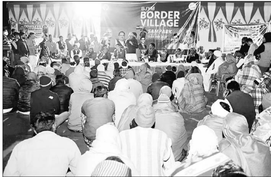
भाजपा प्रदेश अध्यक्ष डॉ. सतीश पूनियां ने वाईब्रेंट बॉर्डर विलेज कार्यक्रम में बीकानेर जिले के खाजूवाला विधानसभा क्षेत्र के कालूवाला गांव में लोगों से केन्द्र की मोदी सरकार की कल्याणकारी योजनाओं को लेकर संवाद किया।

जयपुर/बीकानेर। प्रधानमंत्री नरेंद्र मोदी के आह्वान पर देशभर में सभी वर्गों को जोड़ने के क्रम में भाजपा प्रदेश अध्यक्ष डॉ. सतीश पूनियां ने वाईब्रेंट बॉर्डर विलेज यानि जीवंत सीमांत ग्राम कार्यक्रम के तहत सीमावर्ती गांवों में आमजन से संवाद के क्रम में बीकानेर जिले के खाजूवाला विधानसभा क्षेत्र के कालूवाला गांव में रात्रि प्रवास कर आज रात बिता रहे हैं, जहां लोगों से केन्द्र की मोदी सरकार की कल्याणकारी योजनाओं को लेकर संवाद किया और संस्कृति पर भी विस्तृत चर्चा की।