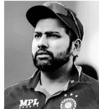
के बाद भारत के 113 पॉइंट्स हो गए हैं। पहले नंबर-1 पर काबिज न्यूजीलैंड के 2

नई दिल्ली, 21 जनवरी। टीम इंडिया ने रायपुर में खेले गए मुकाबले में न्यूजीलैंड को 8 विकेट से हरा दिया। इसके साथ ही भारतीय टीम ने 3 मैचों की सीरीज में 2-0 की अजेय बढ़त हासिल कर ली है। भारत अब वनडे रैंकिंग में नंबर-1 होने की भी बेहद करीब आ गया। रैंकिंग में अब रोहित एंड कंपनी के 113 पॉइंट्स हो गए और वह एक पायदान की छलांग के साथ तीसरे नंबर पर पहुंच गई है। अगर टीम इंडिया सीरीज का तीसरा मैच भी जीत लेती है तो वह नंबर-1 पर काबिज हो जाएगी। यह कैसे होगा आगे समझते हैं।