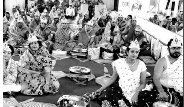
ढड्डा चौक के प्रवचन पंडाल में सामूहिक मंत्रोच्चारण व भक्ति गीतों के साथ चन्द्र प्रभु लक्ष्मी महापूजन करते श्रद्धालु।

श्री सुगनजी महाराज का उपासरा ट्रस्ट व श्री जिनेश्वर युवक परिषद की ओर से श्रावक-श्राविकाओं को चन्द्रप्रभु लक्ष्मी महापूजन यंत्र प्रदान