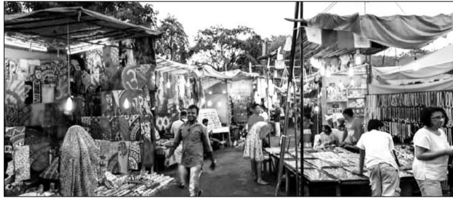
मेले के दौरान सजे पुष्कर के बाजार।