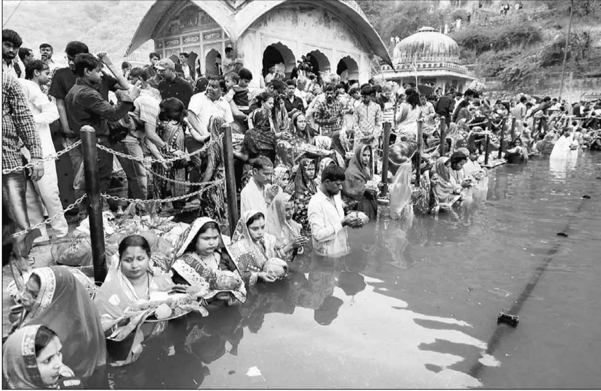
छठ सूर्य उपासना महापर्व के तीसरे दिन गुरुवार को 36 घंटे का व्रत रखे हुए श्रद्धालुओं ने शाम को सूर्यास्त के समय कमर तक पानी में खड़े होकर सूर्य भगवान को अर्घ्य दिया।

जयपुर। उत्तर भारतीयों के चार दिवसीय छठ सूर्य उपासना महापर्व के तीसरे दिन गुरुवार को 36 घंटे का व्रत रखे हुए श्रद्धालुओं ने शाम को सूर्यास्त के समय कमर तक पानी में खड़ी होकर सूर्य भगवान को अर्घ्य दिया। गलताजी, आमेर के सागर, मावठे में शाम होने से पहले ही बड़ी संख्या में व्रती बांस की टोकरी में मौसमी फल, ठेकुआ, कसर, गन्ना और पूजा का सामान लेकर पहुंच गए। सूर्य के अस्तावचल की ओर बढ़ते ही सभी श्रद्धालु कमर तक पानी में खड़े होकर लोक गीत गाते हुए सूर्य भगवान को अर्घ्य दिया।