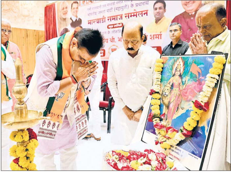
मुख्यमंत्री भजनलाल शर्मा ने महाराष्ट्र के सोलापुर में चुनाव प्रचार के दौरान राजस्थानी समाज के सम्मेलन में भाग लिया और प्रवासी राजस्थानियों से भाजपा को जिताने की अपील की।

आतंकी समर्थकों के मंसूबे से महाराष्ट्र को बचाना जरूरी-भजनलाल शर्मा