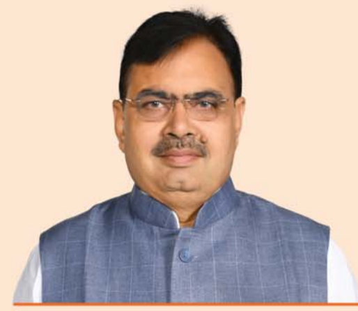
श्री भजनलाल शर्मा माननीय मुख्यमंत्री