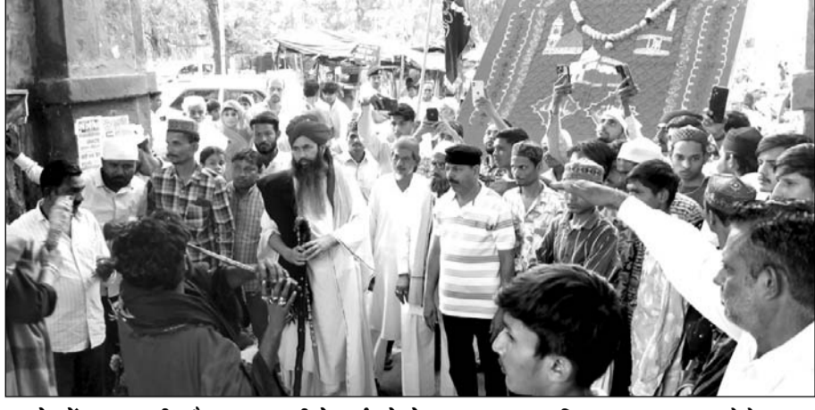
जालोर में हजरत शहीद गैबनशाह गाजी के उर्स को लेकर चादर जुलूस निकाला गया। फोटो-राष्ट्रदूत

जालोर, (कासं)। जालोर शहर स्थित हजरत शहीद गैबनशाह गाजी का सालाना उर्स का आगाज 13 अप्रैल को चादर जुलूस के साथ हुआ। वहीं रात्रि में मिलाद शरीफ व 14 अप्रैल को कव्वाली का कार्यक्रम होगा। वहीं 12 अप्रैल रात्रि को शहीद ख्वाजा मीरा मलिक शाह दातार के उर्स अकीदत के साथ मनाया गया।