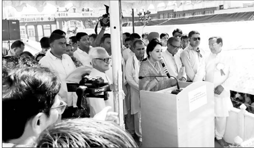
उप मुख्यमंत्री दिया कुमारी ने रथयात्रा में आयोजित कार्यक्रम को संबोधित किया।