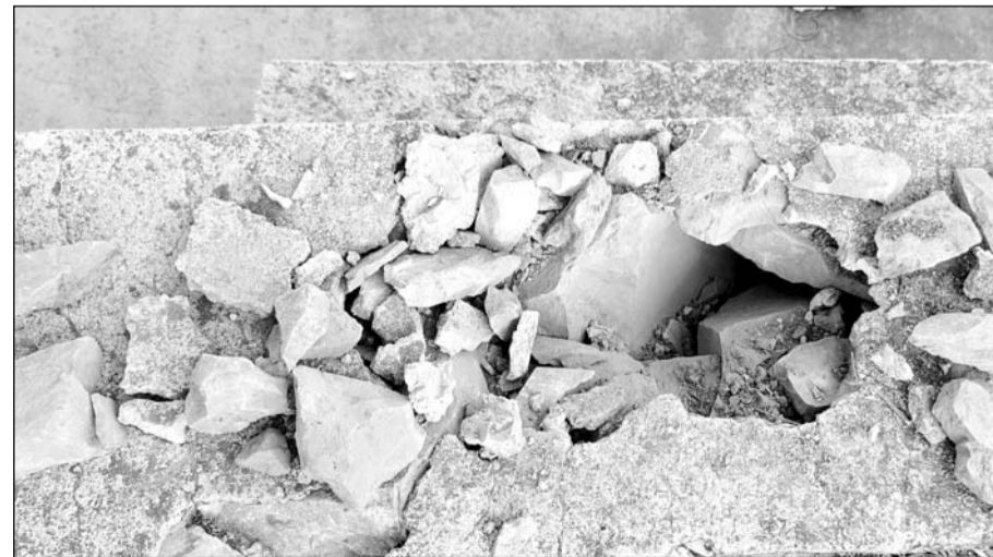
मनोहरपुर में आकाशीय बिजली गिरने से मकान क्षतिग्रस्त हो गया।