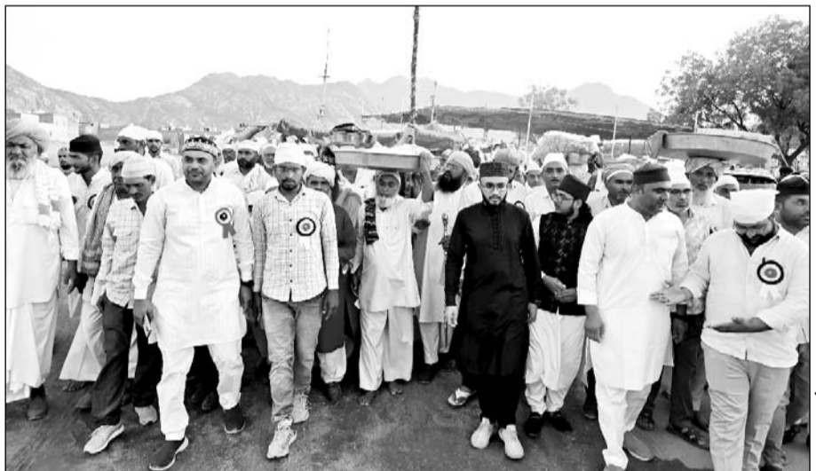
जालोर में हजरत पीर मखदूम मियां मोटन शाह रहमतुल्लाह अलैह बारला तकिया के सालाना उर्स में बड़ी संख्या में अकीदतमंदों ने भाग लिया।

जालोर, (कासं)। जालोर में शनिवार रात्रि को अराकिन ए दरगाह युवा कमेटी मोयला समाज 14 पेटटी जालोर के तत्वावधान में हजरत पीर मखदूम मियां मोटन शाह रहमतुल्लाह अलैह बारला तकिया का सालाना बड़ी शानो शौकत के साथ मनाया गया। उर्स में काफी अकीदतमंदों ने भाग लिया।