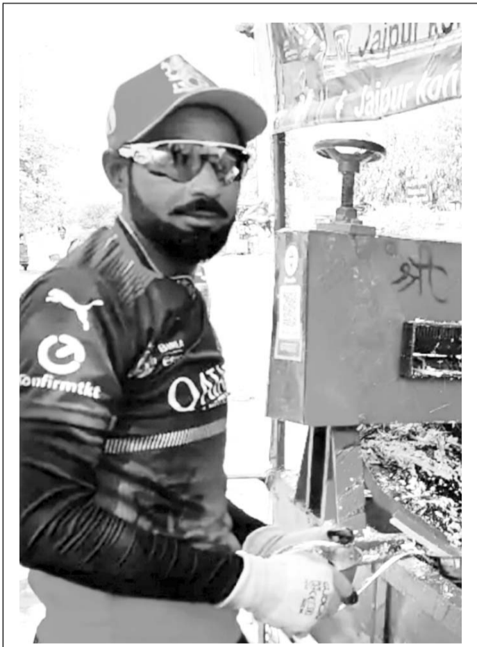
एसएमएस स्टेडियम के बाहर विराट कोहली का एक फैन उनके गेटअप में गत्रे का जूस बेचता नजर आया।