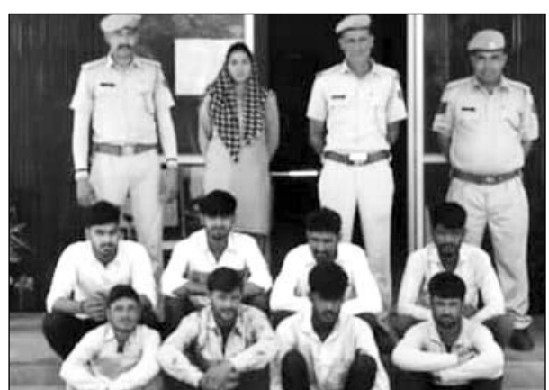
चोरी व नकबजनी के आरोप में आठ जनों को गिरफ्तार किया।