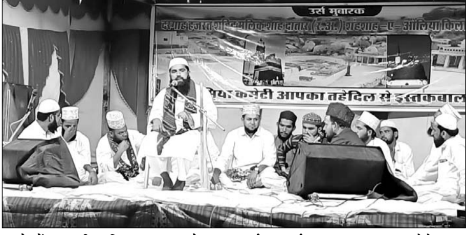
जालोर में हजरत मीरा मलिक शाह दरगाह के सालाना उर्स का कार्यक्रम हुआ।