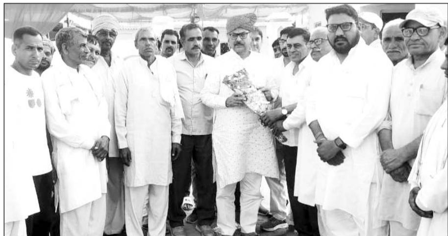
गांव बेवड में भाजपा के पूर्व प्रदेश अध्यक्ष एवं हरियाणा प्रभारी डॉ. सतीश पूनिया का स्वागत किया गया।