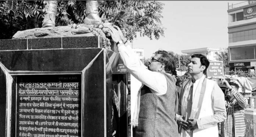
परमवीर चक्र विजेता पीरु सिंह को पुष्प अर्पित करते डॉ. पुनिया।