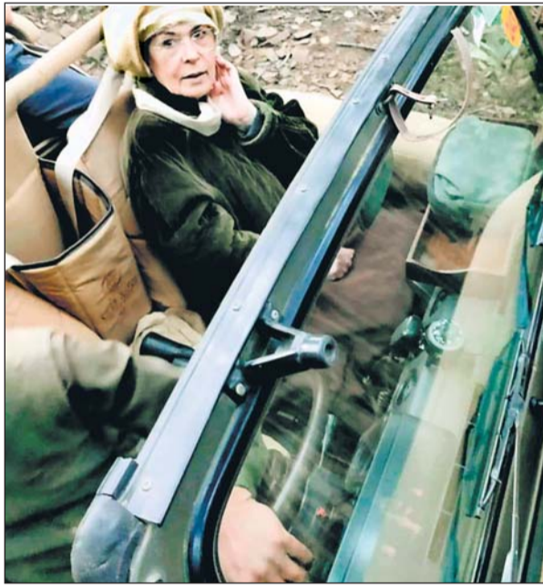
सोनिया गांधी अपना 76वां जन्म दिन मनाते 37 साल बाद अपने बच्चों प्रियंका गांधी और राहुल गांधी के साथ रणथम्भौर आईं। सोनिया गांधी 1985 में अपने पति राजीव गांधी के साथ रणथम्भौर घूमने आई थीं।

गांधी के साथ न्यू इयर सेलिब्रेट करने के लिए रणथम्भौर आई थीं। उस समय उनके साथ उनके परिवारिक मित्र अमिताभ बच्चन भी थे। करीब 37 साल बाद सोनिया गांधी अपने बच्चों प्रियंका गांधी और राहुल गांधी के साथ रणथम्भौर आई हैं, जहां उनका जन्मदिन मनाया गया। सोनिया,