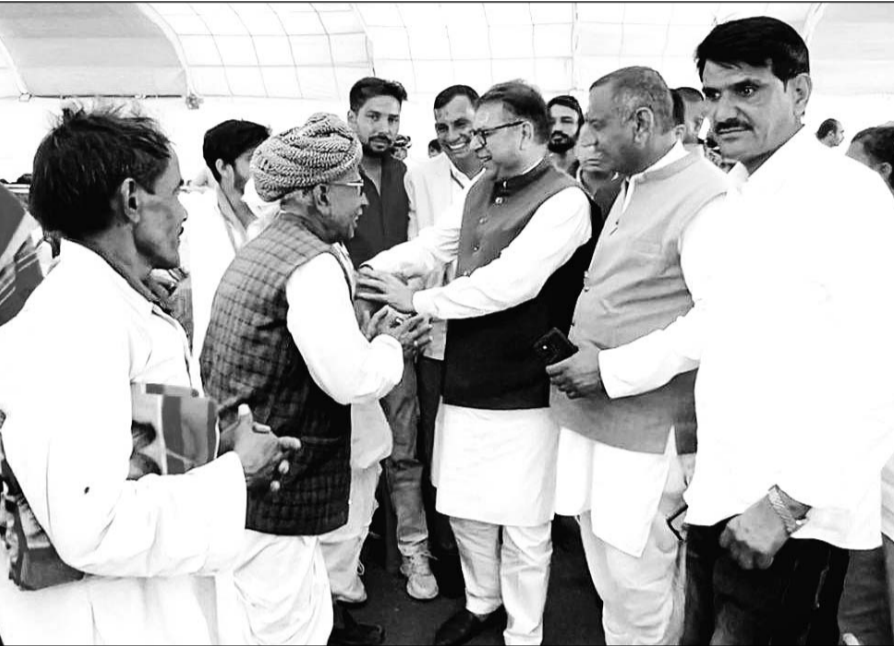
अखिल मेवाड़ क्षेत्र जाट समाज महासभा संस्थान द्वारा चित्तौड़गढ़ के मातृकुण्डिया में नवनिर्मित श्री पशुपतिनाथ महादेवजी मंदिर के प्राण प्रतिष्ठा कार्यक्रम में भाजपा हरियाणा प्रभारी, भाजपा राजस्थान पूर्व प्रदेशाध्यक्ष डॉ. सतीश पूनिया शामिल हुए।

जयपुर। अखिल मेवाड़ क्षेत्र जाट समाज महासभा संस्थान द्वारा चित्तौड़गढ़ के मातृकुण्डिया में नवनिर्मित श्री पशुपतिनाथ महादेवजी मंदिर के प्राण प्रतिष्ठा कार्यक्रम में भाजपा हरियाणा प्रभारी, भाजपा राजस्थान पूर्व