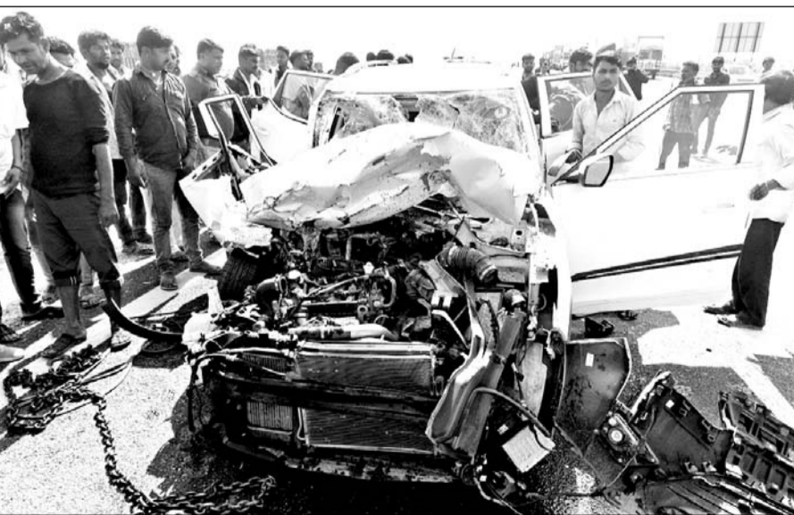
हादसे में कार के आगे का हिस्सा क्षतिग्रस्त हो गया।

घायलों को बॉली चिकित्सालय में प्राथमिक उपचार के बाद जयपुर रेफर किया