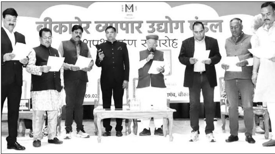
बीकानेर व्यापार उद्योग मंडल की नवनिर्वाचित कार्यकारिणी को केन्द्रीय कानून मंत्री अर्जुनराम मेघवाल ने शपथ दिलाई।

मेघवाल ने कहा कि भारत की जीडीपी दुनिया में तीसरे नंबर पहुंचेगी तो विकास को पंख लग जायेगा। उन्होंने कहा कि हवाई सेवा के विकास के लिए एयरपोर्ट की भूमि अधिग्रहित होते ही यहां भव्य ग्रीन टर्मिनल बिल्डिंग बनाई जायेगी। टर्मिनल बनते ही बड़े शहरों से एयर कनेक्टिविटी की सुविधा प्रारंभ हो जायेगी। उन्होंने कहा कि कोलकाता गुवाहाटी रूट का सर्वे इंडिया द्वारा किया जा रहा है। मेघवाल ने कहा कि बीकानेर