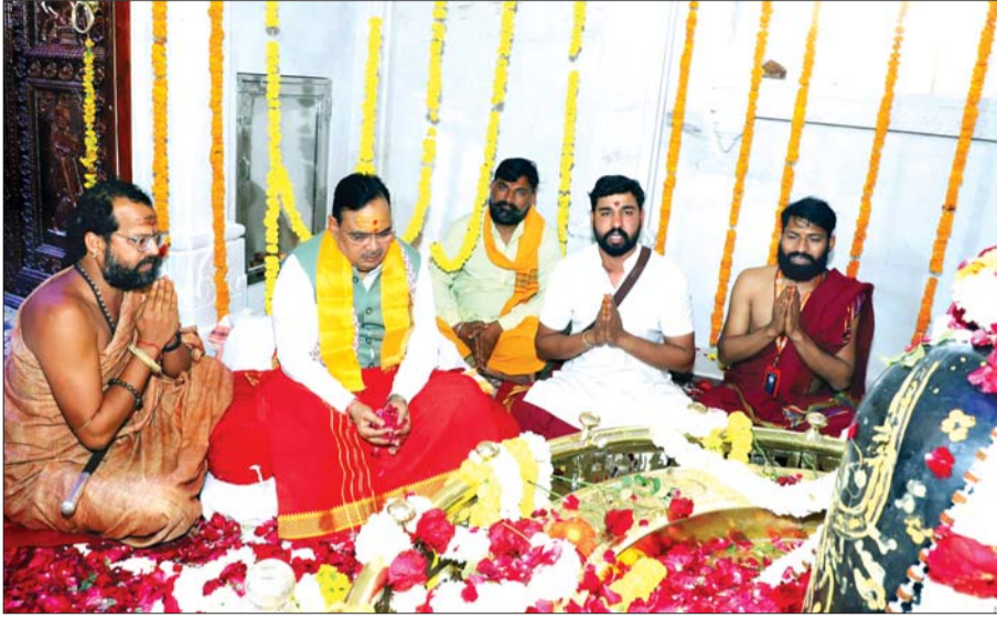
मुख्यमंत्री भजनलाल शर्मा ने चित्तौड़गढ़ के मातृकुंडिया के श्री पशुपतिनाथ महादेव मंदिर मूर्ति प्राण प्रतिष्ठा समारोह को संबोधित किया तथा मंदिर में पूजा-अर्चना की।