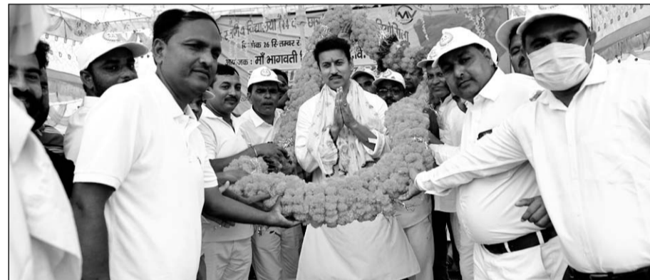
समारोह के दौरान कैबिनेट मंत्री कर्नल राज्यवर्धन सिंह राठौड़ का माला पहनाकर स्वागत किया।

जयपुर। मां भगवती विद्यापीठ उच्च माध्यमिक विद्यालय, तसीमी (धौलपुर) में आयोजित 14 वर्ष आयु वर्ग की राज्य स्तरीय विद्यालयी फुटबॉल प्रतियोगिता सत्र 2024-25 का उद्घाटन कैबिनेट मंत्री एवं झोटावाड़ा विधायक कर्नल राज्यवर्धन सिंह राठौड़ ने किया। इस आयोजन में राज्यभर से आए सैकड़ों युवा प्रतिभागियों ने भाग लिया और अपनी फुटबॉल कौशल का प्रदर्शन किया।