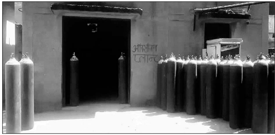
कोटा के अस्पतालों में ऑक्सीजन प्लांट बंद होने के चलते सिलेंडर के जरिए काम चलाना पड़ रहा है।

अस्पतालों में स्थापित किए गए ऑक्सीजन प्लांट लगाने पर करोड़ों रुपए का खर्च हुआ है। पीएम केयर फंड के अलावा राज्य सरकार ने भी पैसा लगाया था। स्थाई रूप से इनका उपयोग किए जाने पर लाखों रुपए महिने की बचत की जा सकती है लेकिन इनका रूटीन मेंटेनेंस भी नहीं हुआ। इसी के चलते अधिकांश प्लांट बंद हैं। कुछ तो गारंटी में ही बंद हो गए जिनको लगाने वाली कंपनी ने दुरुस्त नहीं किया है। मेडिकल कॉलेज के नए अस्पताल में पांच प्लांट हैं। इनमें एक लिक्विड ऑक्सीजन का 20 हजार लीटर का प्लांट है। यह