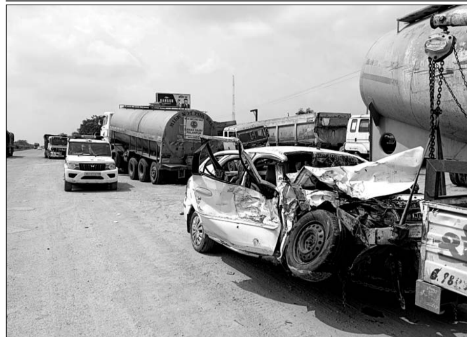
अचानक गलत दिशा से आए टैंकर की टक्कर से कार के परखच्चे उड़ गए।

कार चालक सहित परिवार में से पिता, पुत्री व पुत्र की मौत हो गई