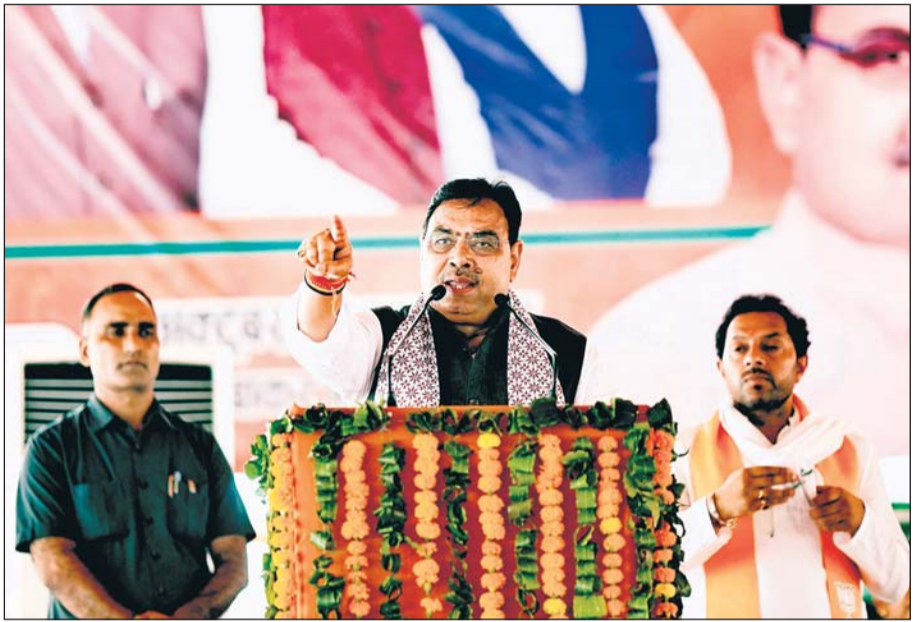
मुख्यमंत्री भजनलाल शर्मा ने हरियाणा विधानसभा चुनाव प्रचार के दौरान समालखा, सोनीपत व करनाल में चुनावी सभाएं कीं।

उन्होंने राहुल गांधी से पूछा, “देश के विरोधी लोगों के साथ अपना रिश्ता बताएं”