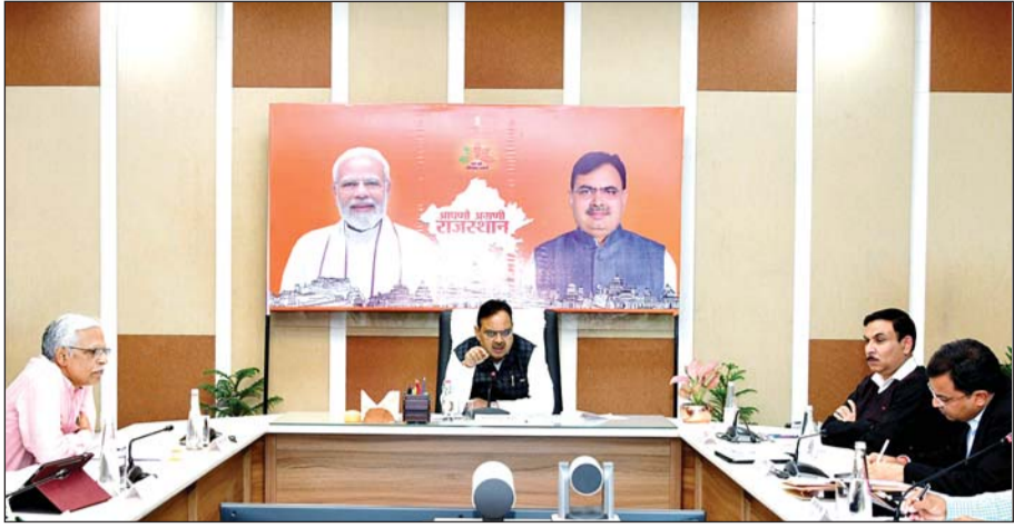
मुख्यमंत्री भजनलाल शर्मा ने राइजिंग राजस्थान ग्लोबल इन्वेस्टमेंट समिट के तहत हुए एम.ओ.यू. के क्रियान्वयन की समीक्षा की। उन्होंने एम.ओ.यू. के क्रियान्वयन के लिए त्रैमासिक लक्ष्य निर्धारित करने के निर्देश दिये।