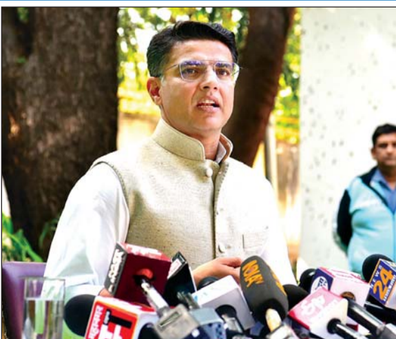
कांग्रेस महासचिव सचिन पायलट ने जयपुर में अपने आवास पर राजस्थान में फोन टैपिंग के मुद्दे पर मीडिया से वार्ता की।

■ उन्होंने कहा कि नये एमओयू में राजस्थान को पहले से कम पानी मिल रहा है। सरकार को विधानसभा में इस पर जवाब देना चाहिये।