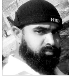
रलावता-खंडेला टोल में हुये सड़क हादसे में पति-पत्नी की मौत हो गई।