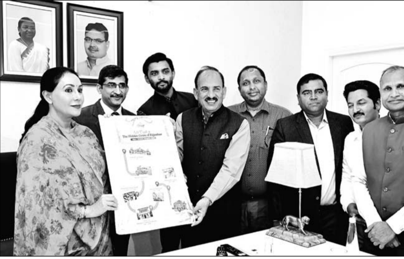
उप मुख्यमंत्री दीया कुमारी ने होटल एवं रेस्टोरेंट एसोसिएशन राजस्थान के प्रतिनिधियों के साथ जयपुर-आभानेरी-भानगढ़-जयपुर यात्रा के पोस्टर का विमोचन किया।