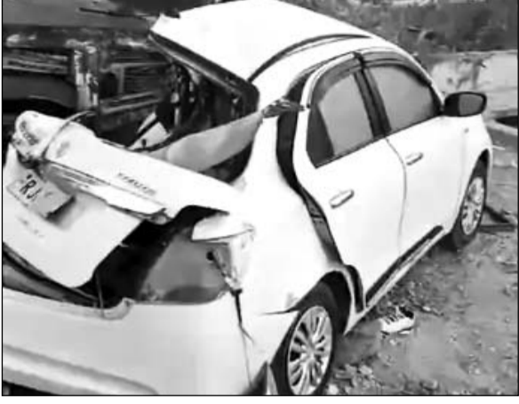
सड़क दुर्घटना में कार बुरी तरह से क्षतिग्रस्त हो गई।

■ बेकाबू होकर सड़क किनारे खड़े कबाड़ से भरे ट्रॉले से टकरा गई कार