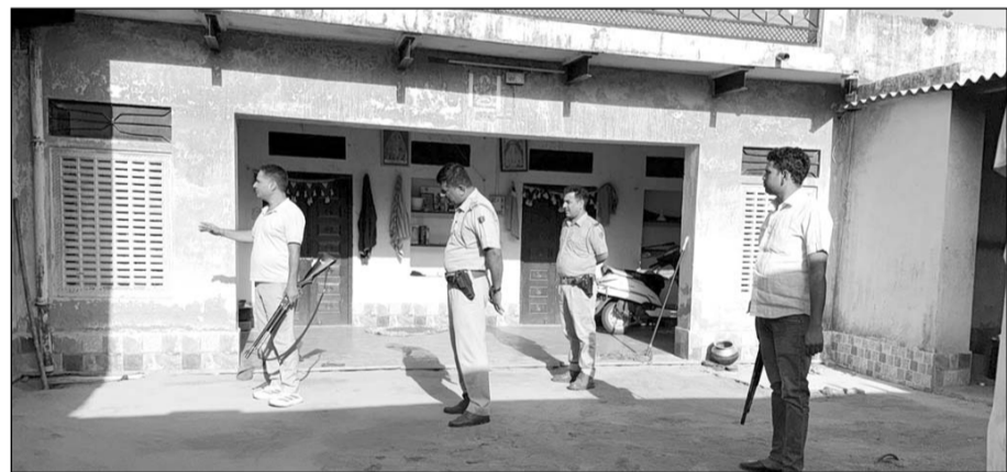
झुंझुनूं जिले में गठित पुलिस की 60 टीमों ने 436 ठिकानों पर दबिशा देकर कार्रवाई की।