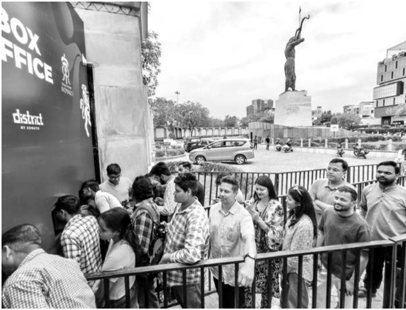
जयपुर में 25 अप्रैल को एसएमएस स्टेडियम में खेले जाने वाले आईपीएल मैच की टिकटों की बिक्री शुरू हो गई है। जिसके चलते स्टेडियम के बाहर टिकटों के लिये लगी दर्शकों की लंबी लाईन।

क्या आप जानते हैं?... महेंद्र सिंह धोनी ने अपने करियर में 195 स्ट्रॉकिंग की हैं, जो एक विश्व रिकॉर्ड है।