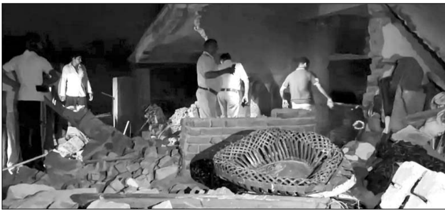
घटना के बाद पुलिस मौके पर पहुंची और जानकारी ली।

झुंझुनूं, (निसं)। झुंझुनूं जिले के चंवर-किशोरपुरा मोरंडा मार्ग पर शनिवार शाम एक भयावह हादसे ने पूरे इलाके को झकझोर कर रख दिया। शाम करीब 7:20 बजे गैस सिलेंडर में आग लगने के बाद हुए जोरदार धमाके से एक पक्का मकान पलभर में जमींदोज हो गया। हादसे में 14 मवेशियों की दर्दनाक मौत हो गई, वहीं परिवार के सदस्य समय रहते बाहर निकल जाने से एक बड़ा जनहानि टल गई।