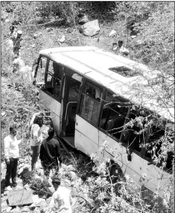
हादसे के बाद मौके पर पहुंचे लोगों ने घायलों को बाहर निकाला।

घायलों को तत्काल अजमेर के जवाहरलाल नेहरू चिकित्सालय (जेएलएन) में भर्ती कराया गया, जहां उनका इलाज जारी है। कुछ घायलों को पहले पुष्कर में प्राथमिक उपचार देने के बाद उनकी गंभीर स्थिति को देखते हुए जेएलएन अस्पताल रेफर किया गया। घटना की सूचना मिलते ही जिला कलेक्टर लोक बंधु, पुलिस अधीक्षक हर्षवर्धन अग्रवाला,