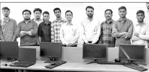
डेटा विजुअलाइजेशन यूजिंग एक्सेल एंड पावर बीआई विषय पर एक दिवसीय कार्यशाला का आयोजन हुआ।