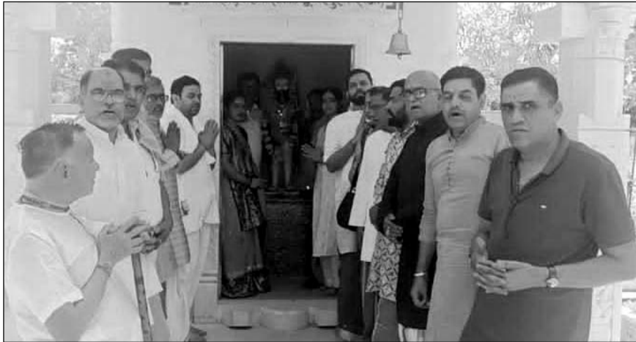
श्रद्धालुओं ने परशुराम जयंती धूमधाम से मनाई।

यह जयंती केवल शहर तक सीमित नहीं रही, बल्कि जिले के वसी, ओडवाडिया, पुनाली, नवलश्याम, थाणा, आसपुर और सांगवाड़ा सहित कई गांवों में भी उत्साहपूर्वक मनाई गई। विभिन्न स्थानों पर भगवान परशुरामजी की मूर्तियों का जलाभिषेक एवं दुर्गाभिषेक किया गया। श्रद्धालुओं ने फूल-मालाएं अर्पित कर पूजा की और भगवान के जयकारे लगाते हुए अनेक