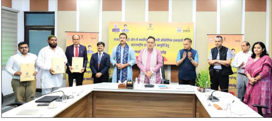
मुख्यमंत्री भजनलाल शर्मा की उपस्थिति में रविवार को बालोतरा स्थित राजस्थान पेट्रो जॉन में डाउनस्ट्रीम उत्पादों की आपूर्ति सुनिश्चित करने के लिए एचपीसीएल रिफाइनरी, उद्योग एवं वाणिज्य विभाग तथा उद्योगों के बीच 18 त्रिपक्षीय समझौते हुए।

मुख्यमंत्री की उपस्थिति में एचपीसीएल उद्योग विभाग व उद्योगों के बीच 18 त्रिपक्षीय समझौते हुए