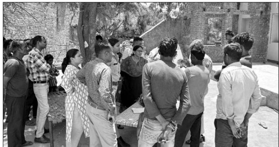
उदयपुर जिले में अक्षय तृतीया पर प्रशासन ने बाल विवाह रुकवाने की कार्रवाई की।

बाल अधिकारों की सुरक्षा के लिए चलाए जा रहे इस अभियान के तहत प्रशासन ने आमजन से अपील की है कि बाल विवाह की सूचना देने पर 1100 रुपये का प्रोत्साहन दिया जाएगा तथा सूचना देने वाले की पहचान गोपनीय