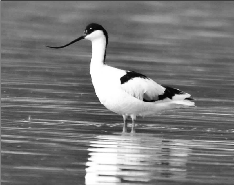
बर्ड फेस्टिवल के दूसरे दिन सांभर झील और नालियासर में मौजूद पक्षी प्रजातियां।