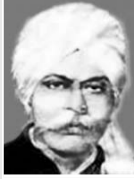
आचार्य किशोरी दास वाजपेयी