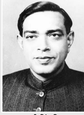
रामधारी सिंह दिनकर