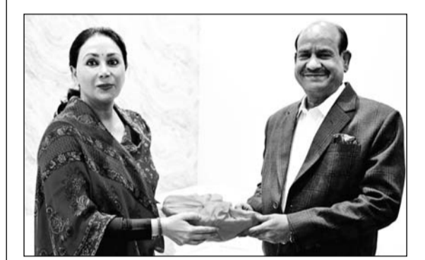
उप मुख्यमंत्री दिया कुमारी ने रविवार को दिल्ली प्रवास के दौरान लोकसभा अध्यक्ष ओम बिरला, केंद्रीय यार्पारण, वन एवं जलवायु परिवर्तन मंत्री भूपेंद्र यादव और केन्द्रीय विधि एवं न्याय तथा संसदीय कार्य राज्य मंत्री अर्जुनराम मेघवाल से शिष्टाचार भेंट की। इस दौरान प्रदेश के विकास से जुड़े विविध विषयों पर चर्चा हुई।