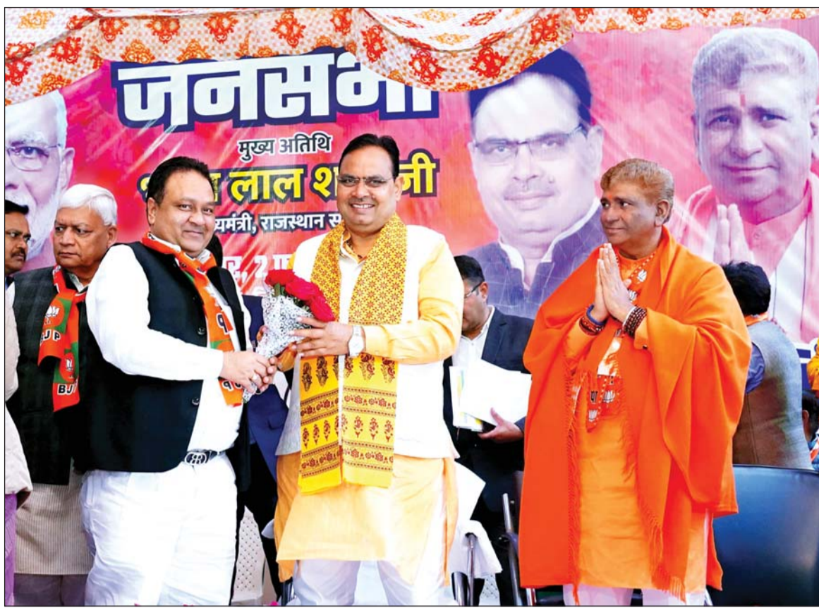
मुख्यमंत्री भजनलाल शर्मा ने दिल्ली में शकूर बस्ती तथा त्रिनगर विधानसभा क्षेत्रों में आयोजित जनसभाओं को संबोधित किया। उन्होंने दिल्ली के प्रदूषण, ट्रैफिक जाम तथा पेयजल संकट जैसे मुद्दों पर आम आदमी पार्टी की सरकार को घेरा।