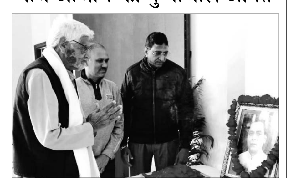
राजस्थान विधानसभा में रविवार को पूर्व अध्यक्ष स्व. निरंजन नाथ आचार्य को उनकी जयन्ती पर पुष्पांजलि अर्पित की गई। स्व. आचार्य 3 मई 1967 से 20 मार्च 1972 तक विधान सभा अध्यक्ष पद पर रहे। पूर्व विधायक नवरंग सिंह, विधानसभा के उप सचिव देवेन्द्र प्रसाद चोटिया सहित अधिकारी, परिवारजन व कर्मचारियों ने पूर्व विधानसभा अध्यक्ष के चित्र पर पुष्पांजलि अर्पित की।