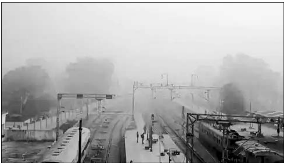
गंगापुर सिटी में रविवार को कोहरा छाने से दृष्टता कम हो गई।

गंगापुर सिटी। एकबार फिर से सर्दी ने अपना रूप दिखाया शुरू कर दिया है। रविवार सुबह से छाप घने कोहरे ने जनजीवन को प्रभावित किया। कोहरे के कारण विजिबिलिटी 30-40 मीटर तक सीमित रही।