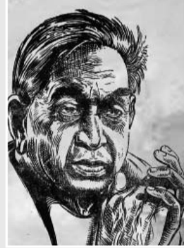
पाण्डेय बेचन शर्मा 'उग्र'