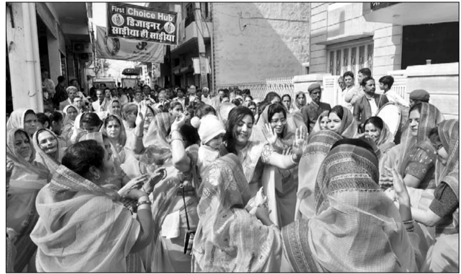
यात्रा का जगह जगह पर भव्य स्वागत किया गया।

विशाल शोभायात्रा गाजे बाजे के साथ नामदेव समाज भवन से निकाली गई जो शहर के मुख्य मार्गों से निकाली गई