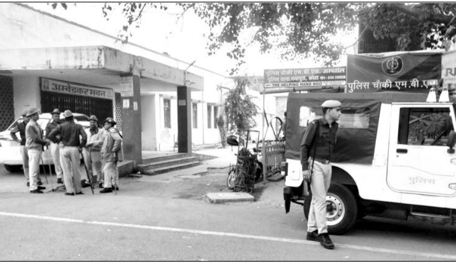
फायरिंग के आरोपी के सुसाइड के बाद अस्पताल परिसर को पुलिस छावनी में तब्दील कर दिया।