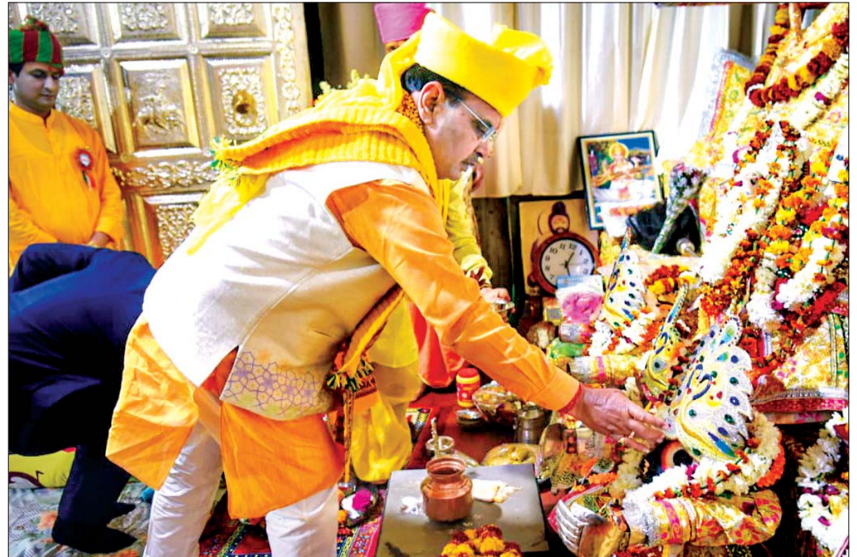
मुख्यमंत्री भजनलाल शर्मा ने करौली जिले के कैमरी गांव में भगवान जगदीश जी मंदिर में पूजा-अर्चना की। इस अवसर पर उन्होंने भगवान जगदीश जी के लक्ष्मी मेला तथा किसान सम्मेलन को भी संबोधित किया।

मुख्यमंत्री ने कैमरी में बालिकाओं के लिए आवासीय विद्यालय खोलने तथा पशु उप स्वास्थ्य केन्द्र को पशु चिकित्सालय में क्रमोन्नत करने का भी