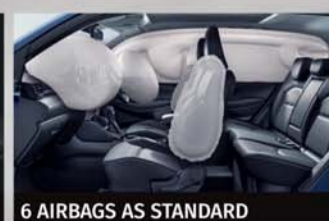
6 AIRBAGS AS STANDARD