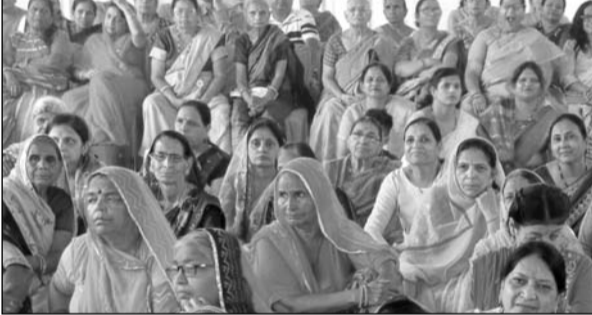
कथा के दौरान श्रद्धालु भाव-विभोर हो उठे और पूरे वातावरण में भक्ति का रस व्याप्त रहा।