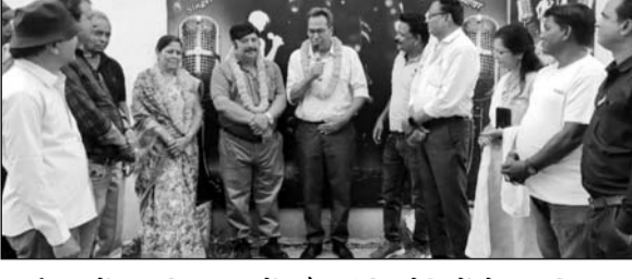
कार्यक्रम में स्थानीय गायकों और संगीत प्रेमियों ने अपनी शानदार प्रस्तुतियों से श्रोताओं का भरपूर मनोरंजन किया।

ब्यावर, (निसं)। सेंद्रा रोड स्थित राजरानी रेस्टोरेंट में कराओके सिंगर क्लब का वार्षिकोत्सव उत्साह और संगीत के रंगों के साथ मनाया गया। कार्यक्रम में स्थानीय गायकों और संगीत प्रेमियों ने अपनी शानदार प्रस्तुतियों से श्रोताओं का भरपूर मनोरंजन किया। रिमझिम बारिश के बावजूद कार्यक्रम देर रात तक जारी रहा और श्रोता संगीत का आनंद लेते रहे।