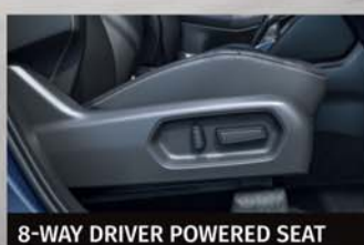
8-WAY DRIVER POWERED SEAT