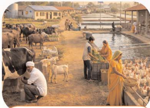
आजीविका के अवसरों का होगा विस्तार