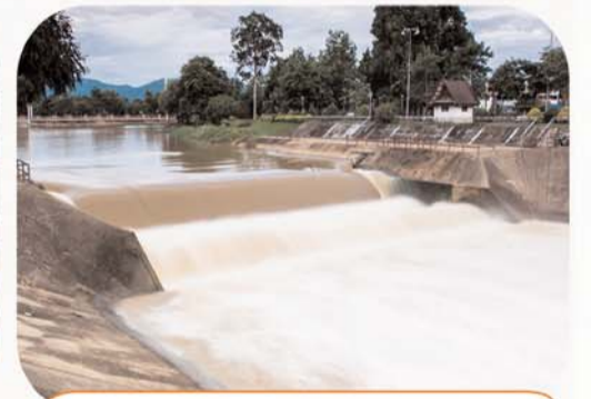
प्रतिकूल मौसमी घटनाओं से बचाव की तैयारी