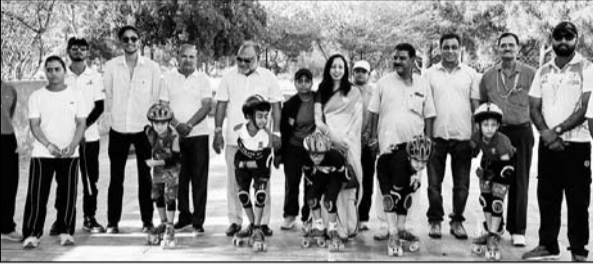
प्रतियोगिता में शहर के 200 से अधिक बच्चों ने भाग लेकर अपनी प्रतिभा का प्रदर्शन किया।