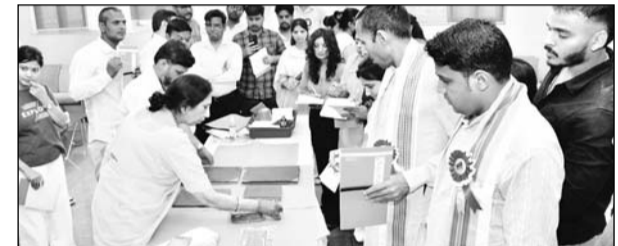
'पांडुलिपियों का निवारण एवं संरक्षण' विषय पर पांच दिवसीय कार्यशाला का आयोजन हुआ।

हरिद्वार में किया जा रहा है। इस मिशन का उद्देश्य भारत की विशाल एवं अप्रमूय पांडुलिपि विरासत का संरक्षण, दस्तावेजीकरण तथा डिजिटलीकरण करना है, ताकि यह प्राचीन ज्ञान-संपदा भावी पीढ़ियों के लिए सुरक्षित रह सके। कार्यशाला का आयोजन पांडुलिपि संरक्षण के प्रति जागरूकता उत्पन्न करने तथा संरक्षण एवं भंडारण