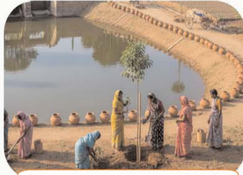
जल सुरक्षा एवं जल संबंधी कार्यों को मिलेगा बढ़ावा

125 दिन की रोजगार गारंटी 1 जुलाई, 2026 से