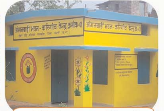
गांवों में मज़बूत बुनियादी ढांचे का निर्माण