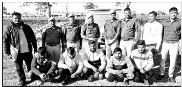
पुलिस ने हमला करने के आरोपियों को गिरफ्तार किया।

अजमेर, (कास)। गेल थाना इलाके में एक युवक पर प्राणघातक हमला करने के मामले में गेल थाना पुलिस ने पांच आरोपियों को गिरफ्तार किया है। आरोपियों के कब्जे से एक बोलरो कार जब्त की गई है। पूछताछ में आरोपियों ने बताया कि गाड़ी को साइड देने की बात को लेकर मारपीट की गई थी। पुलिस गिरफ्तार आरोपियों से पूछताछ करने के साथ ही मामले में फरार हिस्ट्रीशीटर सहित अन्य आरोपियों की तलाश कर रही है।