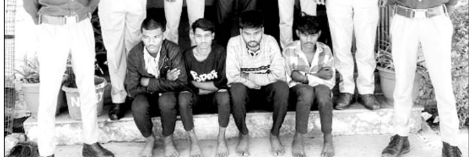
कार पर पथराव कर शीशे तोड़ने के आरोपियों को पुलिस ने गिरफ्तार किया।

डूंगरपुर, (निर्स)। कोतवाली थाना पुलिस ने चार बदमाशों को गिरफ्तार किया है। बदमाशों ने कार और ऑटो के बीच टक्कर के बाद पथराव कर दिया था, जिसमें कार के शीशे फूट गए थे। मामले में पुलिस आरोपियों से पूछताछ कर रही है।