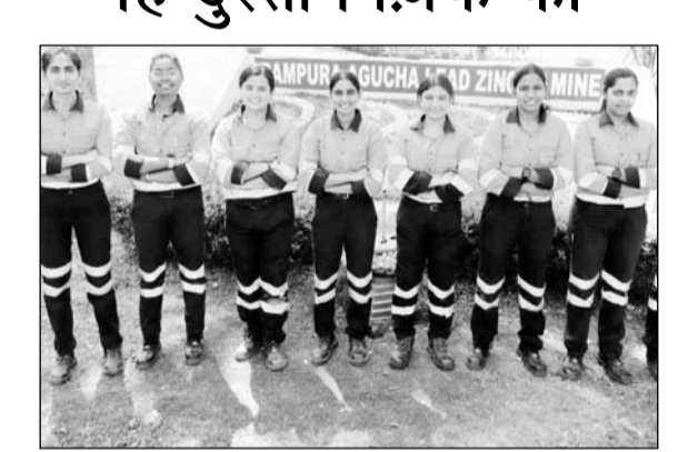
रामपुरा आगुचा माईस में महिला टीम ने पूर्ण प्रशिक्षण किया

भीलवाड़ा, (निर्स)। हिन्दुस्तान जिंक की राजपुरा दरीबा माईस के देश के पहली महिला रेस्क्यू टीम का गौरव हासिल करने बाद रामपुरा आगुचा माईस में महिला रेस्क्यू टीम ने अपना प्रशिक्षण पूर्ण कर देश में दूसरी महिला माईस रेस्क्यू टीम की उपलब्धी प्राप्त की है। रामपुरा आगुचा खदान का सुरक्षा में समावेशित और उत्कृष्टता की दिशा में एक महत्वपूर्ण कदम है।