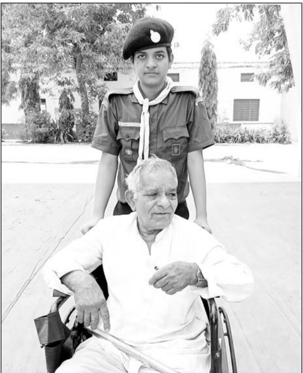
स्काउट गाइड के वॉलियंटर्स बृद्ध व विकलांग मतदाताओं को व्हील चेयर पर बूथ तक लाये।