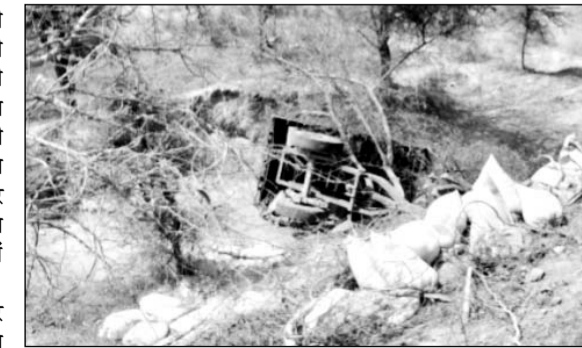
पाटन में टक्कर के बाद गेहूं से भरी ट्रैक्टर-ट्राली खाई में जा गिरा।