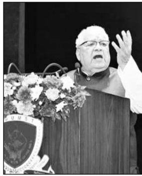
राज्यपाल कलराज मिश्र

जयपुर, (का.सं.)। राज्यपाल कलराज मिश्र ने कहा है कि फेकल्टी डेवलपमेंट के अंतर्गत शिक्षण की बोझिलता को दूर करने के लिए कार्य किए जाने की आवश्यकता है। उन्होंने कहा कि चिकित्सा शिक्षा में जो नवीनतम परिवर्तन हो रहे हैं, उनको सम्मिलित करते हुए नई शिक्षा नीति के आलोक में शिक्षण को प्रभावी किया जाए।