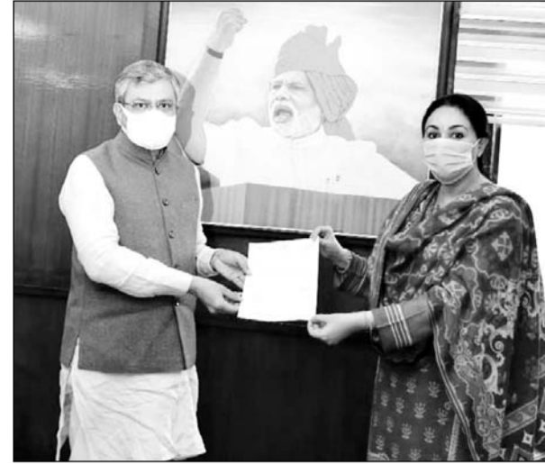
सांसद दीया कुमारी ने केंद्रीय रेल मंत्री अश्विनी वैष्णव से मुलाकात कर मांग पत्र सौंपा।

सांसद ने मावली-मारवाड रेलवे लाइन के आमान परिवर्तन की मांग रखते हुए कहा कि आगामी रेल बजट में इस कार्य को पूर्ण करने के लिए नाथद्वार से देवगढ़ और देवगढ़ से