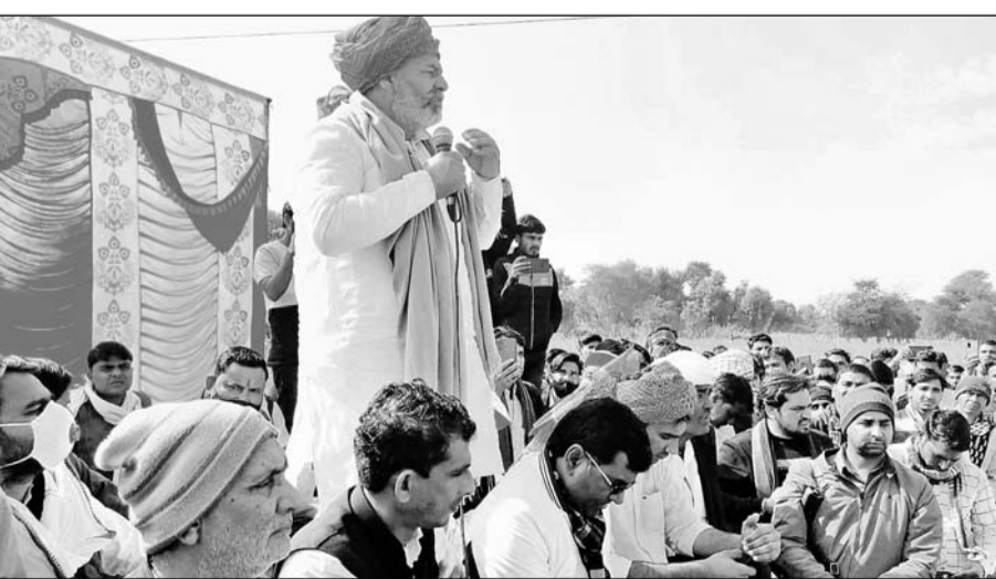
रामगढ़ पंचवारा उपखंड मुख्यालय पर राकेश टिकैत ने किसानों को संबोधित किया।

रामगढ़-पंचवारा, (नि.सं)। उपखंड की जामुन वाली ढाणी में मृतक किसान की जमीन नीलामी प्रकरण को लेकर गुरुवार को किसान आंदोलन के अगुआ राकेश टिकैत ने राज्यसभा सांसद डॉ. किरोडी लाल मीणा पर इस मामले में राजनीति नहीं करने एवं केंद्र सरकार से किसानों के लिए पॉलिसी बनवाने की मांग करने की नसीहत दी गई है। टिकैत ने कहा कि जब प्रदेश सरकार द्वारा नीलामी को निरस्त कर देने वाली आगामी नीलामी को स्थगित कर दिया गया है तो इस मामले को लेकर राजनीति नहीं करने की बजाय केंद्र सरकार में किसानों का पक्ष रखकर उनके हक की लड़ाई लेनी चाहिए। वहीं इस प्रकरण के तूल पकड़ने के बाद अब जिम्मेदार अधिकारियों पर गाज गिरना तय माना जा रहा है।