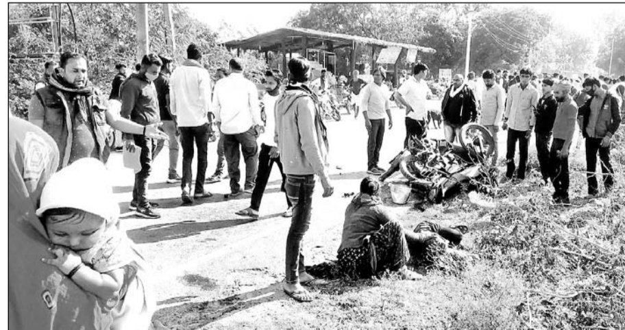
सड़क दुर्घटना के बाद मौके पर भीड़ जमा हो गई।