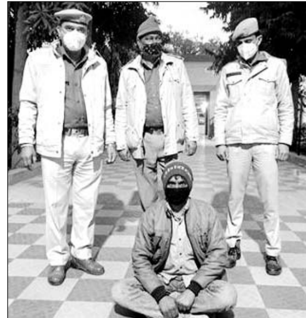
सीआईडी क्राइम ब्रांच जयपुर की टीम ने जम्मू-कश्मीर के अनंतनाग से लाई गई 5 किलो चरस के साथ तस्कर को गिरफ्तार किया।