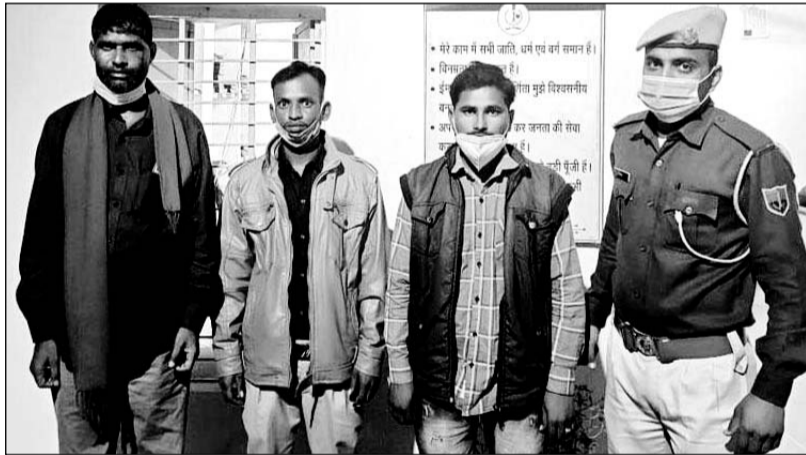
मारपीट व तोड़फोड़ के मामले में पुलिस ने आरोपियों को गिरफ्तार किया।