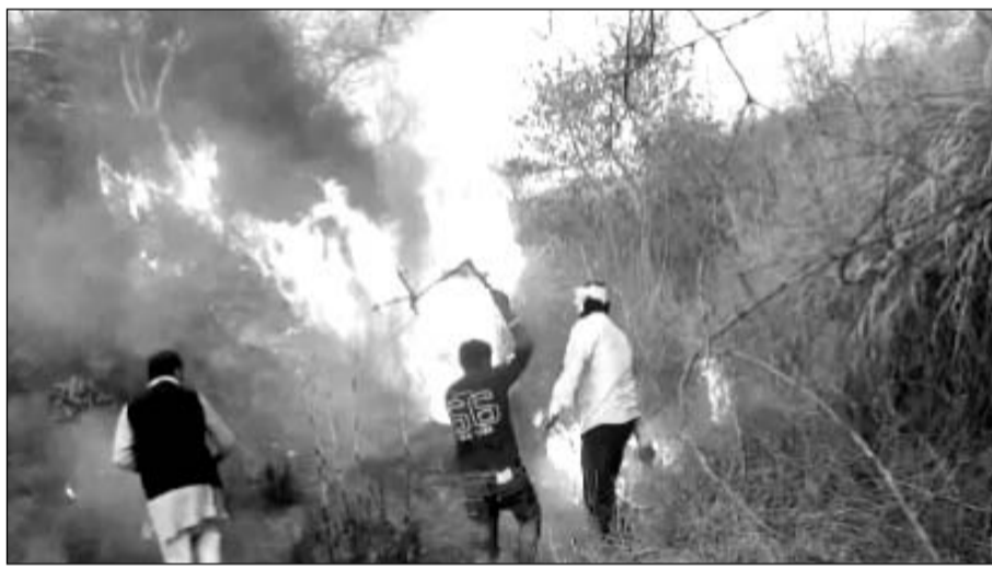
मौके पर पहुंचे ग्रामीणों ने अपने स्तर पर आग बुझाने के प्रयास किये।

सात-आठ घंटे में पाया आग पर काबू, पांच गांव के 250 किसान आग बुझाने में जुटे