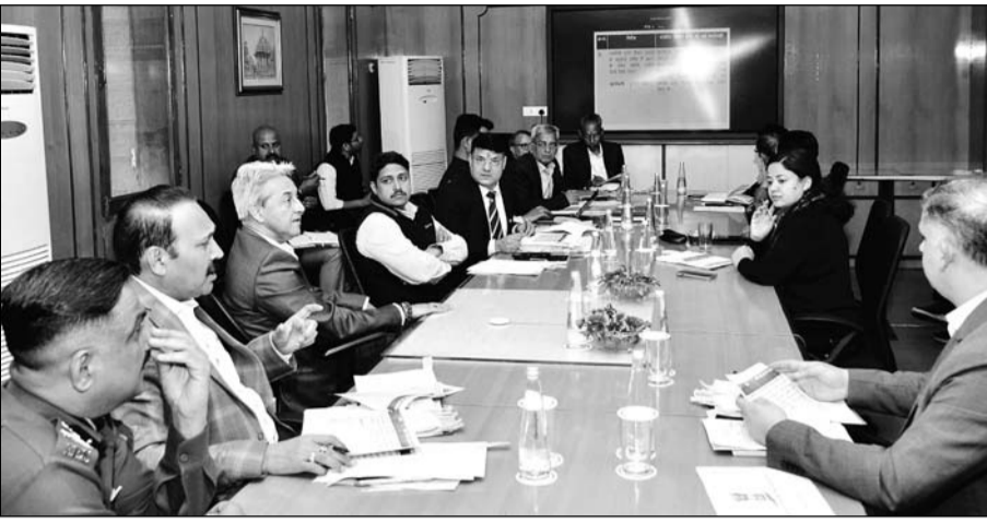
मुख्य सचिव सुधांशु पंत ने मंगलवार को शासन सचिवालय में आयोजित नार्को काउंन्डेशन सेन्टर तंत्र की राज्य स्तरीय कमेटी की बैठक की अध्यक्षता की।

उन्होंने कहा कि युवा पीढ़ी को नशे से दूर रखने के लिए नार्कोटिक्स कंट्रोल ब्यूरो (एनसीबी), पुलिस, परिवहन, सामाजिक न्याय एवं अधिकारिता विभाग सहित सभी संबंधित विभाग और एजेंसियां समन्वय से कार्य करें और ड्रग माफियाओं पर