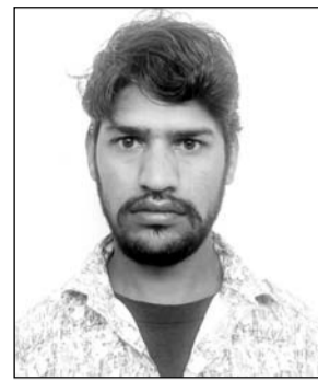
दुष्कर्म का आरोपी

भीलवाड़ा, (निसं)। विशिष्ट न्यायाधीश (पाँको एक) देवेन्द्रसिंह नगर ने पन्द्रह साल की नाबालिग लड़की से गैरेप के मामले में आरोपी को 20 साल की सजा और 90 हजार के जुर्माने से दंडित किया है। आरोपित के दो नाबालिग साथियों के खिलाफ बाल न्यायालय में प्रकरण विचाराधीन है।