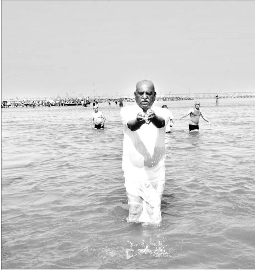
राज्यपाल हरिभाऊ बागडे ने मंगलवार को परिजनों सहित महाकुंभ मेले में त्रिवेणी संगम में डुबकी लगाई। राज्यपाल ने संगम स्नान के साथ ही कुंभ से जुड़ी भारतीय सनातन परंपरा को स्मरण करते हुए कहा कि महाकुंभ स्नान संस्कृति की जड़ों से जुड़ा है। गंगा, यमुना और अरुण सरस्वती के संगम में स्नान से शरीर ही नहीं आत्मा की भी शुद्धि होती है। उन्होंने कहा कि यह भारतीय सनातन संस्कृति में आस्था रखने वाले विशाल जन का आत्मीय समागम स्थल है।