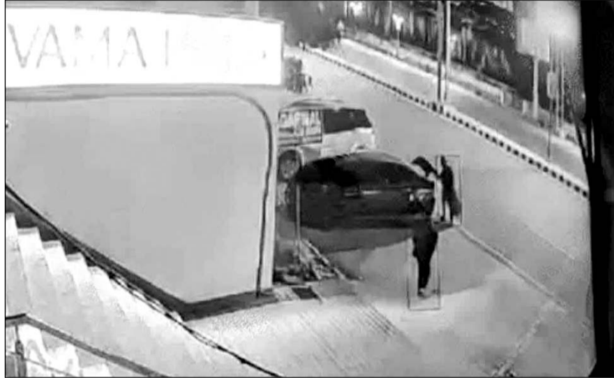
सीसीटीवी फुटेज में तीन युवक प्लास्टिक के बैग में मोबाइल भरकर ले जाते हुए दिखाई दे रहे हैं।

अजमेर, (कांस)। अजमेर के गंज थाना क्षेत्र के वैशाली नगर में सैमसंग मोबाइल शोरूम पर चोरों का धावा बोल दिया। चोर करीब एक घंटे में एक करोड़ से अधिक के कीमती मोबाइल व एसेसरीज चोरी की फरार हो गए। कार में आए तीन लुटेरों ने बेसमेंट में सो रहे चौकीदार को बंद किया और शोरूम में घुसकर वारदात अंजाम दी। चोर शोरूम में लगे सीसीटीवी कैमरों की डीवीआर भी चुरा ले गए। बेसमेंट में लगे सीसीटीवी कैमरे में चोरों की यह वारदात कैद हो गई। सूचना पर मौके पर पहुंची क्रिश्चियन गंज थाना पुलिस और एफएसएल टीम ने मौके का मुआयना कर जांच शुरू कर दी है।